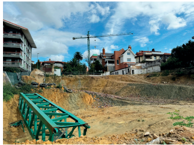
«Irurak Bat» zegoen orubea, hutsik.

Herritarren artean ezinegona piztu da eraikin historiko hura eraitsi izanagatik, eta are gehiago jakin delako Ereaga Atalaya kooperatiba-