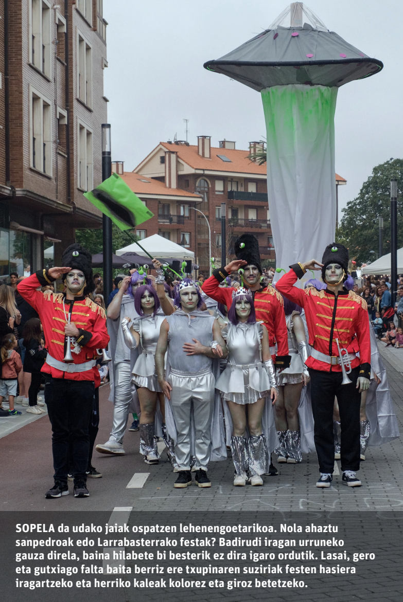
SOPELA da udako jaiak ospatzen lehenengoetakoa. Nola ahaztu sanpedroak edo Larrabasterrako festak? Badirudi iragan urruneko gauza direla, baina hilabete bi besterik ez dira igaro ordutik. Lasai, gero eta gutxiago falta baita berriz ere txupinaren suziarik festen hasiera iragartzeko eta herriko kaleak kolorez eta giroz betetzeko.