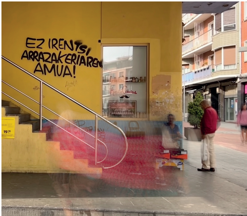
Gorroto-mezen aurrean, jende asko kontzientziatu da gure inguruan.

eraldutzen dutenak. Boteredunek nahi dutenari seinalatzen diote, jendeak alde horretara begiratzen duen bitartean eurek negozioak egiten jarraitu ahal izateko».