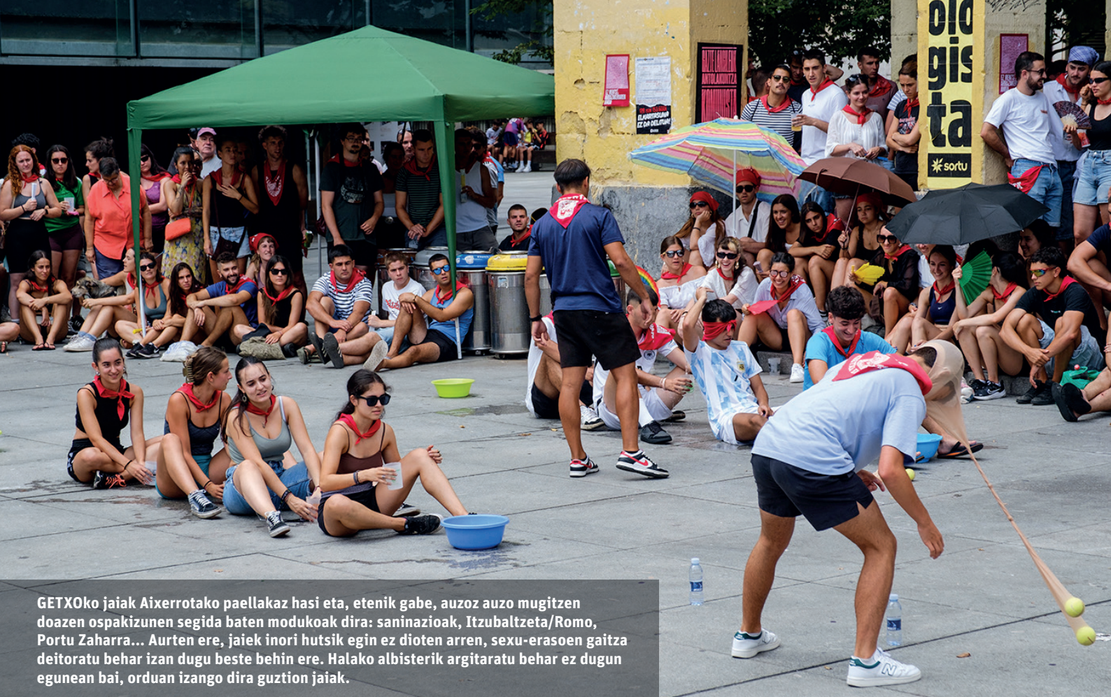
GETXOko jaia Aixerrotako paellakaz hasi eta, etenik gabe, etenez auzo mugitzen doazen ospakizunen segida baten modukoak dira: saninazioak, Itzumbaltzeta/Romo, Portu Zaharra... Aurten ere, jaiek inori hutsik egin ez dioten arren, sexu-erasoen gaitza deitoratu behar izan dugu beste behin ere. Halako albisterik argitaratu behar ez dugun egunean bai, orduan izango dira guztion jaia.