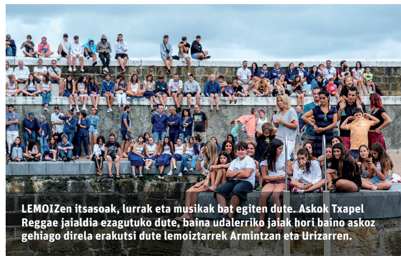
LEMOIZen itsasoak, lurrak eta musikak bat egiten dute. Askok Txapel Reggae jaialdia ezagutuko dute, baina udalerriko jaiak hori baino askoz gehiago direla erakutsi dute lemoiztarrek Armintzan eta Urizarren.