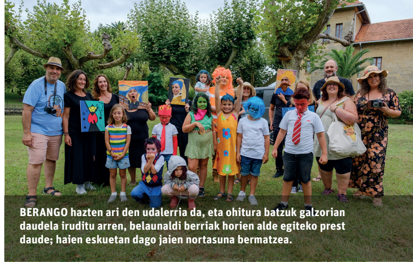
BERANGO hazten ari den udalerrria da, eta ohitura batzuk galzorian daudela iruditu arren, belaunaldi berriak horien alde egiteko prest daude; haien eskuetan dago jaien nortasuna bermatzea.