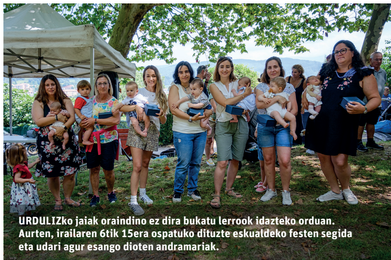
URDULIZko jaia oraindino ez dira bukatu lerrook idazteko orduan. Aurten, irailaren 6tik 15era ospatuko dituzte eskualdeko festen segida eta udari agur esango dioten andramariak.