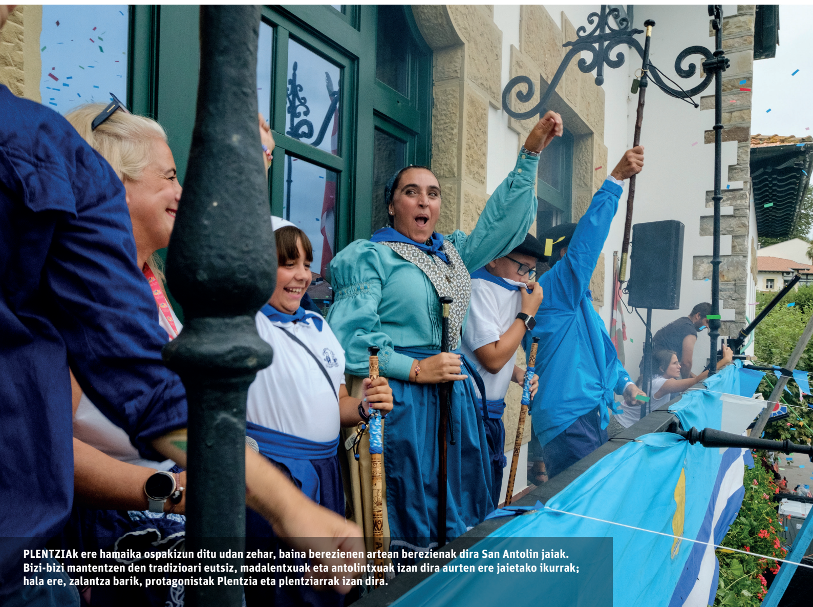
PLENTZIAK ere hamaika ospakizun ditu udan zehar, baina berezienen artean berezienak dira San Antolin jaiak. Bizi-bizi mantentzen den tradizioari eutsiz, madalentuak eta antolintxuak izan dira aurten ere jaietako ikurrak; hala ere, zalantza barik, protagonistak Plentzia eta plentziarrak izan dira.