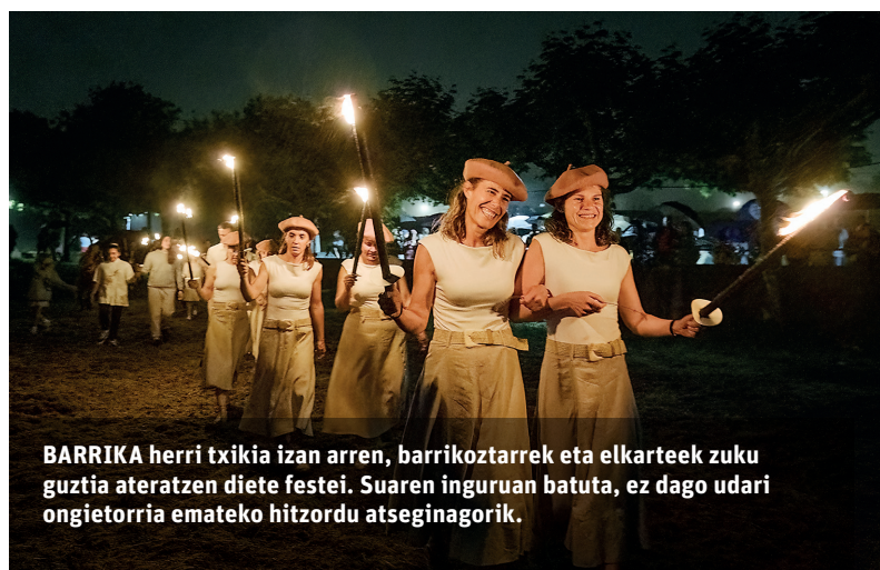
BARRIKA herri txikia izan arren, barrikoztarrek eta elkarteek zuku guztia ateratzen diete festei. Suaren inguruan batuta, ez dago udari ongiatorria emateko hitzordu atseginagorik.