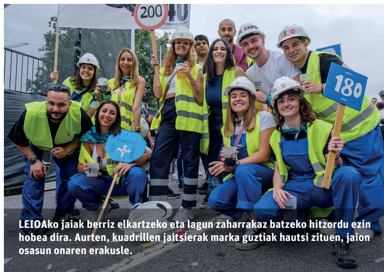
LEIOA ko jaiak berriz elkartzeko eta lagun zaharrak batzeko hitzordu ezin hobea dira. Aurtun, kuadrillen jaitsierak marka guztiak hautsi zituen, jaiön osasun onaren erakusle.