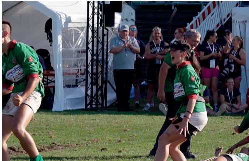
Goiherriko tiralariak.

G uztira hiru domina erdietsi dituzte Erandioko tiralariak irailaren lehenengo aste-akabuan Mannheim (Alemania) hirian egin zen Lur Gaineko Sokatirako Munduko Txapelketan. Kluben arteko lehiaketan, Goiherrik zilarrezko domina bi eskuratu zituen Mundialeko lehen egunean: bata, gizonezkoetan, 560 kiloetan; eta emakumezkoetan bestea, 23 urtez azpiko lehian, 500 kiloetan. Urrea bigarren egunean heldu zen, 23 urtez azpikoen 560 kiloko lehiaketa mistoan; hala, Munduko txapela jantzi zuten erandioztarrek. Selekzioagaz ere joko bikaina egin zuten, eta lau domina poltsikoratu zituzten: urrezko bat eta brontzezko hiru. ◀