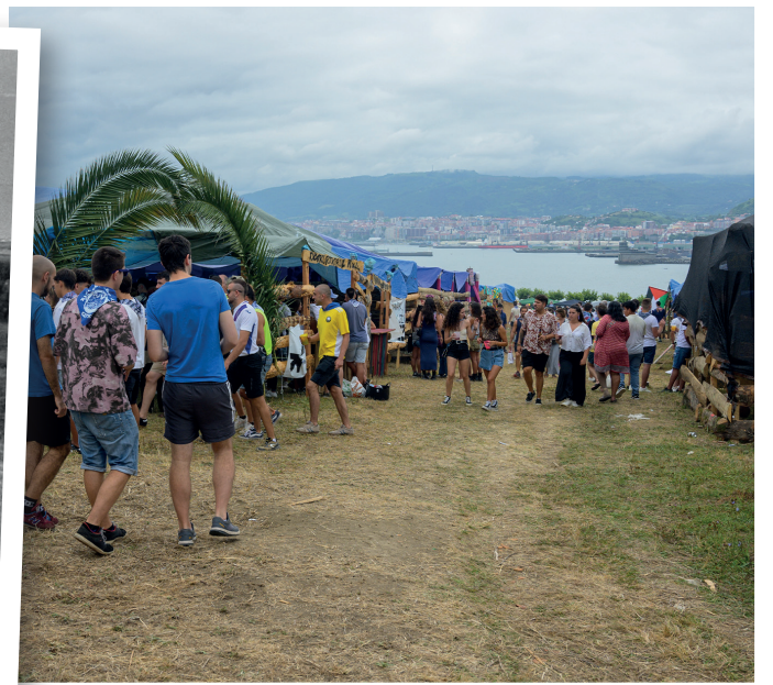
ITURRIA: MEMORIAS DE GETXO