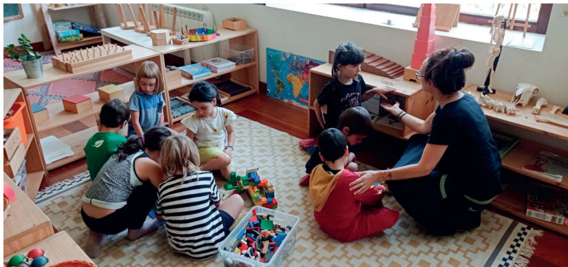
Haurren hazkundea bidelaguntzeko alderdietan murgiltzeko formakuntza eskainiko dugu.

UMEEN IKASKUNTZA-PROZESUA. Prozesua sakonago ezagutzeko eta ulertzeko interesa asetzeko gunea sortuko dugu. Umearen garapen-