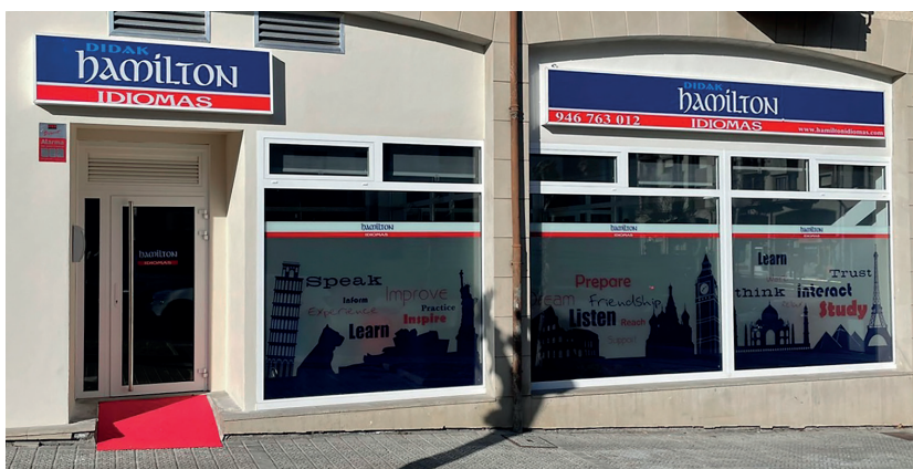
Sopelako zentrora hurbildu informazio gehiago jasotzeko, inolako konpromisorik gabe.

LANGUAGECERT Hamiltonen agiri honi buruz informazioa eskatu. Baliogarria eta erraz ateratzen den ziurtagiria da!