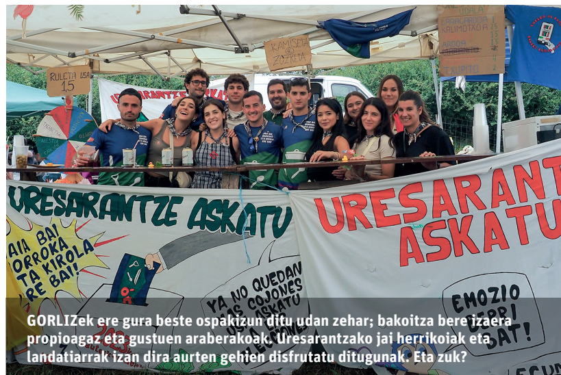
GORLIZ ek ere gura beste ospakizun dituen udan zehar; bakoitza bere jazaera propioagaz eta gustuen arabera. Uresarantzako jai herrikoiak eta landatiarrak izan dira aurtien gehien disfrutatu ditugunak. Eta zuk?