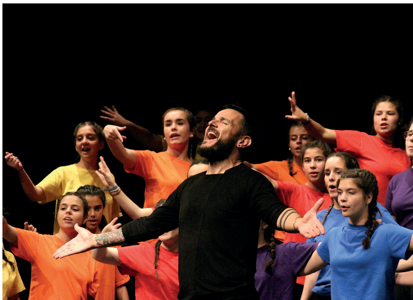
Leioa Kantika Korala 10 eta 18 urte arteko 40 neska-mutirik osatzen dute. BASILIO ASTULEZ

KORUA BAT BAINO GEHIAGO. Zuzendari moduan, bere lana musikatik eta antolakuntzatik harago dagoela gaineratu du. Abeslariak eskatzen diena eskatu ahal izateko, ikuspuntu soziala, hezkuntzakoa, psikologikoa edo lidergoa ere lantzen dituztela dio: «Taipein, 14 egun eman ditugu, eta pentsatu nahi dut ume horien esperientzia oso polita izan dela, bai-