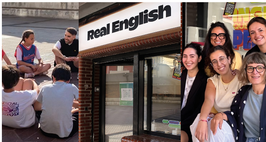
Metodologia komunikatiboa nagusi da Real Englisheko klaseetan.

ZERK EZBERDINTZEN DITU? Konbentzionalismo akademikoetatik ihes egin eta metodologia fresko eta dinamiko baten aldeko apustua egiten