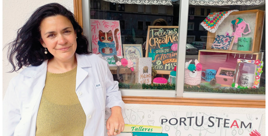
PortuSteam akademiaren barnean, Zientziapolisen proiektua sortu zen. M.A.

Zein da tailer hauen helburua? Jakin-min handia sortzen die haurrei espazioak. Izan ere, gai horri buruz ikastetxeetan ematen den edukia nahiko mugatua da. Beti gauza bera izaten da: planetei eta ilargiaren mugimenduari buruz hitz egiten dute. Eta errealitatea da espazioa askoz gehiago dela. Kuriositate horretatik abiatzen gara.