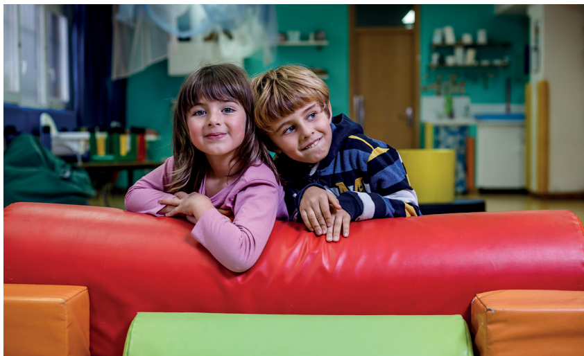
Laugarren aldia da San Nikolas Ikastolak Ibilaldia antolatzen duena.

S an Nikolas Ikastolak, euskal kultura eta euskararekiko duen konpromiso sendoa bermatzen jarraitzeko helburuagaz, Ibilaldiaren 46. edizioa antolatzeko ardura hartu du, maiatzaren 26an ospatuko dena. Kalitatezko hezkuntza eskaintzen duen zentro honek eskarmentu handia da jaialdi hori antolatze-lanetan eta, etengabe eguneratutako hezkuntza-sistema pedagogikoaz gain, eskolaz kanpoko hainbat zerbitzu eskaintzen ditu; haurtzaindegia, jantokia edota Uribe Kosta osora heltzen den garraio-azpiegitura, besteak beste. Guraso-talde baten ekimenez sortutako proiektu honetan, langileak, gurasoak zein ikasleak eguneroko kudeaketan ezinbestekoak dira. Beti ere, euskara-