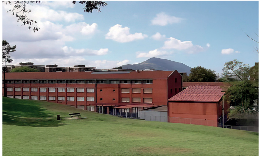
Besteak beste, Batxilergo Artistikoa ere eskaintzen dute bertan.

Euskara du erdigunean. D eredua da nagusi. Normalizazio-talde sendoa dago, eta, gainera, hizkuntza errefortzurako aukera du. Eredue eleanitza dago. English Language Assistant figura ere badu zentroak eta, horri esker, laugarren hizkuntza ere aukera daiteke. Institutua inklusiboa da, aniztasunaren trataera zutabe baitu: dibertsifikazioa, gela egonkorra eta Bidelagun Programa dira bertan. Halaber, bi orientatzaile ditu, baita psikologoa ere. Lehen Ziklorako patio aktiboak dituzte, jolastordu arruntean zein jantokiaren osteko jolas-garaia dinamizatzen aproposak. Komunitateari garrantzia ematen dio, eta, gainera, Gobelako metro-geltokitik hur dago. Askotariko azpiegitura ditu ere, Erromo Txiki eta Erromo Handi erai-