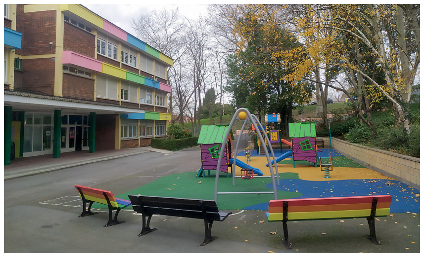
Ikastetxea kutsadura akustikorik gabeko gune natural batean txertatuta dago.

Ikastetxearen helburua da ikasleek gaitasun eta trebetasun emozionalak eta kognitiboak garatzen laguntzen dien prestakuntza eskaintzea. Horretarako, bere Hezkuntza Proiektua baloreetan eta eskola inklusiboaren printzipioan oinarritzen da. Eskola txikia izanda lan-