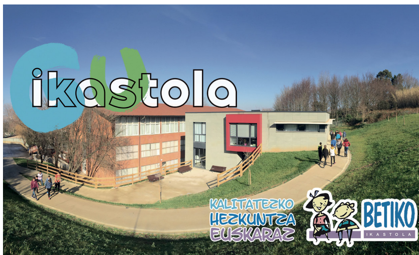
Emozioak eta barne sendotasuna asko zaintzen ditu Betiko Ikastolak.

B etikoren eredu inklusiboak euskara eta euskal kultura ditu ardatz. Euskararen erreferente izan nahi dute, eta horretarako euskaraz bizi eta euskal kulturaren igorle eta bultzatzaile izateko konpromisoa hartua daukate. Ikasleen norberaren garapenerako beharrezkoak diren erabakiak zuzenean familiekin elkarlanean hartzen dituen ikastola da Betiko. Aniztasunari modu inklusiboan erantzuna ematea da bere erronka handienetako bat. Euskal Curriculumean oinarrituz, konpetentziak eta baloreak garatzeko berezko ikasmateriala dauka, HHn KUKU, LH 1-2-3n KIMU eta LH 4tik DBH 4ra EKI proiektuak lantzen dira, haien arteko koherentzia 0-16 tarte osoan zehar bermatuz. Betikon, jantokia ere ere-