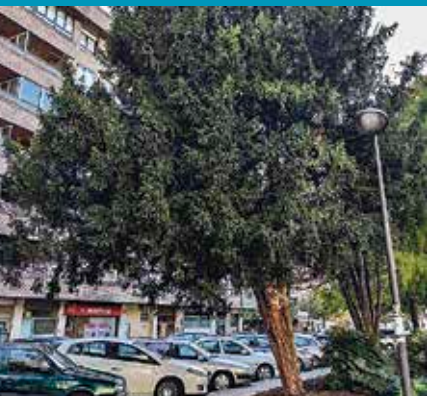
Hagin arrunta Taxus baccata

Enborra marroia eta lodia du. Ariloak salbu, zuhaitzaren atal denek taxina deritzon substantzia toxiko bat daukate: alkaloideen nahasketa bat da, eta dosi handietan, bihotza geldiaraz dezakeen eragin kardiotoxikoa du.