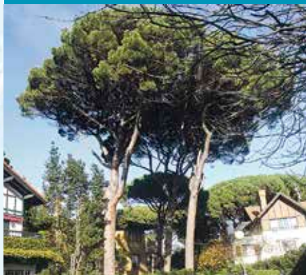
Pinazi pinua Pinus pinea

Pinuak 25-30 metroko altuera har dezake. Pinazia Mediterraneo aldeko hainbat plateretan erabiltzen da, hala nola gozogintzan, entsaladetan eta saltsa plateretan. Lehen afrodisiakoa zela esan ohi zen.