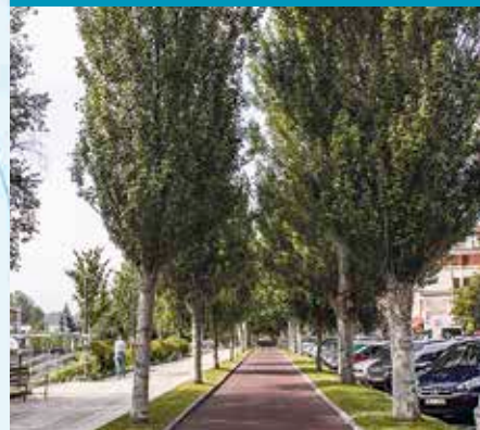
Zumartxuria Populus alba

Zuhaitz hostogalkorra, handia, enbor zabalekoa eta sistema erradikal indartsukoa da. Lore arrak handiak eta horiak dira, gerba esekietan; emeak, aldiz, berdexkak dira, oin banatuetan. Hostoak kimatu aurretik loratzen dira.