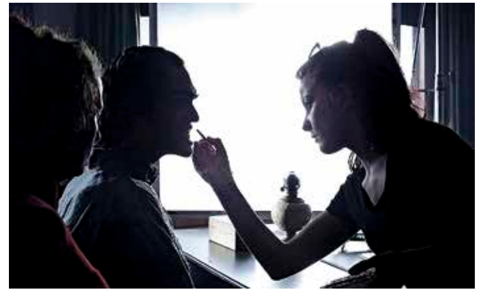
Errodajeen Agarrekin egin zuen lanik handiena.