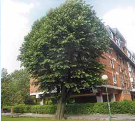
Ezki zilarkara Tilia tormentosa

Zuhaitz indartsua da, eta 30 metroko altuera lor dezake. Beste ezki espezie batzuk baino azkarrago hazten da. Lore zuri edo horixkak ematen ditu, eta usain berezia ematen dute. Ekainaren amaieran edo uztailaren hasieran loratzen dira.