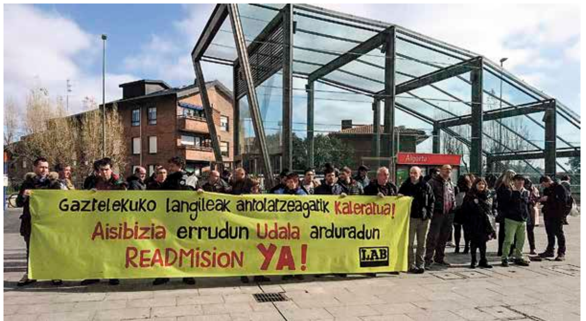
Langilea kaleratu ostean, hainbat mobilizazio egin ditu LAB sindikatuak udalerrian. IKER RINCON MORENO

Azaldu duenez, enpresak zentsutik atera gura izan zuen bera, «kaleratua izateaz gain, aukeratua izatea galarazteko». Hauteskunde-mahaia osatzen zutenek, baina, hura bertan mantentzea erabaki zuten. Horren aurrean, hauteskunde bezperan, Aisi-