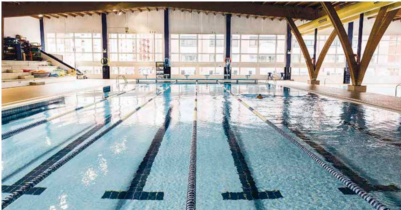
Kirol-elkartek eta bestelako abonatuak pairatzen dabilta grebaren kalteak. HODEI TORRES

Zapatuan hiru hilabete beteko dira kiroldegietako langile gehienek greba abiarazi zutenetik. Kexu dira, enpresak negoziatu gura ez duelakoan.