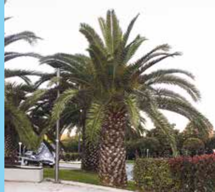
Palmondo kanariarra Phoenix canariensis

Queensland eta Lord Howe eta Norfolk uharteetako da sortzez, Australiakoa. Munduko hainbat lekutan landatu eta naturalizatu egin da. Loreak hermafroditak dira, bakartiak eta hibiskoaren hostoen antza daukate.