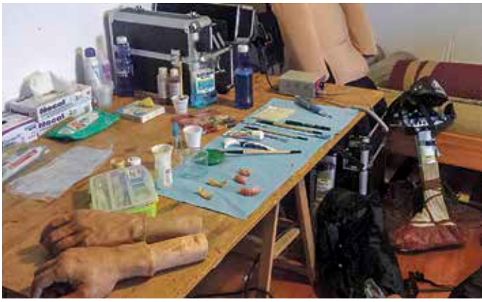
Eneko Sagardoy erraldoi bihurtzeko tresnak.