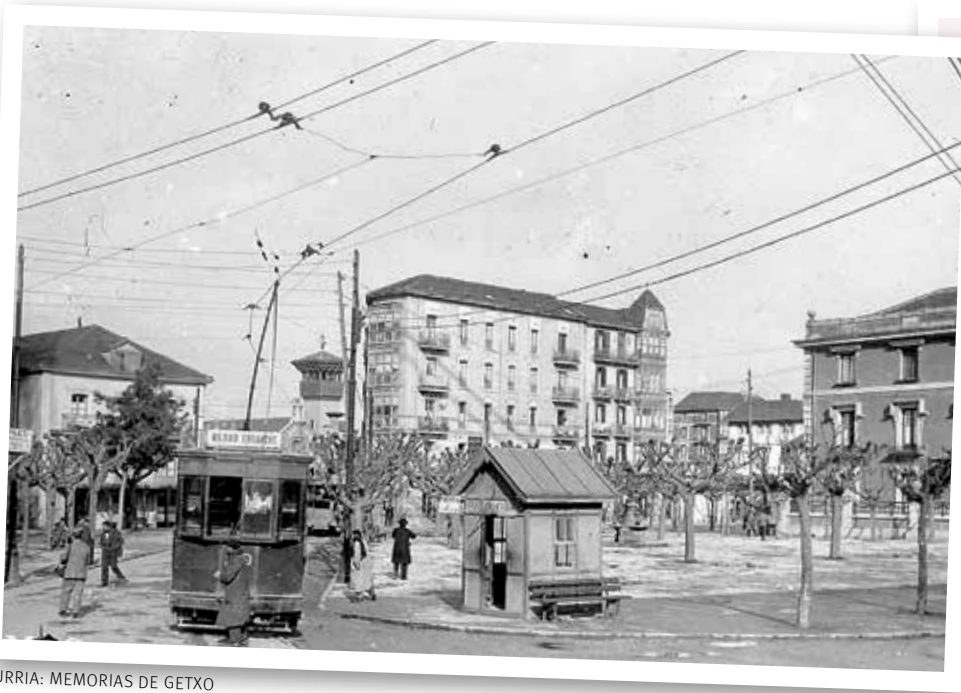
ITURRIA: MEMORIAS DE GETXO