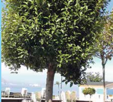
Pika-pika zuhaitza Lagunaria patersonii

Zuhaitz indartsua da, eta 30 metroko altuera lor dezake. Beste ezki espezie batzuk baino azkarrago hazten da. Lore zuri edo horixkak ematen ditu, eta usain berezia ematen dute. Ekainaren amaieran edo uztailaren hasieran loratzen dira.