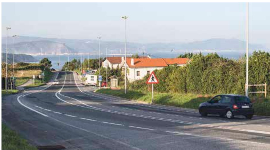
Bidean dagoen abiadura-muga txikitzea proposatu du koalizio abertzaleak.

B arrikako EH Bilduk jakinarazi duenez, 2017an zazpi istripu jazo dira udalerria alderik alde zeharkatzen duen BI-2122 errepidean. Gogoratu dutenez, errepide hori Bizkaiko Foru Aldundiak kudeatzen du, eta horrek aldiro radar mugikorak jartzen ditu inguru horretan, «baina arriskua ez da amaituko isunak jartzearekin». Koalizio abertzaleak gogoratu du duela urtebete errepidearen ondoan bizi diren auzokideek 130 sinadura baino gehiago bildu zituztela eta Udalari zein Aldundiari bidali zizkietela; hala ere, oraindino ez dute irtenbiderik jaso. Besteak beste, arazoa erre-