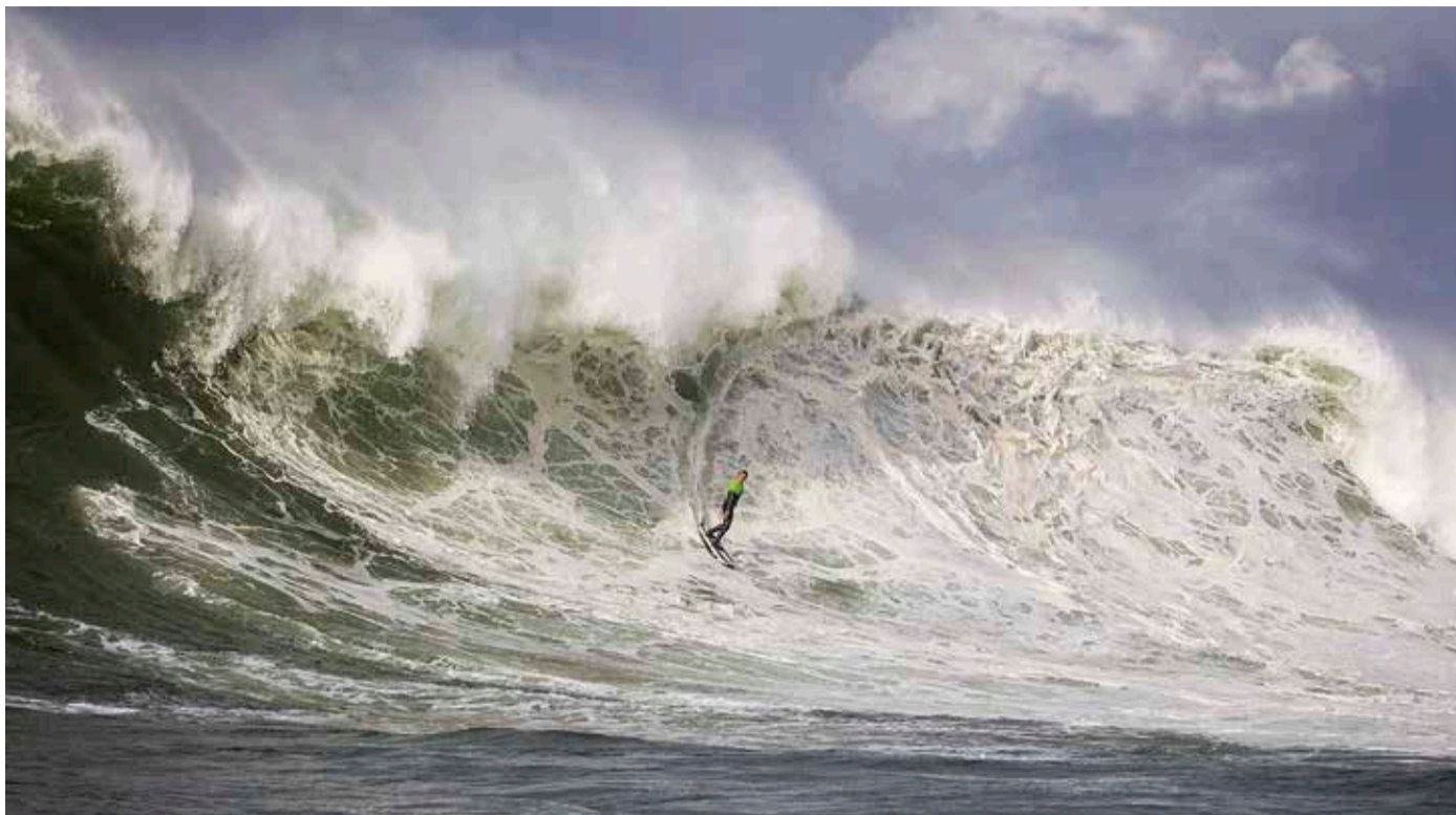
Bost eta zazpi metro bitarteko olatuen zain daude.