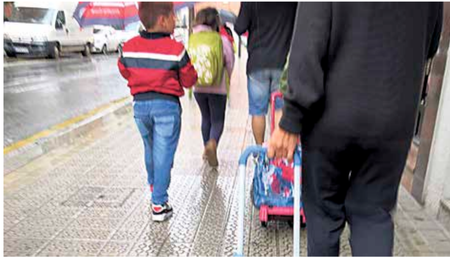
Adingabeen ongizatea lortzea da GETen helburu nagusietako bat.

Leioako Gizarte-hezkuntzako Esku-hartze Talderako (GET) borondatezko langileak biltzeko deialdia zabalik dauka Udalak; astean ordu bi libre izatea baino ez da beharrezkoa, agintari leioaztarrek azpimarratu dutenez. Egitasmo horretan, 5 eta 14 urte arteko neska-mutilakaz lan egiten dute: eskola-kontuetan laguntza ematen diete; berbarako etxerako lanak egiten, edo ikasteko ohiturak indartzen. Borondatezko langileak izan gura dutenek Leioako GETegaz harremanetan ipini beharko dute telefonoz deituz (944 010 911), euren helbide elektronikora