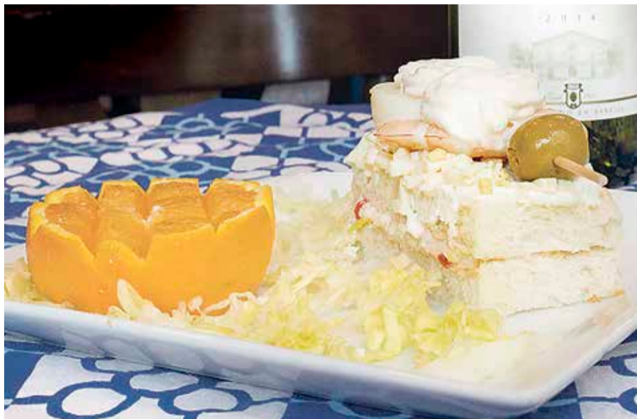
Askotariko pintxoak dastatu ahal izango dira.

Gutizia txikiez gozatzeko aukera bi egongo dira Getxon: batetik, Getxo Dastatu Pintxo Ibilbidea, urriaren akabuan; bestetik, GetxOnegin! lehiaketa, azaroan.