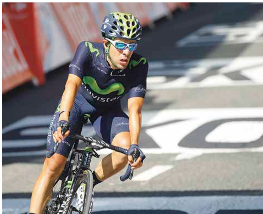
Castroviejok azpimarratu du Sky «taldearen indarra».