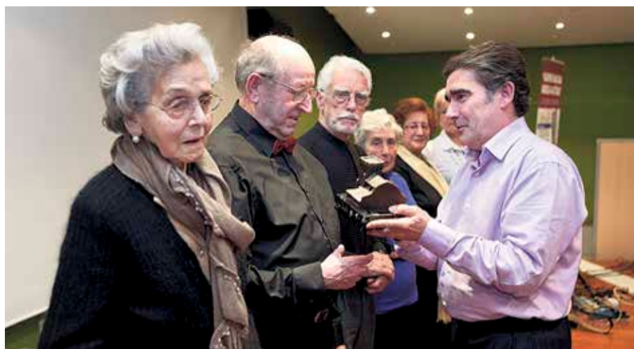
Adinekoen Ekimenak lehiaketa iaz ere egin zuten Erandion.

Ondasun Higiezinaren gaineko Zerga (OHZ) arautzen duen zerga-ordenantza aldatu du Erandioko Udalak. Hala, udalerriko lokal komertzialek eta industria txikiek % 6 gutxiago ordaindu beharko dute, aurreko ekitaldiagaz alderatuta. Neurri horregaz, sektorea «lagundu» gura du Udalak. Era berean, etxebizitzek % 2ko murrizpena izango dute baita ere. Aldaketa horiek Gobernu-taldearen (EAJ eta PSE-EE) babesa izan zuten; talderik gabeko zinegotzia abstenitu egin zen bozketan eta EH Bilduk, PPK eta Ganemosek kontra egin zuten. Hala, industria- eta komertzio-negozioren indize orokorra % 0,7206tik % 0,6774ra eta % 0,2557tik % 0,506ra pasako da, hurrenez hurren. ◀