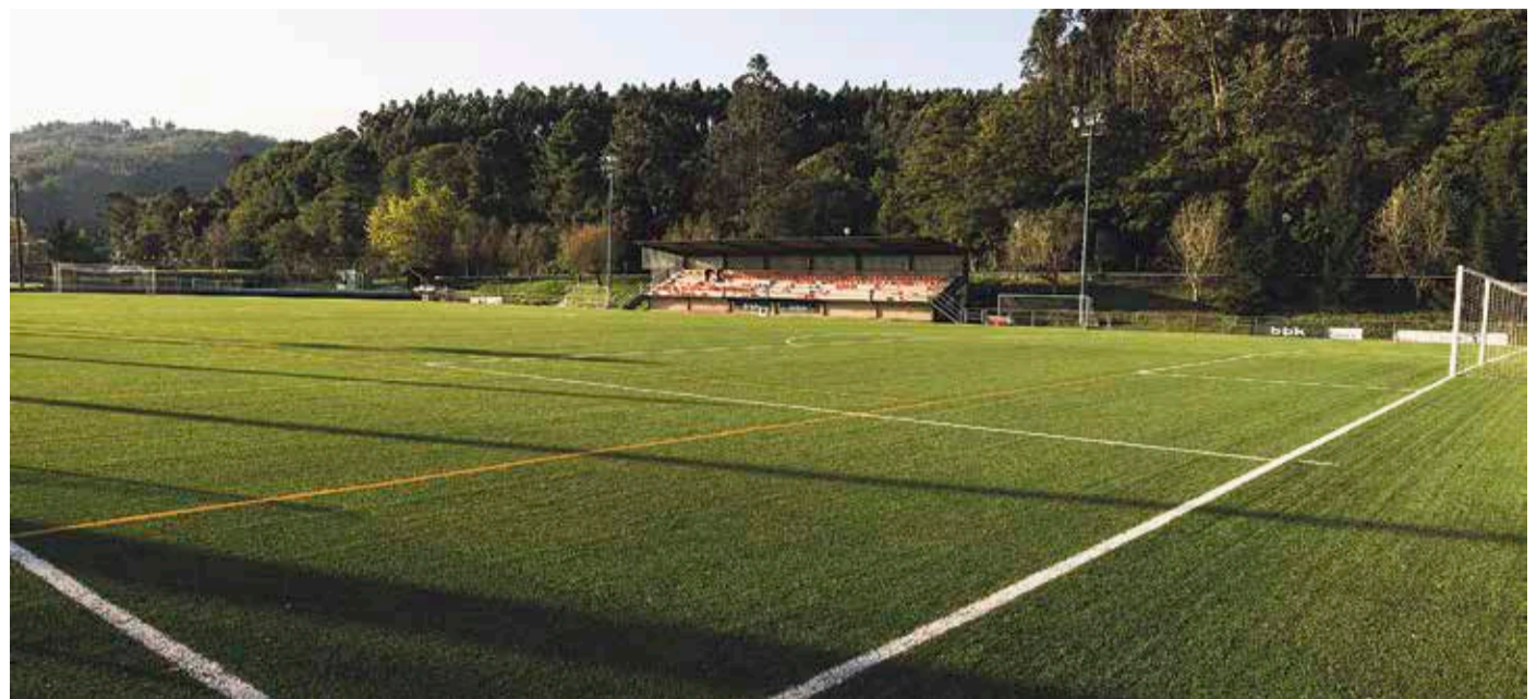
Futbol-zelaiko harmaila berrituko dute, besteak beste.

Udalak bi «puntu garbi» ezarri ditu hiribilduan, bata Goñi Portal kultur etxean eta bestea udaletxeko sarrean. Horren helburua da etxeko hainbat tresna batzea ondoren birziklatu ahal izateko. Puntu horietan material bereziak utzi ahal izango dira, berbarako idazteko materiala (boligrafoak, luma estilografikoak, arkatzak, fluoreszenteak, errotulatazaileak, markagailuak eta zuzentzekoak. Ezin dira bota guraizeak, itsasgarriak, borragomak, arkatzak eta erregelak); fluoreszenteak eta bonbillak (deskargazko lanpara, kontsumo gutxiko bonbillak eta fluoreszenteak. Ezin dira bota filamentuzko bonbillak eta halogenoak); CDak eta DVDak; eta tinta-kartutxoak, toner-kartutxoak eta telefono mugikorak. ◀