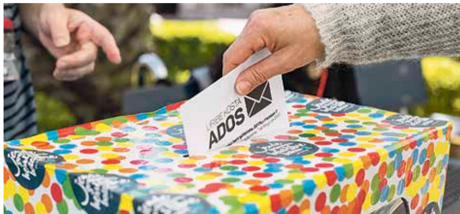
Azaroaren 5ean egingo dute herri-galdeketa eskualdeko hainbat herritan.