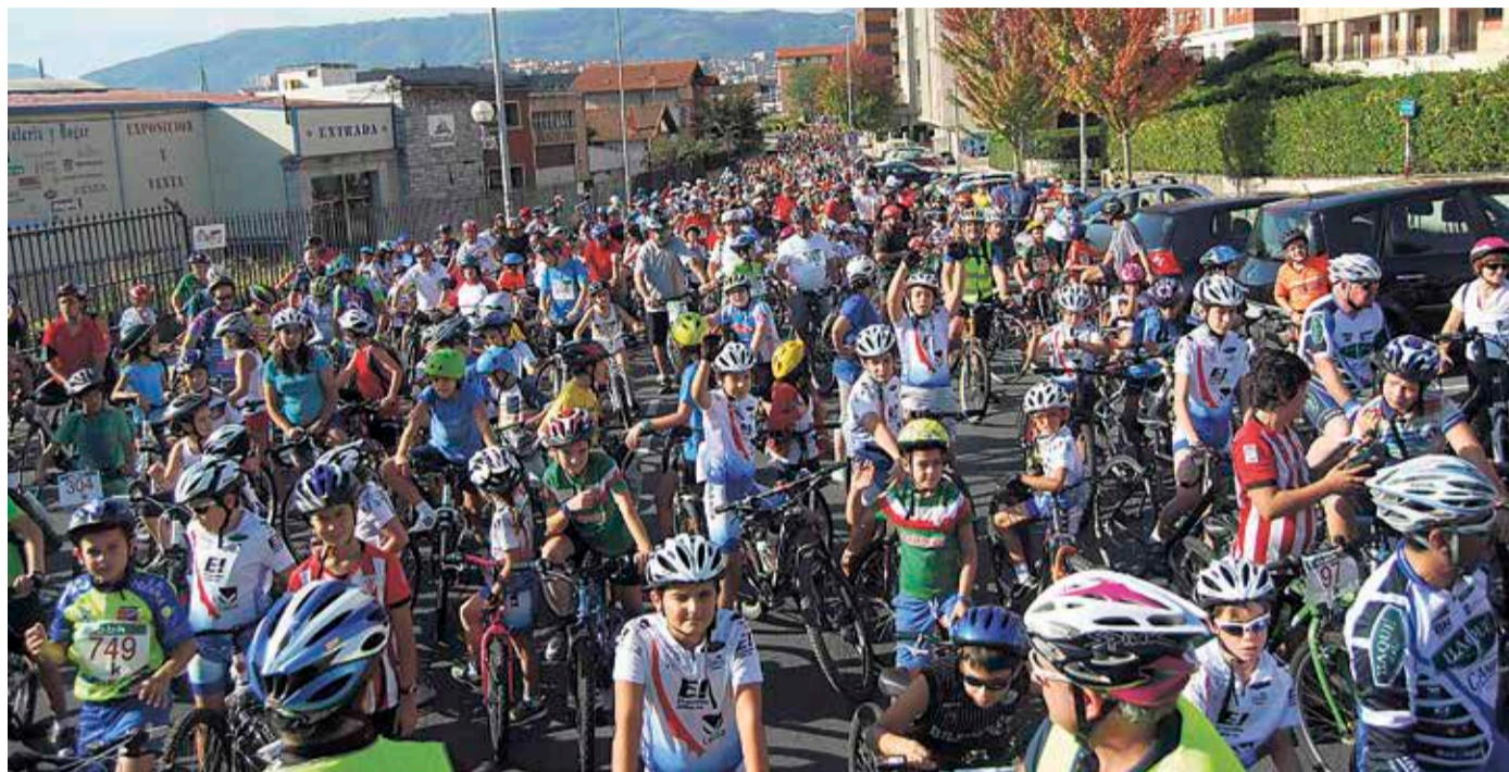
Helduek ez dute festan izena ematerik, adingabeko bategaz edo bigaz joan ezean.

Eskualdeko txirrindulari gazteen eguna bihurtu da urteen poderioz Umeen Bizikleta Festa. Elkar Kirolak txirrindularitza-eskolaren ekimen ikusgarriena da.