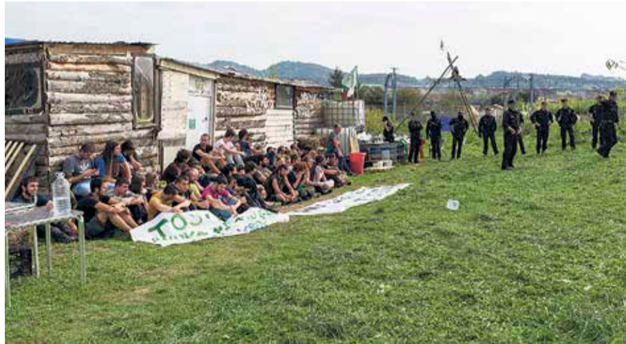
Landa hustu heinean, aparkalekua egiteko lanak abiarazi zituen enpresak.

Martitzenean, goizeko 08:00etan hurreratu zen Ertzaintza Getxoko Tosu landara, ortu okupatuan kanpatuta zeuden ekintzaileak kanporatu eta