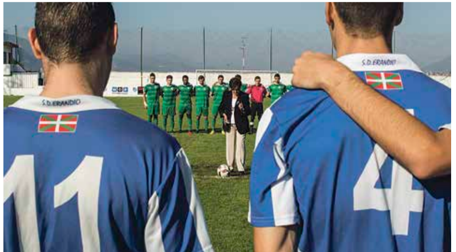
Joan den asteko ekitaldian eta duela 50 urteko inaugurazioan Erandiozaleak jai-giroan murgildu ziren.

tuak ez zuen norabide hori hartu. Horren ordez, Aurrekoetxeak oroitu duenez, Bilboko udaletxera joan ziren eta bertan ezagutu zuten lursailen birkalifikatzeak zelan egiten ziren. Hala, Bilboko Hiri Antolamendurako Plan Orokorrean (HAPO) aldaketa bat egitea eskatu zuten, klubaren lursailen etxebizitzak eraiki ahal izateko. Udalak aldaketa onartu zuen eta futbol-zelaia eraikitzeak soberan zituzten lurak eraikuntza enpresa batez negoziatu zituzten.