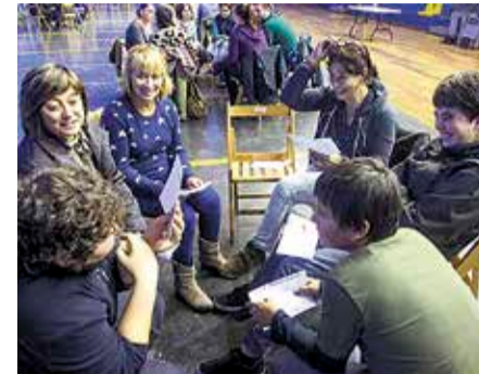
Mintzalagunak, Sopelako udal-pilotalekuan.

«Denak izango dira ondo etorriak, edozein dela euskaraz hitz egiteko gaitasuna; baldintza bakarra euskaraz hitz egiteko gogoia izatea da», adierazi dute udal-iturri sopoloztarrek. Gaineratu dutenez, «bakoitzak duen euskara maila duela ere, aukera ezin hobea