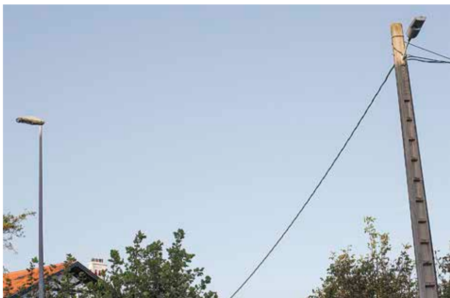
Konponketakaz, beharrezkoak diren segurtasun-baldintzak bete gura ditu Sopelako Udalak.