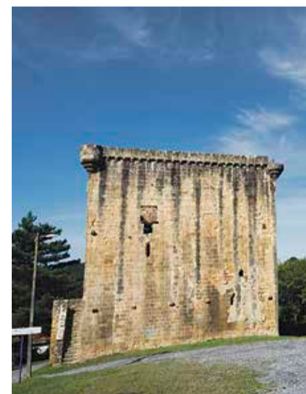
Aurretik izena eman beharra dago.

Arenas futbol-klubak eta Sports Unlimited enpresak hitzarmen bat sinatu dute, kirol-elkartearen harrobiko jokalariek gazteei begira. Futbolari horiek aukeran izango dute AEBetako 400 unibertsitatearen batean goi-mailako ikasketak egiteko, lau edo bost urtean, bekadun izanda. Karrera ikasi bitartean, futboleko jokatzen segituko lukete, «baldintzarik onenetan», Arenasek zabaldu duenez. Bekak estaliko lituzke maila-profesionaleko futbol-praktikak: arropa, materiala, hegazkin-bidaia, hotelak eta instalazioak. Gainera, beka egonaldia eta ikasketen gastuak ere bere gain hartuko lituzke. Unibertsitate-zentroen gaineko informazioa eta beka lortzeko izapide denak erraztuko lituzke Sports Unlimited enpresak. Hala, Arenasek «aitzindari-tzat» jo du bere burua, jokalariei horrelako eskaintza egiteagatik. Hitzarmena denboraldi baterako da, baina luza liteke datorren ekainean. ◀