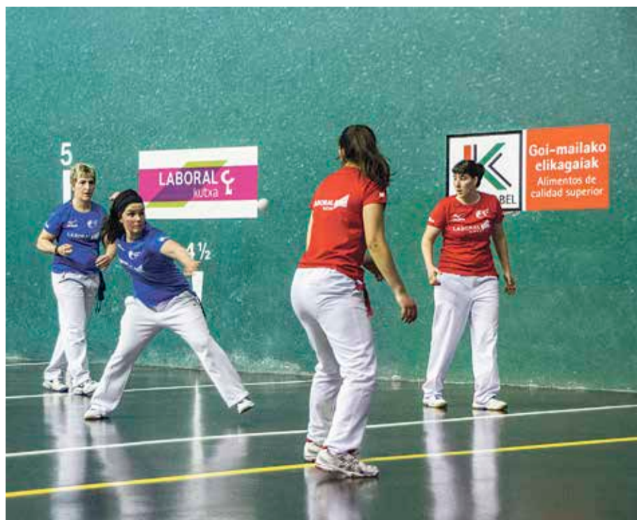
Antolatzaileek «uste baino askoz pilotari gehiagok» eman dute izena.