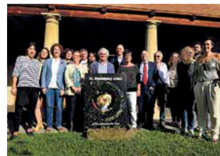
Abenduaren 6tik 10era egingo da.