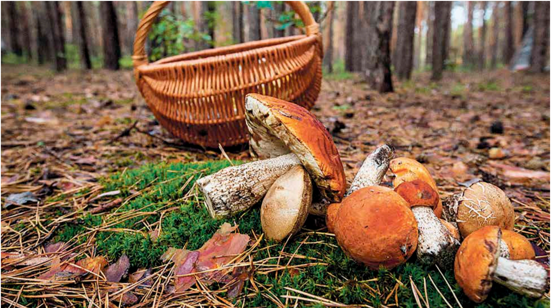
Perretxikozaleen sasoia heldu da, oraindino «eguraldia lagun» ez izan arren.