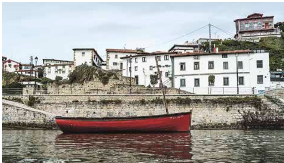
info+: www.4omayo.com edo www.facebook.com/4oMayo

U dari ondoetorria egiteko jaialdia antolatuko dute Algortako Portu Zaharrean ekainaren 10ean eta 11n. Maiatzak 40 goiburuagaz, bertakoak eta bertako ohiturak gogoan hartzeko eta portuak berak «bizikidetzako espazio gisa duen berezitasuna aitortzeko jaia» izango dela azaldu dute antolatzaileek. Jaialdiak hainbat arte-diziplina izango ditu, berbarako zinemagintza, argazkigintza, musika, pintura, poesia eta teknologia berriak. Helburua da Portu Zaharreko bizilagunen eta guneen tradizioak eta memoria historikoa sendotzea, «belaunaldien arteko erreleboa