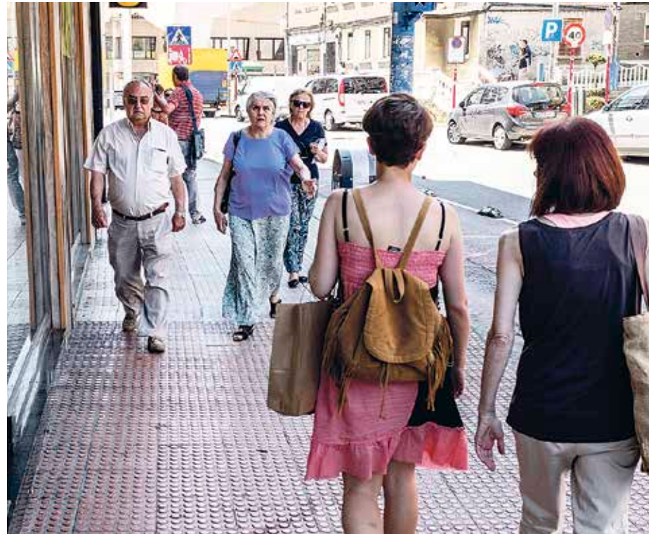
Tailerron ostean IV. Berdintasun Plana osatu gura du Udalak.

kuntza pertsonalerako, talderako eta sozialerako baldintzak sortzearen garrantziaz egingo dute berba. Hurrengo egunean, hilaren 16an, «Autonomia, gizartratzea eta erraztasuna ibiltzeko: denontzako Getxo udalerria» izeneko tailerra egingo dute. Eztabaida ere zabalduko dute: askotariko bazterketa jasaten duten emakumeen esperientziez, eta euren autonomia ekonomikoa sustatzen duten baliabideez, eta inguru jasangarriagora heltzeaz jardungo dute. Azkenik, hilaren 22an, eguaztenean, ugalketari eta sexu-osasunari helduko diote, eta horregaz batera, familiarteko eta elkarteetako zaintza ere izango dute berbabide. Tailerrok Algortako Jabekuntza Eskolan (Martikoena, 16) izango dira, 18:00etatik 20:30era. Parte hartu gura dutenek hemen eman dezakete izena: Berdintasun Zerbitzuan, 944 660 136 telefono-zenbakian edo berdintasuna@getxo.eus helbidean. ◀