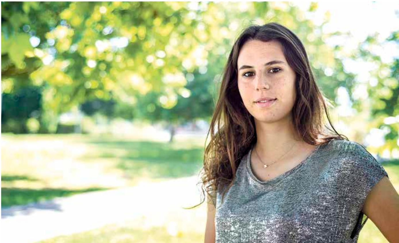
Bolue utzi, eta 2011n Lezaman sartu zen Torre. Denboraldi honetan heldu da Athleticen lehenengo taldera.