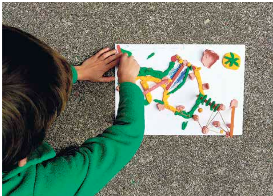
Gaur egungo jolastokia aztertu eta etorkizuneko diseinatu dute ikasleakaz batera.

Elkartoki programa garatu du ikasturte honetan San Nikolas ikastolak, Ttipi Studio kooperatibagaz batera; ikasleen parte-hartzeagaz jolastokia diseinatu eta aldatu dute.