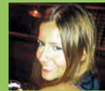
LAKA ALGORTA Laguntxoentzako partez

Zorionak, Gandiiii!! Joan den astean izan zen arren, ez zaitugu zorion agur gabe utzi nahi... barkaiguzu atzerapena! Pilo bat musu eta bizipoz, jaizale barrikotzar guztion partez!