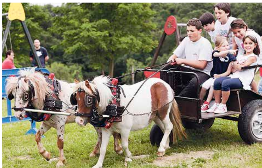
Aste bi barru Kukularrako jaiak izango dira.

Faoetako eta Goierriko jaiak San Bernabe eta San Antonio omenduko dituzte, aste-akabu honetan.