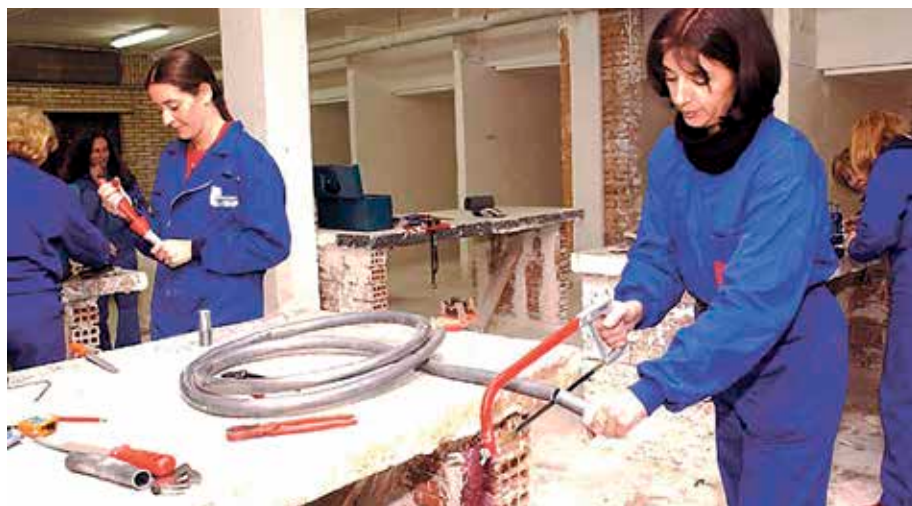
Peoi postuak 23 izango dira.

E randioko Udalak langabezia dauzen 31 auzotarri behin-behineko lanpostu bana emango die. Ekimena aurten go Enplegu Planaren barruan dago. Daborduko, hainbat lanpostutarako izena eman, eta zozketan parte hartzeko epea zabaldu da. Oraingo, gizarte-hezitzaile, peoi, etxez etxeko laguntzaile eta astialdiko begirale izateko inskripzioak egin daitezke. Gutunez auzokideei jakinarazitakoaren arabera, Erandioko Udalak «erandioztarron bizi-kalitatea hobetzeko asmoz, udalerrian enplegua sustatzeko apustua egin du». Udalaren apustu hori aurten