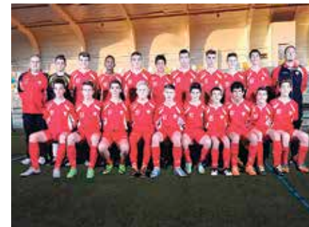
Talde txapelduna.

Gustatuko litzaidake Athletic egaz den-dena irabaztea. Posible bada, orain Erreginaren Kopa irabazi gurago nuke, lehenengo aldiz. Klubak inoiz ez du Kopa irabazi, atarian gelditu da birritan, baina ez du irabazi, eta, halandaze, helburua, epe laburrean, Kopa irabaztea da. Tarte luzeagoi dagokienez, hurrengo urteotan ikusiko dugu nola doan kontua. ◀