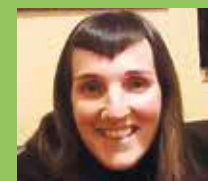
NERE ALGORTA Senideen partez

Zorionak, Superlaka!! Ez zaizkizu zimurrak urte gehiago egiteagatik aterako, hainbeste barre egiteagatik baizik. Eta guk zurekin!!! Atera zurito batzuk eta goazen ospatzera... muua!