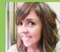
JUGAITZ BITARTEAN Lagunen partez

Alvaritoooooo, zorionakkkkk!!!! ibiltzen ibiltzen ari naiz... benga zure herriko bideetara!!! Zure zain gaitugu, kuis!! Atera itzazu kaña batzuk eta goazen ospatzera! Musu potoloaaa!