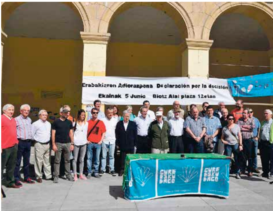
Maiatzaren 21ean egin zuten Adierazpenaren aurkezpena, San Nikolas plazan.

Getxoko Gure Esku Dago taldeak Erabakiaren plaza ekimena ezagutaraziko du ekainaren 5ean. Horretan parte hartzera dei egin die herritar guztiei.