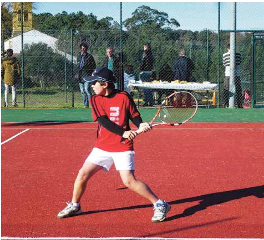
Begirale denak dagokien tituluaren jabe dira. © ABAROA

B arrikako Udalak eta Abaroa tenis-taldeak daborduko zabaldu dute udalekuaren 7. ediziorako izen-ematea. 6 eta 14 urte bitarteko neska-mutilei dago zuzenduta, barrikoztarrak izan ez arren. Ekainaren 27tik abuztuaren 12ra egingo dute campusa, astegun goizetan, aste solte batean eta hiru hamabostalditan banatuta.