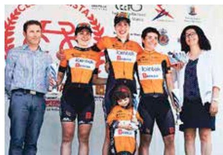
Txirrindulariak Murtzian.