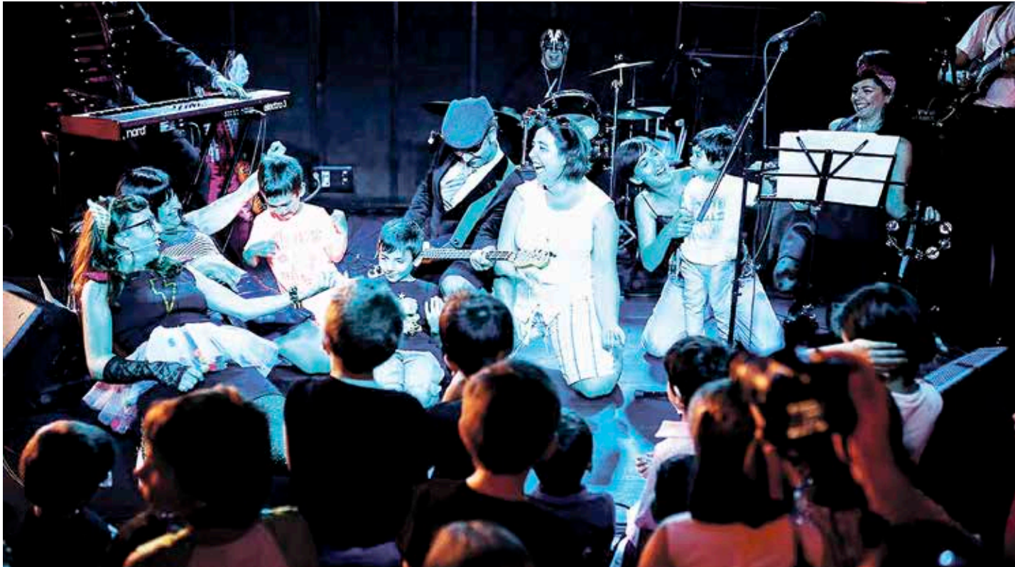
Bertoko musika-taldeakaz, familia-giroan gozatzeko aukera eman gura du Stereosonik kultur elkarteak.