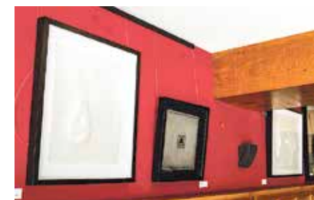
Maiatzaren 14an inauguratu zuten erakusketa.

13:00 Skratx lana (Ameztu), Algortako Zubilleta auzoko zelaian. Denentzat. Euskaraz. Sarrera, doan.