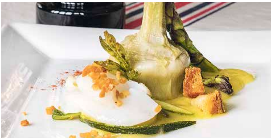
Pintxoak 1,30 euroan egongo dira salgai.