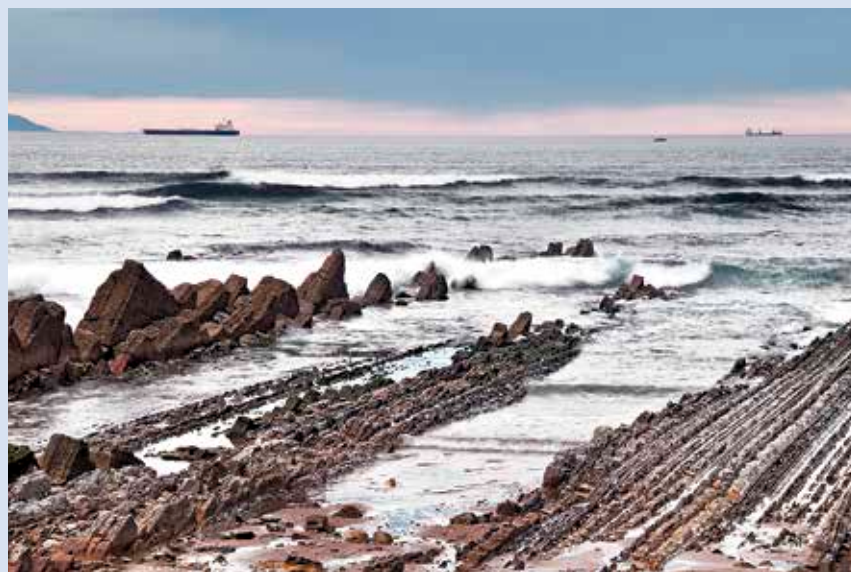
Itsaslabbarrak eta Sopelako geologia ezagutzeko egundoko aukera.