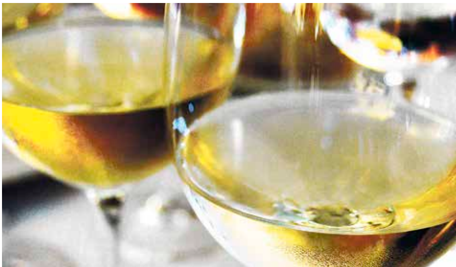
Guztira, 11 etxola ipiniko dituzte Sabino Arana kalean.