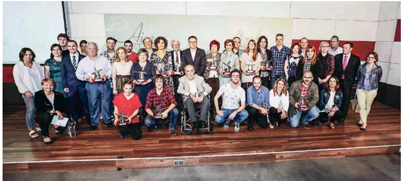
Sari-banaketa maiatzaren 26an izan zen, Algortako Fadura kiroldegiko areto nagusian.

Kulturarekiko duten konpromisoagatik, Getxoko 14 ekimen eta eragilek jaso dute «Aixe Getxo!» saria.