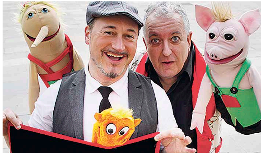
Antzezikizuna taldeak euskaraz eta italieraz eskainiko du La famiglia Toronbole . © GKE

Animatzen bazarete, baztertu aurreiritziak mesedez, ahaztu antzerki tailerreko emanaldia dela, ez eman bueltarik amateur/profesional izatearen esanahi ekonomiko zein filosofikoei. Etor zaitezte eta besterik gabe goza ezazue ikusiko dituzuen pertsonaia eta egoerekin, ondo pasako duzue eta gainera debalde izango dira biak, funtzioa eta baita ondo pasatzea ere. ◀