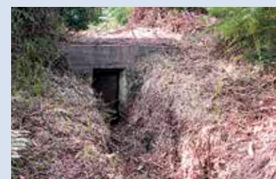
Burdin-hesiaren aztarnak, Sopela eta Berango artean.