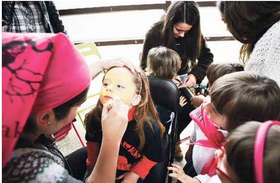
Txikienguzko ekitaldi ugari egongo da.