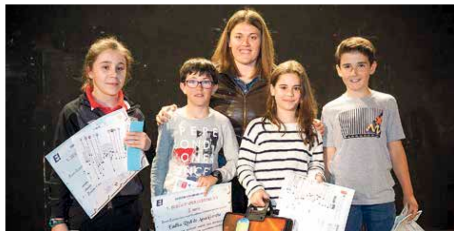
Bertso-paper lehiaketaren irabazleak.