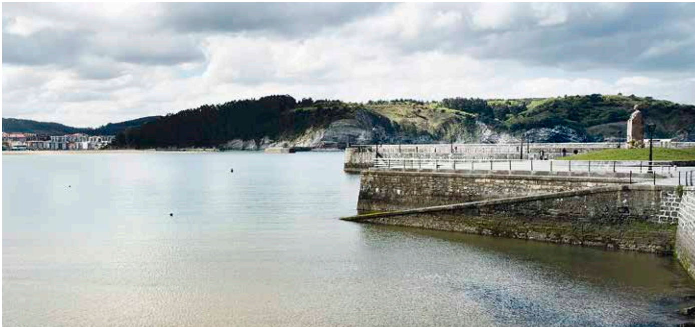
Udalerriko boluntarioek garbituko dute domekan herriko kostaldea.

Bainu-denboraldiari behar bezala ekiteko, udalerriko kostaldea garbituko dute domekan, hilaren 5ean.