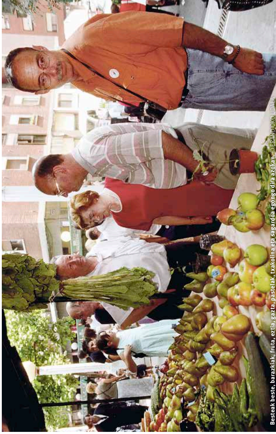
Besteak beste, barazkiak, fruta, ezti, gazta, pastelak, txakolina eta sagardoak egongo dira azokan.