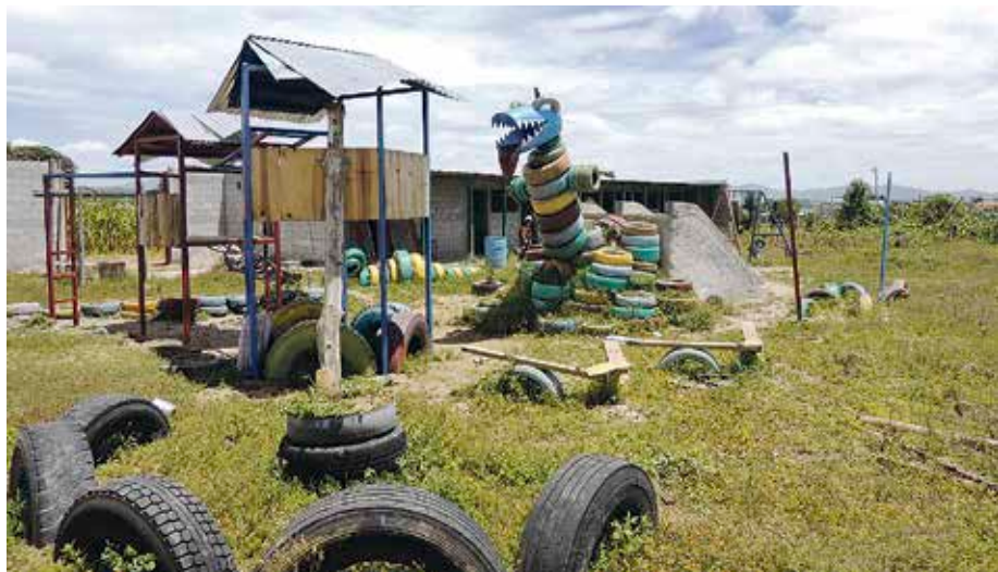
Guatemalako Patzicia herrian dago lagundu gura duten kaqchikel-eskola.

Guatemalan egon zenean, lan-kidetzan jardun zuen Joanes Igeregi borondatezko langile sopeloztarrak, kaqchikel hizkuntza berreskuratzeko lanean zebiltzan lau ikastetxegaz. Orain, ikastetxe horietako bati diruz laguntzeko ekimenak antolatzen dabil, hainbat lagunegaz batera; eskola Patzicia herrian dago. Ekainaren 11n, Ander Deuna ikastolaren urte amaierako jaiak