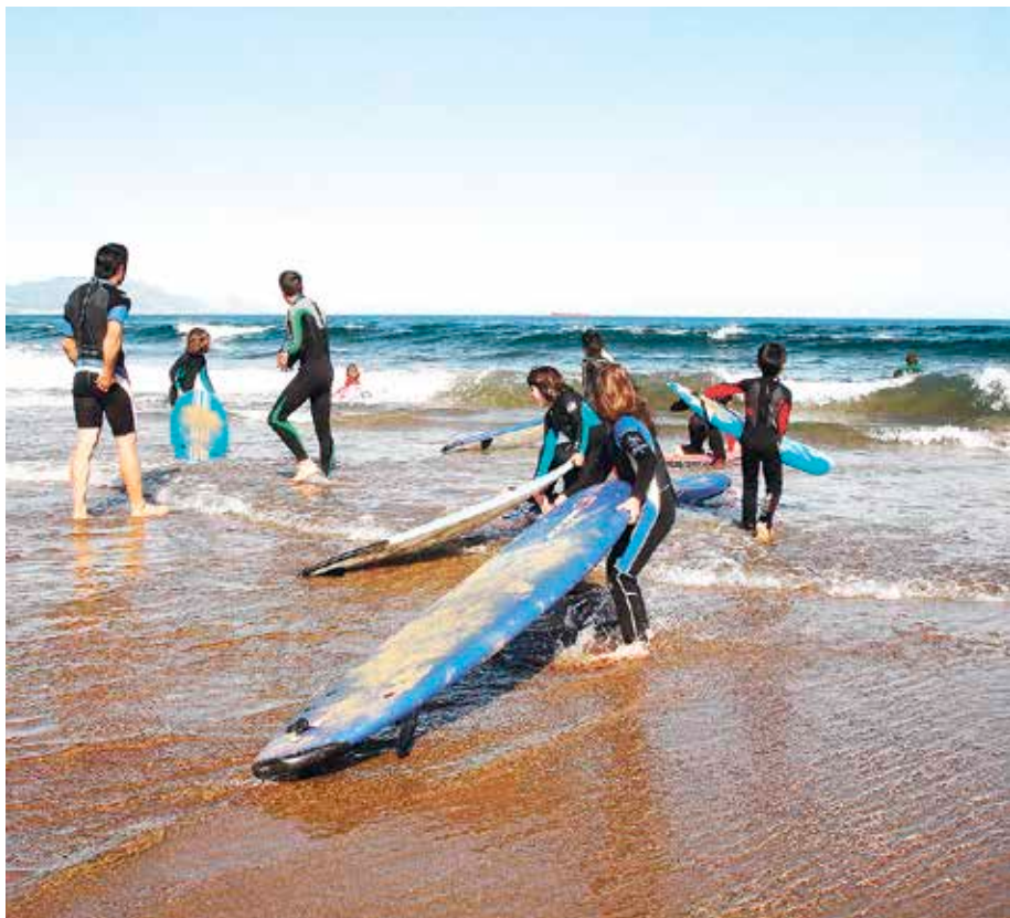
Surfa da udako campusetan eskainitako kiroletako bat.

G etxoko zenbait kirol-klubek, Getxo Kirolak udal erakundeagaz elkarlanean, 20 kirol-campus zabalduko dituzte udako hilabeteetarako; «orain arte eskainitako campus-kopuru handiena da», udal agintariak ohartarazi dutenez. Campusak honako modalitate hauetan eskainiko dituzte: gimnastika erritmiko, errugbi, esku-baloia, saskibaloia, igeriketa, tenis, futbol, atezainen prestaketa, irristaketa, skate, surf (banaka edo taldeka), bela, boleibol, xake, hockey, atletismo eta Jiu-jitsu, askotariko kirola eta defentsa pertsonala. Raspasen Arraun Eskolak ere udako ikastaroak eskainiko ditu arraunean ikasteko, 10 eta 16 urte bitarteko neska-mutilei zuzenduta. Ikastaroak uztailaren 18tik abuztuaren 27ra egingo dituzte Areetako ontzirekuan. Bi asteak izango dira, astelehenetik barikura, goizeko ordu-tegian, 11:00etatik 13:00etara. Prezioa 50 eurokoa da. ◀