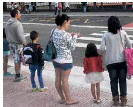
Eskolarako bideak oinez egiten dituzte.

Azken da dagoeneko Eskolara Oinez proiektua Berangon. Ikasturte osoan, egitasmoaren nondik norakoak zehaztu eta bide egokienak zeintzuk izan zitezkeen erabaki ostean, joan den hilaren 11n, astelehenean, hasi ziren egitasmo horregaz. Hala, Berango-Merana ikastetxeko neska-mutiek joan-etorriak taldeka egiten dituzte, oinez, haien etxeetatik eskolaraino. Proiektu horren helburua da parte-hartzaileentzako onuragarriak diren ibilbide «seguruak» sortzea. Era berean, ibilbidean zehar, ikasleek euren arteko harremanak areagotzen dituzte, eta jarduera fisikoa ere egiten dute. Halaber, ingurumenraren jasangarritasunerako eta ikasleen osasunerako onura han-