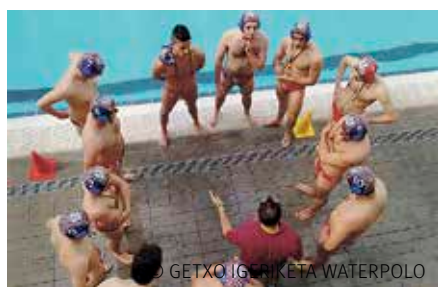
GETXO IGERIKETA WATERPOLO

G etxo Igeriketa Waterpoloren gizonzkoen talde seniorrak Euskal Herriko lehenengo mailara igotzea lortu du. Hala, datorren urtean euskal waterpoloko elite-kategoria jardungo du. Gainera, getxoztarrek ligaren jabe bihurtu dira. Balentria Euskal Herriko bigarren mailako 01-04 taldeko ligaren bigarren fasean lortu du, azken partidari. Getxoztarrek 6-8 irabazi zitoten Lautada UP Gasteiz taldeari, Mendizorrotzara egindako bisitan. Partida berdinduta egon zen lehenengo hiru laurdenetan, 2-2, 2-2 eta 1-1 zatikako emaitzak jasoz. Baina azkenengo zatian, Getxoko eskifaiak distantzia