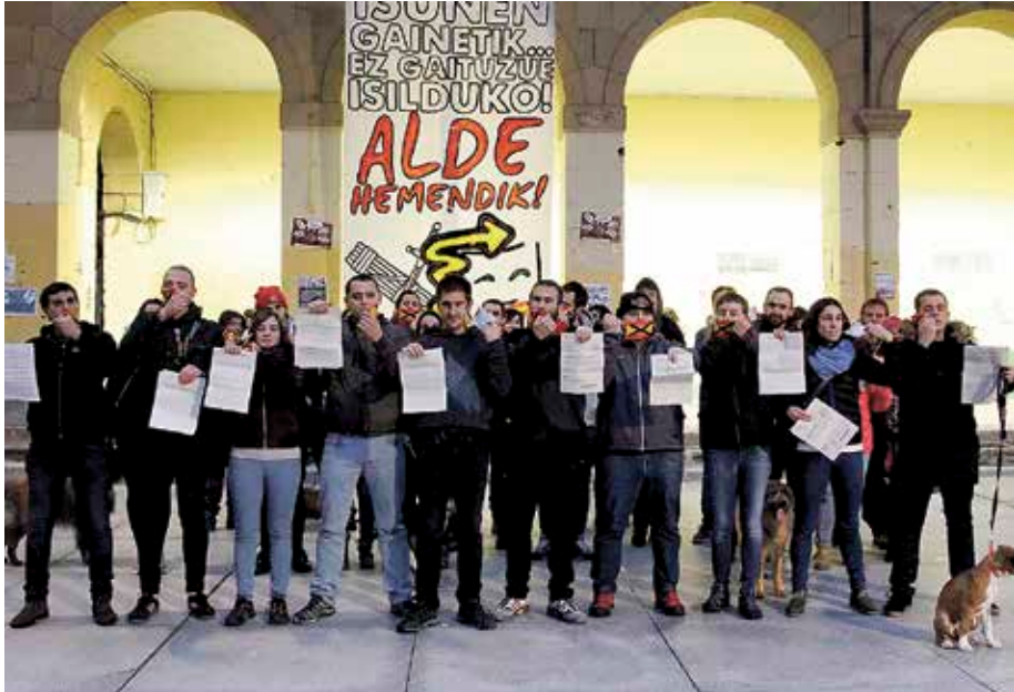
Adierazpen-askatasunaren aurkako erasotzat hartu dute zigorra.

Joan den urriaren 10ean Alde Hemendik Eguneko manifestazioan «segurtasun indarren kontrako errespetu falta» egin izana leporatu diete 16 gazteri.