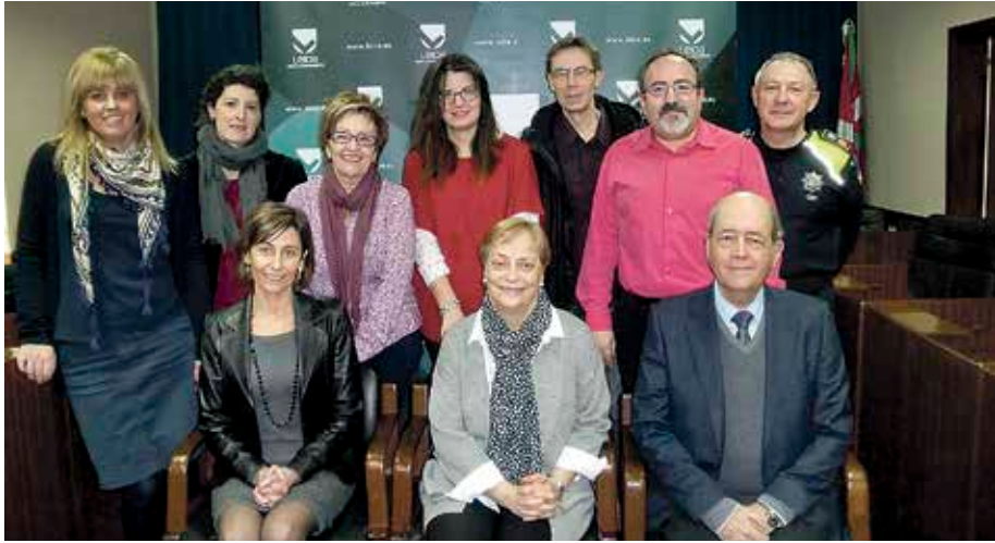
Udalbatzarraren aretoan izenpetu zuten koordinazio-protokoloa.

Ertzaintzagaz eta Osakidetzagaz bigarren protokoloa sinatu du Udalak, sexu-erasoen biktima izan diren emakumeenganako arreta hobetzeko.