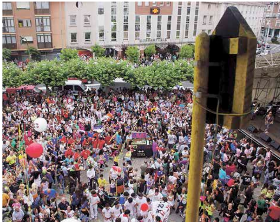
San Pedro jaietako antolakuntza-lanak aurrera doaz.

Sopelako Jai Batzordeak jakinarazi duenez, daborduko zabalik dago San Pedro jaietarako txosnak eta tabernetako kanpoko barrak jartzeko eskaera egiteko epea: maiatzaren 18ra arte. Hala, interesa dutenek udaletxean edo Sopelارين bulegoan eskura ditzakete bete beharreko eskaera-orriak. Kanpoko barra eskatzen dutenek aurkeztu beharko dituzte eskatzailearen NANaren fotokopia, barraren planoak (neurriakaz eta kokalekuagaz) eta 1.500 euroko fidantza ordaindu izanaren abonua-agiria. Azken horrek establezimenduaren izenean egon beharko du. Txosnetakoek, berriaz, txosnaren neurriak eta aseguru-poliza aurkeztu beharko dituzte. Horrez gainera, txosna zein egunetan ipiniko duten zehaztu beharko diete udal arduradunei; baita zein egunetan kenduko duten ere. ◀