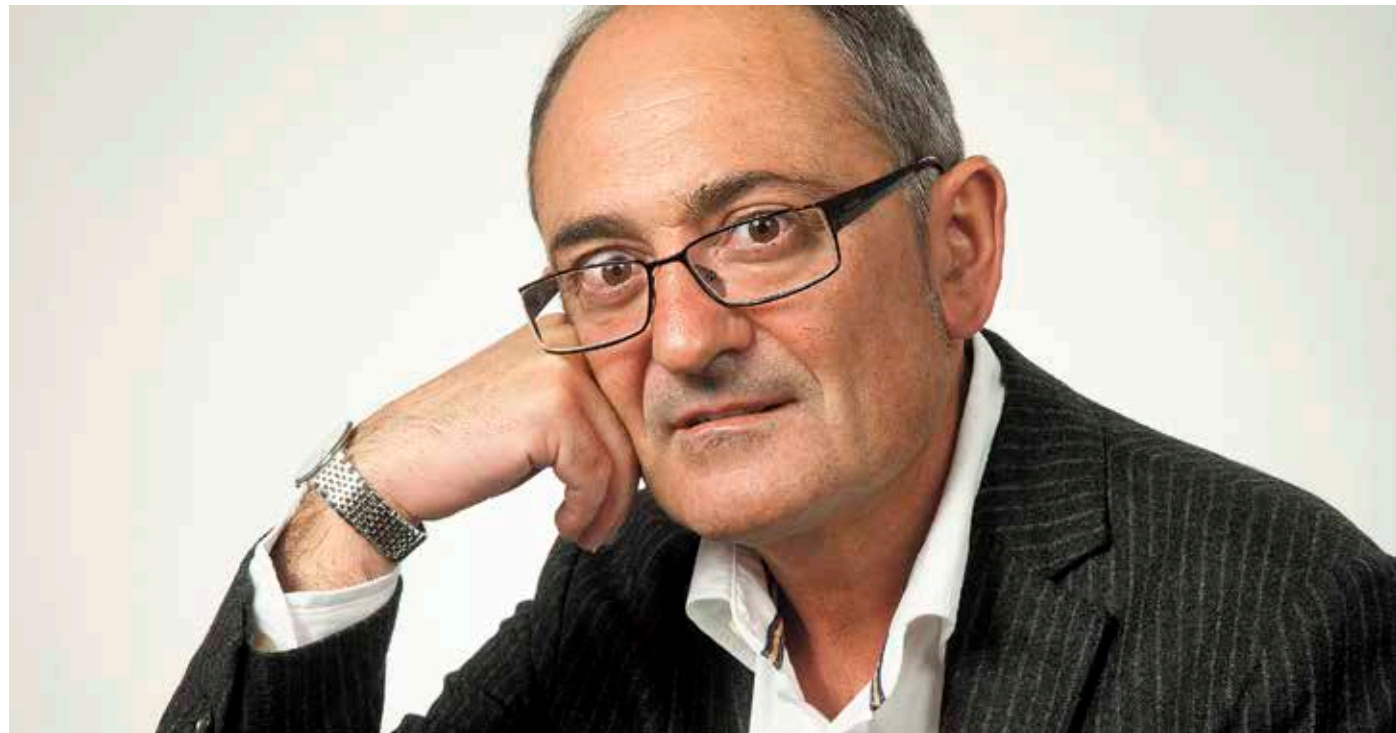
Euskara batuaren eta euskalkien gaineko argibideak aurki ditzakegu www.euskalkiak.eus webgunean. © KOLDO ZUAZO

Euskalkixek badauke indar afektibo eta emozional bat, eta hiztunak hori sentitzen ez badau, hizkuntzie bertan behera itxiko dau. Euskalkixe bizirik dagoen lekuetan nahitaezku da aintzakotzat hartzie eta babestie; bestela hiztuna deserrotu egingo da, eta bardin izengo jako euskeraz edo erderaz egin. Horixe gertatzen da askotan, eta, jakine, euskerie ataritzen da galtzaile.