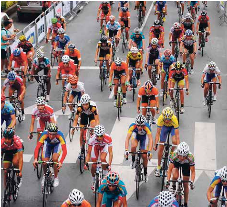
Elkar Kirolak txirrindularitza-eskolak 2012an antolatu zuen proba lehenengo aldiz.

A urten, uztailaren 22tik 24ra egingo da Txumaren Nazioarteko Hiru Egunak izeneko kadeteen txirrindularitza-probaren bosgarren edizioa. Ohi den legez, nazioarteko parte-hartzaileak ugariak izango dira. Berango, Erandio eta Leioako udalek sustatzen dute Elkar Kirolak txirrindulari-eskola, eta eskolak berak zabaldu duenez, aurten «lasterketak hainbat nobedade garrantzitsu izango du ibilbidean». Hala ere, oraindino ez dute zehaztu egin asmo dituzten aldaketa horiek.