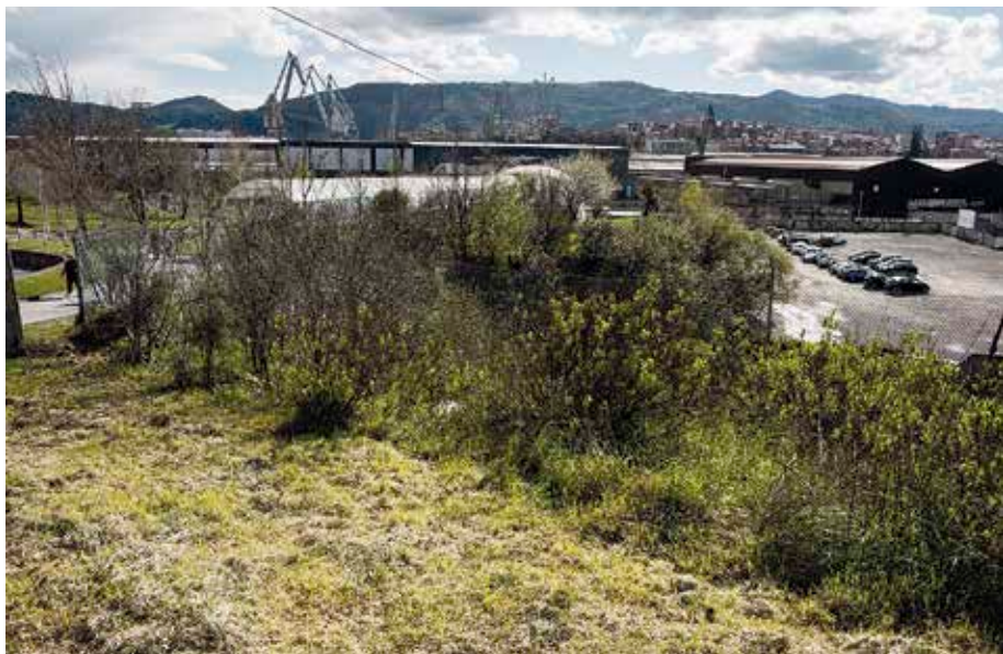
EAJ eta EH Bilduren proiektu nagusiak elkarren ondoan daude. Koalizioarena prest legoke 5 urte barru.

Astrabuduko parkingen lan-mahaia bigarren bez batzen astelehenean, hilabete luzearen ostean. EAJk eta EH Bilduk proposamenak egin dituzte.