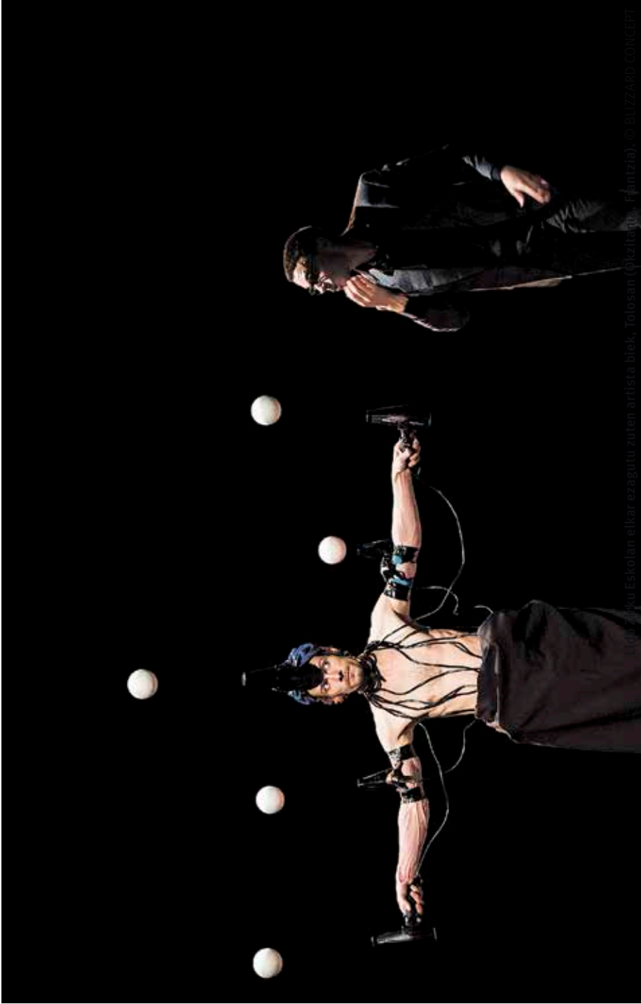
Elkarreagutuz zuten artista bik, Tolosan (bizkaitu), Euzkizia).

Domeka honetan, apirilak 17, Ipuinak dantzan izeneko ikuskizuna eskainiko du Apika taldeak, Berango Antzokian. Umeentzako emanaldia euskaraz izango da, 18:00etatik aurrera. Sarrerak euro batean egongo dira. ◀