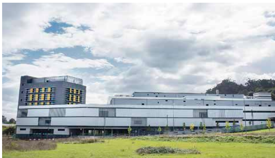
Ospitaleak eragingo dituen «aparkatzeko arazoak» herritarrek adostea eskatu du EH Bilduk.