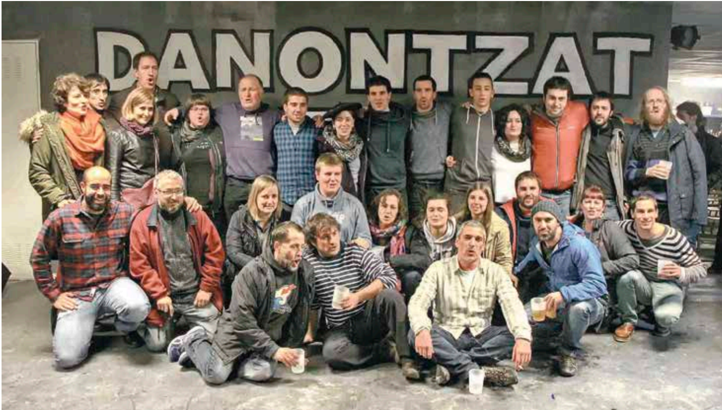
ALBEko bertsolariek Bizkaiko Bertsolari Txapelketari ekin behar izan diote eskualdeko txapelketaz ia indarberritu barik.