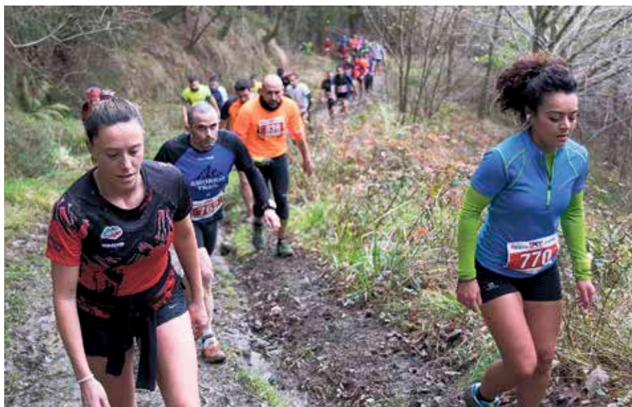
Antolatzaileek 5.000 euro banatuko dituzte saritan.

Sanfilippo Fundazioagaz batera egiten du behar. Stop Sanfilippo-k izen bereko sindromearen aurkako ikerketa bultzatzen du, osabidea edo tratamendua lortzeko helburuagaz. Horrez gainera, fundazioak gaixotasuna duten umeen eta haien familien bizi-kalitatea hobetzea gura du, gaixotasunaren ezagutza hedatzeagaz batera, diagnosi goiztiarrak egiteko. Bide horretan, Bizkaia Kosta Trailak domekan telefono zaharrak eroateko deia egin du, fundazioari emateko. Inskripzioa egin dutenek dortsala batu ahal izango dute goizeko 08:00etatik aurrera, Armintzako Portubide kalean. Handik ordubetera hasiko dira lehiaketako probak zein lehiaketatik kanpokoak. ◀