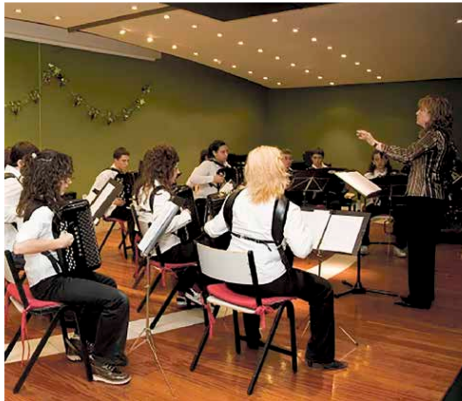
Sei urteko ikasleek, 1. maila amaitzean, instrumentua aukeratu behar dute.

Ziburuko Kaskarotenea Ikastola, aurrera! ◀