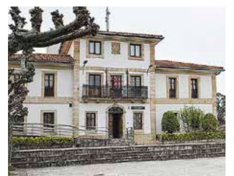
EAJk eta Ibarrikak alde bozkatu zuten.

Udalak 412.000 euroko soberakina du. EH Bilduren arabera, EAJ eta Ibarrikak ez dute diru hori inbertsioetarako erabili gura izan. Izan ere, koalizio abertzaleak jakinarazi duenez, gobernu-taldeak «denborak aurrera egin ahala» erabakiko du zeintzuk izango diren inbertsioak egiteko «lehentasunak». Gogoratu dutenez, 2015ean Zea-