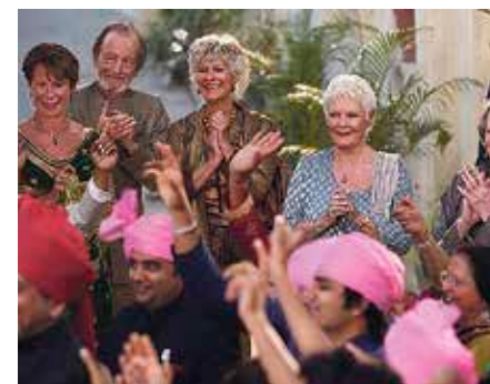
Filmaren pasarteetako bat.

Eguen honetan, apirilak 14, genero-ikuspegiko beste zinema-saio bat eskainiko du Itzartu emakumeen elkarteak. Oraingo honetan, John Madden britainiarrek zuzendutako El nuevo exotico hotel Marigold (2012) pelikula egongo da ikusgai Kurtzio kultur etxean, 18:00etatik aurrera; sarrera, doan. Emanaldia gaztelaniaz izango da. Deborah Moggach-en These Foolish Things (2004) eleberrian oinarrituta dago filmaren gidioa. Komedia dramatiko horretan, Indiarra egingo du bidaia hirugarren adineko britainiar talde batek, Marigold hotelaren publizitateak liluratuta. Hala ere, ez dute espero zutena aurkituko.