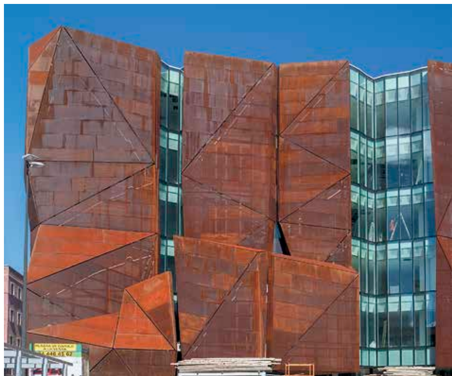
Eraikinak energia berriztagarrietan (geotermia) oinarritutako klimatizazio-sistema dauka.

konbinatuz honako hauek: azken arretaren teknikoak, kontsumo txikiko led-argiztapena, emisio txikiko eta isolamendu termikoko ahalmen handiko beirak, eta fatxadetan zulatutako altzaruzko xafla-sistema bat, barrua aireztatze eta eguzki-babes eraginkorra ere izango dena, eraikinari argi naturala izateko aukera kendu barik. Azaldu dutenez, eraginkortasunaren kontzeptua zabaldu egingo da zerbitzuen zenbait arlotara eta Kultur Etxeak kudeatzen dituen arloetara; horrela, erabilgarri dauden baliabideak arrazionalizatu ahal izango dira. Instalazioek eskainiko dituzten zerbitzuen arteko sinergiekin arrazionalizazioa eragingo dute, eta horrek eraginkortasun handiagoa ekarriko du baliabide ekonomiko, langile eta energetikoetan eta mantentze lanen eta espazioen kudeaketan, besteak beste, zenbait zerbitzu publiko eraikin bakar batean batuko baitira. ◀