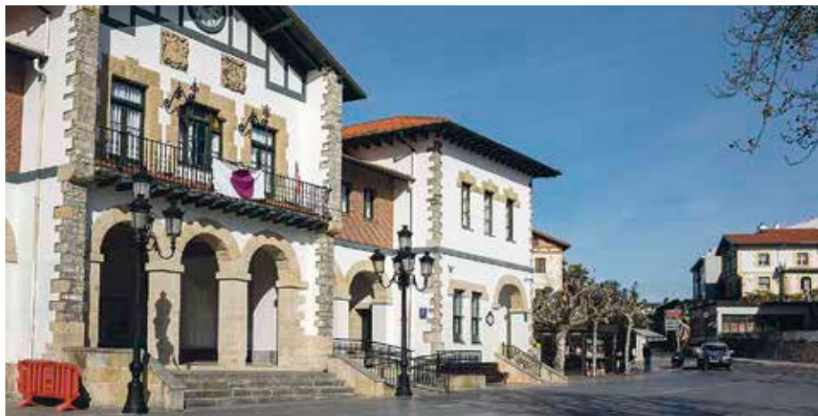
Irabazi asmo bako elkarteei eta eragileei utziko dizkiete lokalak.