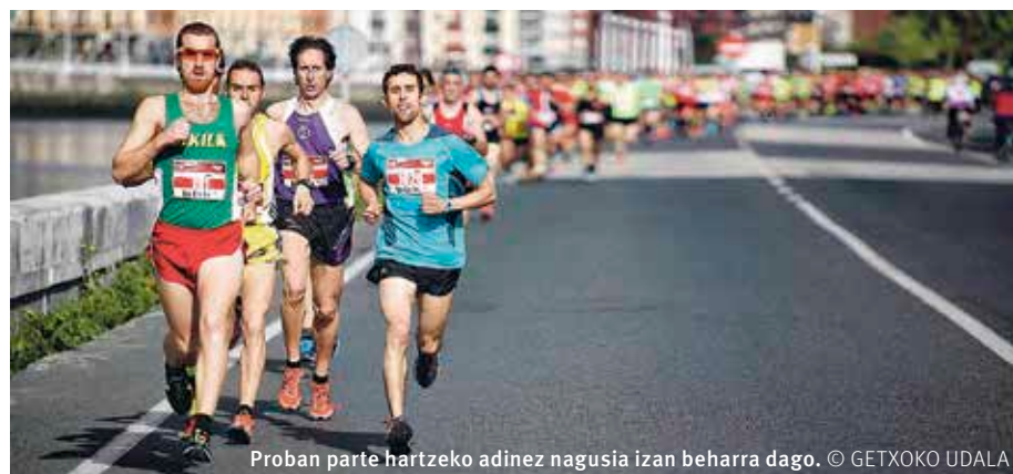
Proban parte hartzeko adinez nagusia izan beharra dago.

D omeka honetan, apirilaren 17an, Bizkaiko Zubiaren Maratoi Erdiaren hirugarren ekitaldia egingo dute, 10:00etatik aurrera. Herri-lasterketa izaera dauka probak, eta Getxo eta Portugalete udalerriak lotuko ditu. Lasterketa Bizkaiko Atletismo Federazioak antolatu du, Bilbo, Portugaleteko eta Getxoko udalen laguntzagaz. Korrikaldia Portugaleteko Canilla pasealekutik aterako da, udaletxearen ondotik. Itsasadarraren ezkerrekoa zeharkatuko du, eta Sestao eta Barakaldo atzean utzi ondoren, Bilbon sartu, eta Euskalduna zubiraino helduko da. Bertatik eskumalderara igaroko da, Erandio eta Leioatik