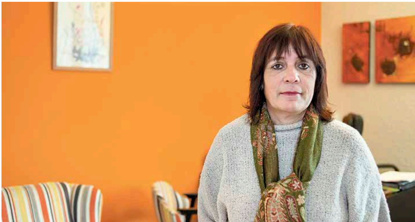
Besteak beste, Kultur Leioan eta Kurkudi herriko tabernan jaso daitezke estreinaldira joateko gonbidapenak.