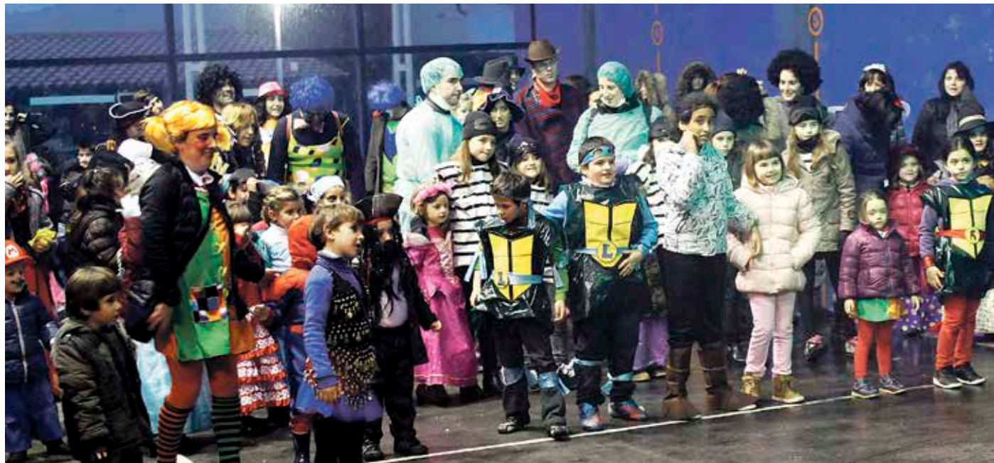
Eguraldia lagun izanez gero, frontoian ospatuko dituzte inauteriak, hilaren 13an.

Agate Deuna, inauteriak eta tostada-lehiaketa egingo dituzte hilaren 6an, 13an eta 15ean, hurrenez hurren.