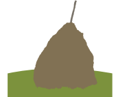
Meta (Irailak 17-Urriak 16)

Azken boladan ez bero eta ez hotz, epel zabilta denagaz. Ez larritu, garai hobeak une batetik bestera helduko dira.