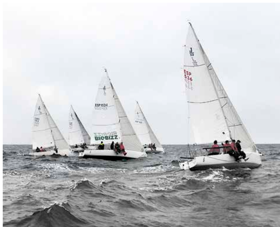
Biobizz -en nagusitasuna nabaria izan zen, baita bigarren estropadan ere.