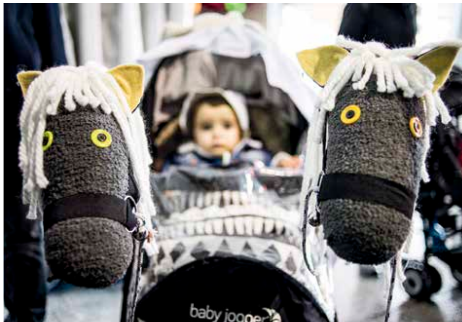
Sei egunetako inauteriak gozatzeko aukera izango dute getxoztarrek.