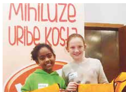
Pasa den barikuko sailkapen-gala.