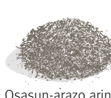
Hazia (Urriak 17-Azaroak 15)

Lantzean behin, kanturako ahots lirainak topatzen dituzte auzokideen artean. Lasai egon, ez da zure kasua izango. Gura baduzu, ahalegin du pianoagaz.