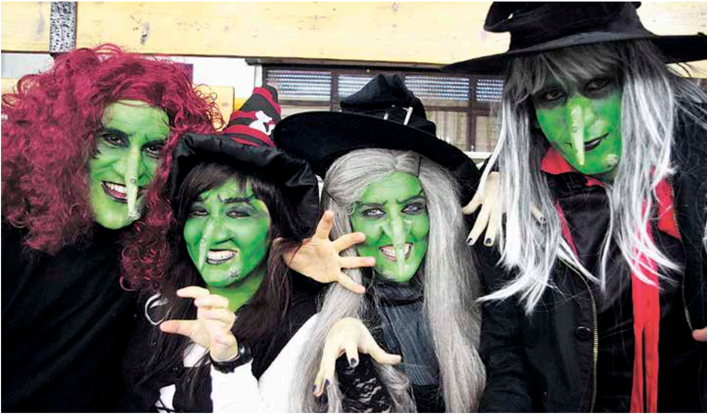
Urko kiroldegian egingo dute inauteri-festa handia domekan. SOPELAKO UDALA