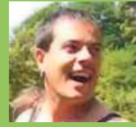
GAIZKO ALGORTA Aure kuadrillaren partez

Zorionak, uxufaaa! Gure txiletarra 30. urtemugara heldu zaigu, inoiz baino guapago, gainera! Musu bat, eta bi, eta hiru!