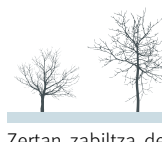
Negua (Azaroak 16-Abenduak 20)

Osasun-arazo arin eta ez kezkarriak izango dituzu laster, txerrikeria gehiegi jateari uzten ez badiotzu behintzat.