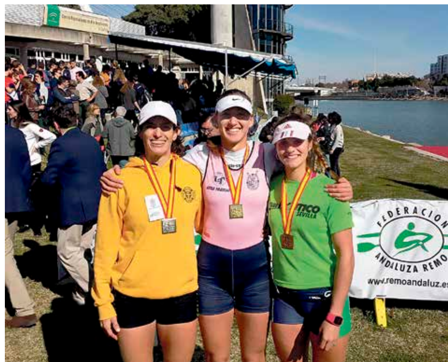
Domekako txapelketa eta podiumeko kirolariak.