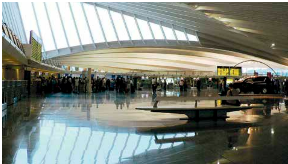
Ordutegia luzatzeak loaren nahasmendua eragin dezake auzokideengan.

Loiuko aireportuaren ordutegiak luzatzeari uko egitea eskatu diote Bizkaiko Batzar Nagusiek AENA enpresari, neurri hori «ingurumenen izango duen inpaktua» dela-eta. Vueling konpainiak egin zuen ordutegiak zabaltzearen eskaria, baina Batzar Nagusietako alderdi guztiak horren kontra agertu dira. EAJ eta PSE-EEk aurkeztutako iniziatibak EH Bilduren hainbat zuzenketan onartu ditu. Alderdi guztiek Loiuko aireportuaren garrantzia nabarmen-