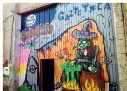
Bi gazte auzipetuta daude gaur egun.

Iragan urtarrilaren 28ko osoko bilkurara hurbildu ziren Kalezulo gazteetako hainbat kide, eraikin autogestionatuaren egoeraren berri ematera, eta, bereziki, aurreko egunetan Udalak adierazitakoari erantzuteko. Izan ere, Erandioko Gazte Asanbladak Udal Gobernuari leporatu zion urte hasieran herriko gazte biren aurkako auziaren eta gaztetxea ixteko saiakera baten atzean egotea. Ostera, Udalak gezurtatu egin zituen baieztapen horiek, HIRUKARI igorritako bost puntuko komunikatu labur batez. Horren harira, gaztetxeko kideek aitortu dute salaketa ez duela Udalak jarri, baizik eta «erakinaren ondasunak kudeatzen dituen gestorak», baina «Udalaren presio eta eskakizunen ondorioz» izan dela gaineratu dute. Udalak esan gaztetxearen kontra ez dagoela esan arren, eta gauzak «ondo» egitearen alde dagoela, gazteen ustez «administrazio horrek ez du interesik zein errespeturik izan, eta, ondorioz, gazteon proposamenek ez dute ganorazko erantzunik jaso inoiz».