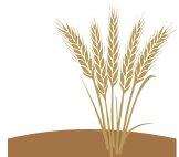
Garia (Ekainak 19-Uztailak 18)

Kalean behin eta berriro ahal dela entzun arren, ezin denean ezin da. Halere, zure in darra bide berriak zabaltzeko erabil dezakezu.