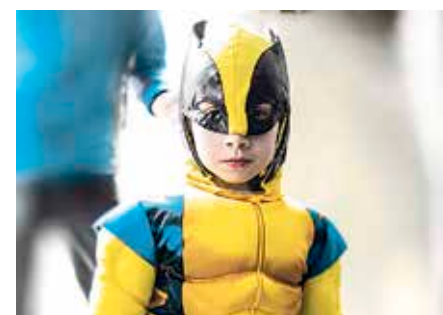
Mota askotariko mozerroak egongo dira.

Ohi baino lehenago helduko dira Aratusteak Erandioko auzo guztietara. Hala, Altzaga, Astrabudua eta Erandiogoikoko auzokideek urtebetez buruan bueltaka izan duten mozerroa janzteko aukera izango dute hila- ren 5etik 7ra. Erandioztarrek musikaz, dantzaz eta jolasez gozatzeko aukera izango dute herriko bazter guztietan. Berbarako, hilaren 5ean, El Puntillo Canalla taldeak Altzagako kaleak animatuko ditu 13:00etatik aurrera. Arrastian, berriz, umeen eta nagusien mozerro-lehiaketak egongo dira Altzagan, 17:00etan eta 19:30ean, hurrenez hurren. Zapatuan, mozerroen lehiaketak Astrabuduan izango dira, aurreko eguneko ordu berean. Horrez gainera, kaleko animazioa, txokolate-dastaketak eta talde-argazkiak egongo dira, besteak beste. Erandiogoikoara, azkenik, zapatuan helduko dira mozerroak. Umeentzako jardueraz gainera, dantza-erakustaldiak eta lehiaketak egongo dira, besteak beste. ◀