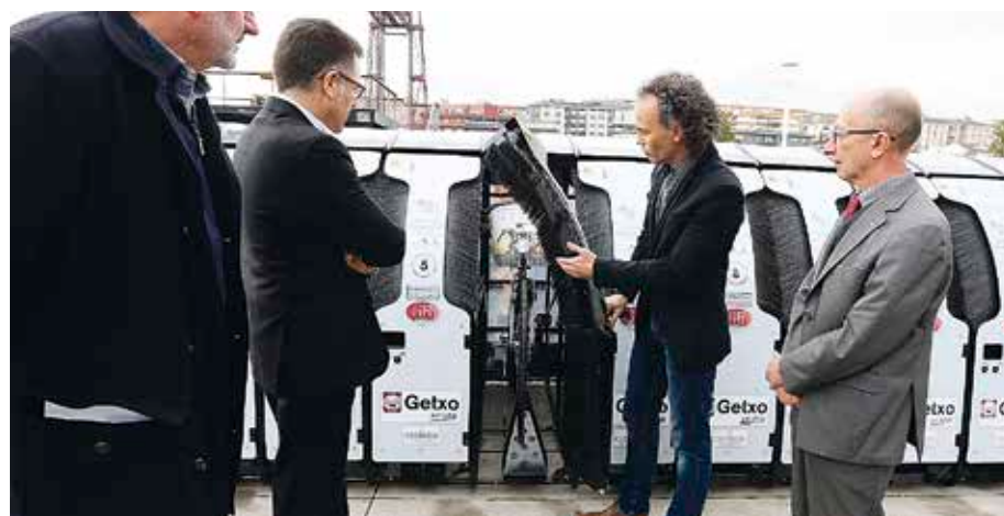
«Aparka» sistemadun geltokiak ezarri dituzte Getxoko 12 lekutan. GETXOKO UDALA

ko mozioek honakoak eskatzen zituzten: osoko bilkurak zuzenean eskaintzea; komun publikoen sarea ezartzea; argiztapen publikoan, jatorri berriztagarrikoa izatea energia; udal web-gunea egokitzea ikusteko urritasuna dutenentzat; EAEk eskuduntza izatea mendien gaineko araudi osoa ezartzeko; udalerriko antimilitarista eta bakezalea izatea; eta, errefuxiatuen beharretarako finantziarioa eskaintzea. ◀