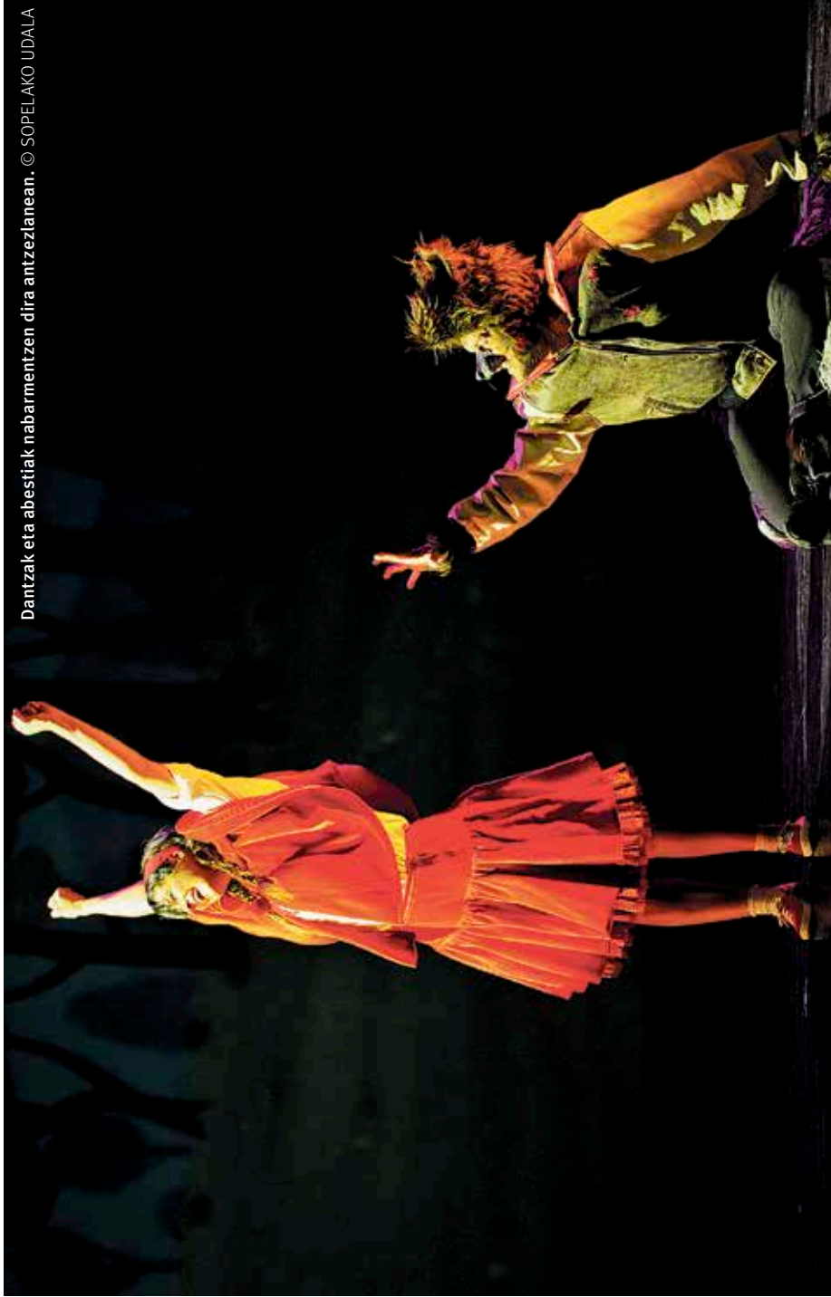
Dantzak eta abestiak nabarmentzen dira antzezlanean.

Enclave Getxo emakume-elkarteak antolatuta, astelehen honetan, otsailak 8, Clara Campoamor filma ikusteko aukera egongo da. Hitzordua 18:30ean jarri dute, Algortako kultur etxean; sarrera, doan. Solasaldia ere egongo da. ◀