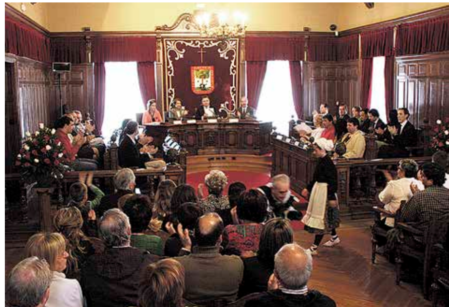
Denera, bederatzi mozio onartu ziren.

Horrez gainera, bederatzi mozio onartu ziren, guztira. Horietatik, hiru PPK proposatu zituen; beste bi, GUK-k, eta gainerako laurak, EH Bilduk. Popularrek eta EH Bilduk aurkeztutako proposamen banatan, gobernu-taldeak transakzio-emendakina aurkeztu zuen. Hala, Udal Gobernuak «testimonio-izaera» eman zien beste zazpi mozioei. PPGaz adostutakoaren arabera, Udalak honako ekimenak garatuko ditu: Gobelako lanen ondorioak gutxitzeko beharrezko neurriak hartzea; frontoi, atletismo, errugbi eta te-