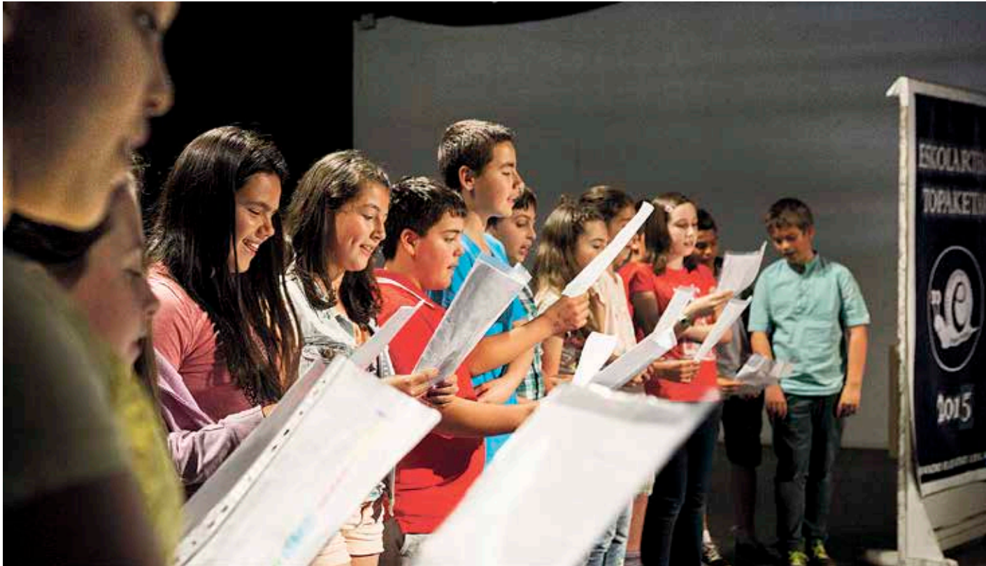
XV. Ipuin eta Narrazio Lehiaketa eta V. Bertsopaper Lehiaketa dira aurtengoak; argazkian, iazko irabazleetako batzuk. ERANDIOKO UDALA