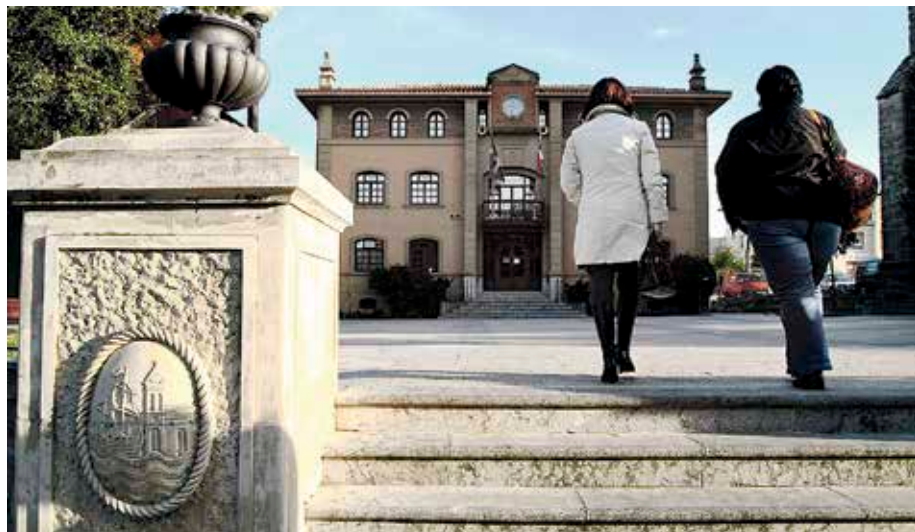
Gorlizko Ikastetxea hobetzera, 190.000 euro bideratuko dituzte.