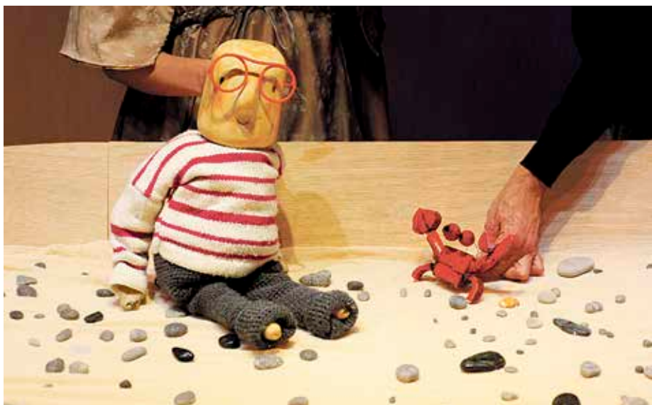
The shoe tree antzezlana ikusteko aukera egongo da martxoaren 13an.

Sendi-antzerkiak harrera ona izan zuen iaz Leioan: 2.300 ikusle baino gehiago. Hori ikusita, Kultur Leioak segida eman dio mota horretako antzerkia sustatzeari.