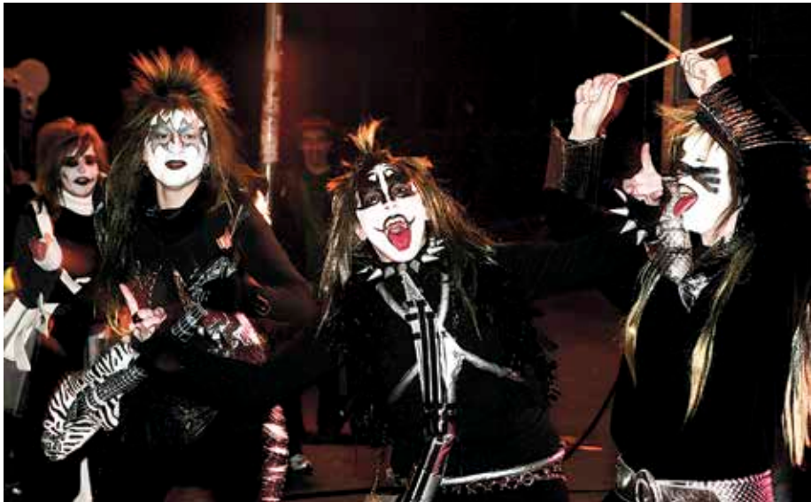
Mozorro-lehiaketa bi egongo dira: bata, helduentzat, eta bestea, umeentzat.

Udal erakundeagaz batera , MUGI Leioako Gazteak eta Maritxu Teilagorri elkarteak dabiltza ospakizunak antolatzen; ume zein helduentzako jarduerak egongo dira.