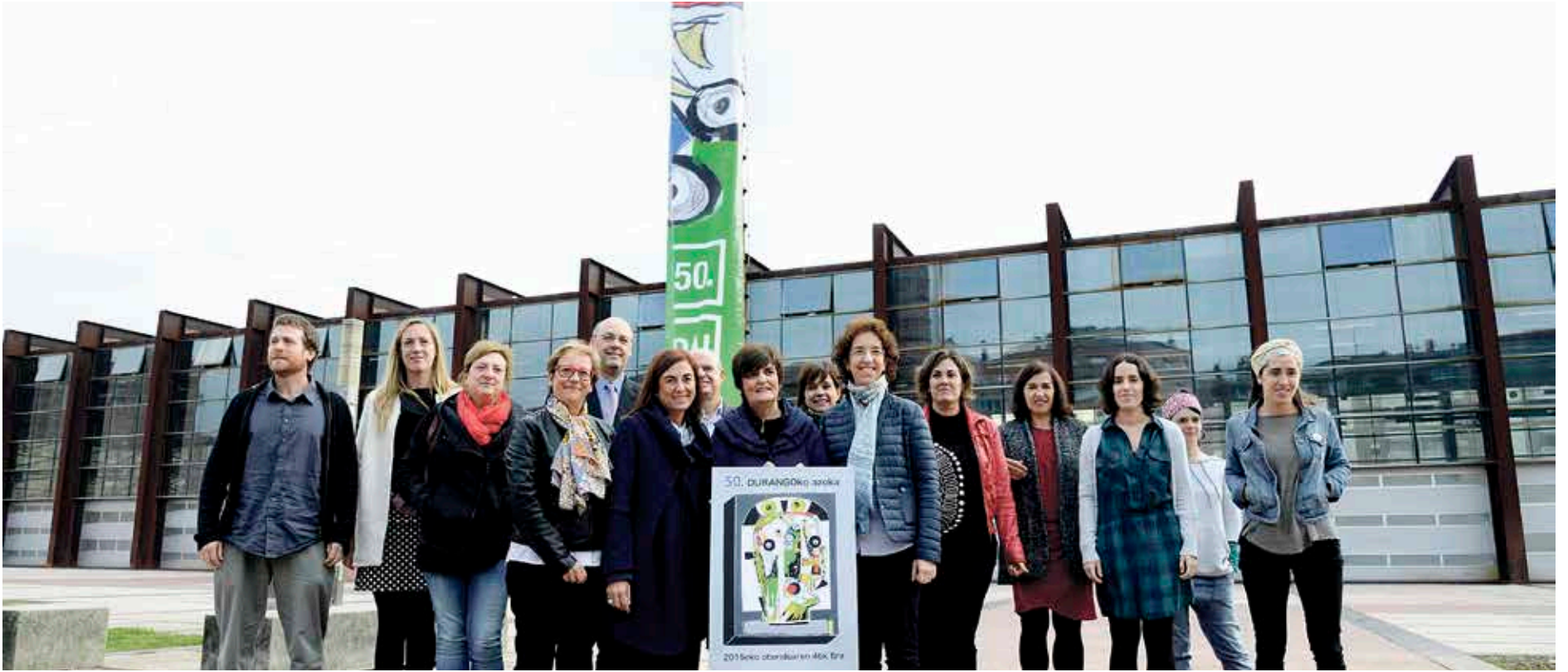
Aurten boluntariotza-programa bat abian ipini du Gerediaga elkarteak.