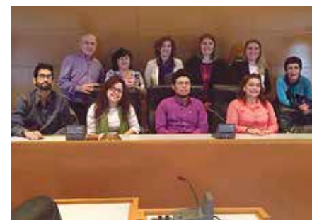
Politikariak eta kolonbiarrak.

Elkarrizketetan dabilzan aldeei, ostera, eskatu diete «memorian, egian, erreparazioan eta justizian oinarritu-