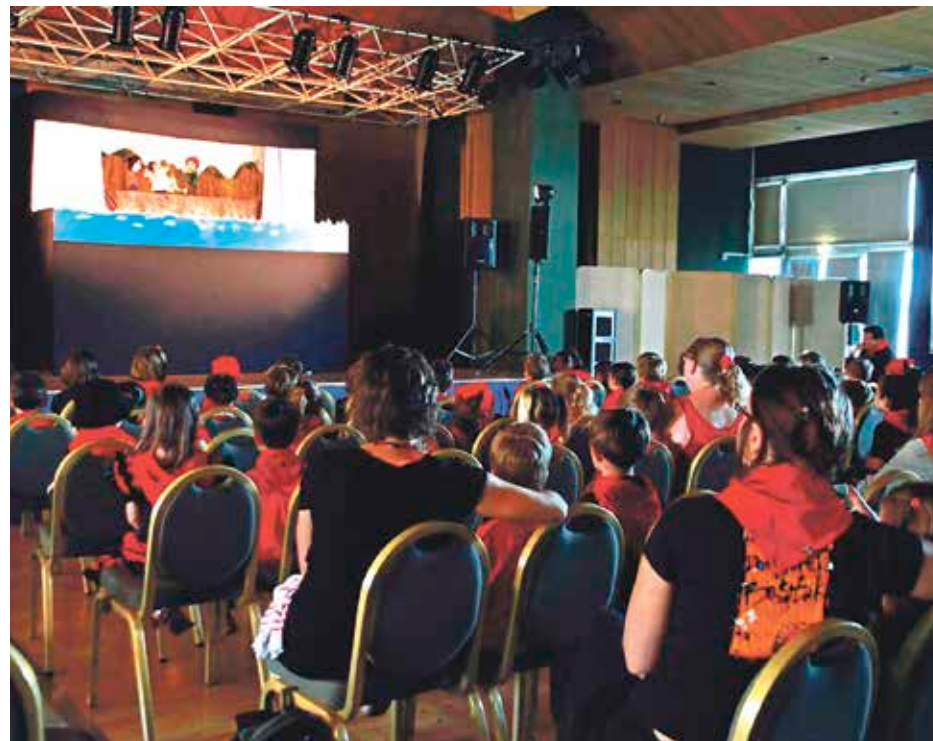
Domekan, txotxongilo-ikusizuna egongo da Berangon.

Egunotan, euskarazko ipuinak gozatzeko aukera edukiko dute eskualdeko neska-mutilek, hainbat herritan saioak antolatu dituzte-eta udaletako liburutegiek. Hala, bariku honetan, urriak 23, azken saioa eskainiko du Erandion Kontu Kantoï ipuin-kontalari taldeak. Hilabete osoan, emanaldi bana egin dute Alzagako liburutegian eta Astrabuduko Josu Murueta kultur etxean. Oraingo honetan, Erandiogoikoko liburutegian emango dute Nire bizikleta izenburuko saioa; sarrera doan izan-