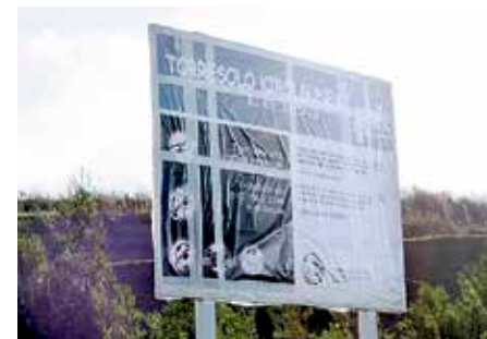
PPren salaketa artxibatu du fiskalak.