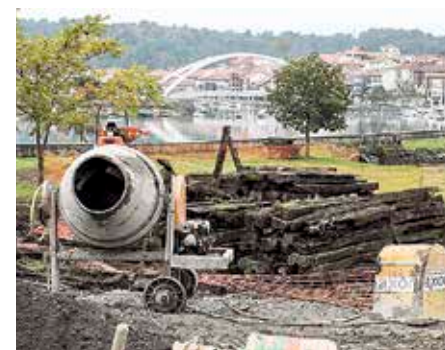
Pasa den astean hasi zituzten lanak.

Bertoko Talde Independenteak onartu zituen lan horiek aurreko legealdian. Talde Independentearen arabera, obrak Bizkaiko Kostalde Mugar-teak kudeatu zituen. ◀