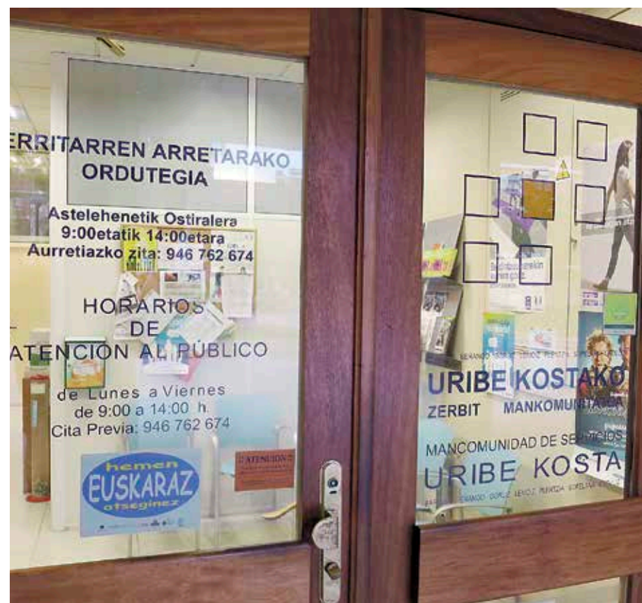
Mankomunitatutako udal ardurak kudeatzen ditu Mankomunitateak.

EH Bilduko ordezkariak Mankomunitatearen kudeaketa kritikatu dute, erakunde horren ordezkariak ez duelako «islatzen» mankomunitatutako udalerrien espektro politikoa. Era berean, salatu dute estatutuak «EAJren neurria egokituta» daudela. Udalerririk horietan, jeltzaleek 40 zinegotzi dituzte, baina 8 ordezkari hartzen dute parte Mankomunitatean, jakinarazi dutenez. PPK zinegotzi bakarra du udalerririk horietan,