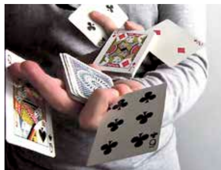
Magia saioa hilaren 22an izango da. SHANA

Astebete beranduago, ostera, familia osoari begirako filma proiektatuko dute Ander Deuna Kultur Aretoan, hilaren 30ean, barikua, hain zuzen ere. Oraindino zehazteko dago aurkeztuko