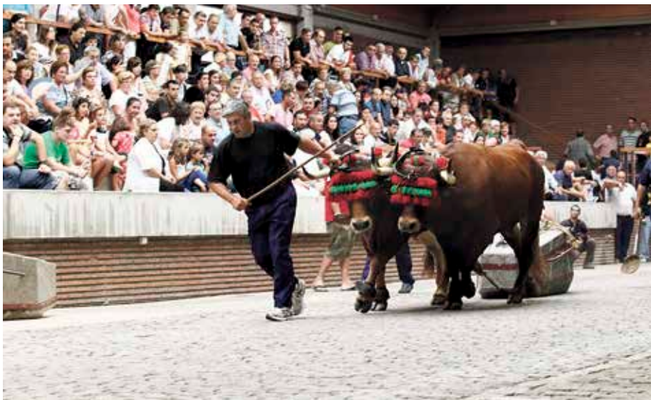
Besteak beste, Ondizen, zale ugari batzen dituzte idi-probek.