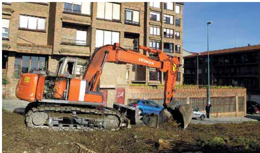
Sutearen zergatia eta zelan sortu zen ikertzen dabil Ertzaintza.

Hezetasuna Auzoko Bizilagunen Taldeak (HABT) zabaldu duenez, «argi dago» ekintza horren helburua Iturribarriko lanak gelditzea, «edo behintzat atzeratzea», izan dela. Taldeak ere helburu hori izan arren, argi utzi gura izan du taldeko kideak ez direla ekintza horren aldekoak; hala, horren inguruko «inolako erantzukizunik» ez