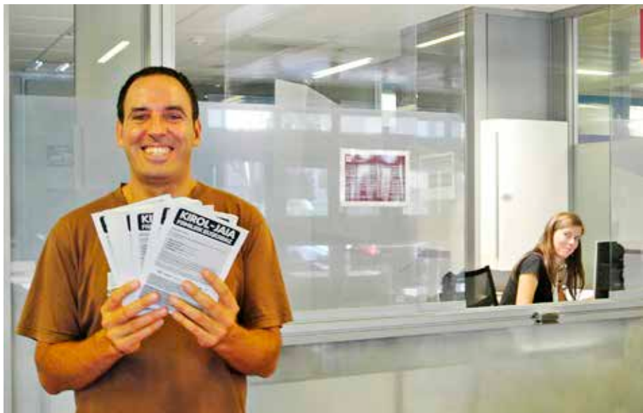
Fadurak hartuko ditu kirol-ekitaldi denak.

E gizu euskara elkartearen Sendi ekimenak kirol-jaialdia egingo du domekan Algortako Fadurak kiroldegiko frontoi eta igerilekuetan. Bertan, goizeko 11:00etatik 16:30era hainbat kirolez gozatzeko eskaintza prestatu dute. Kontuak horrela, hockeya, skate -a, boxeo, slackline -a, xake, arraun-surfa eta urpekaritza izango dira aukeran, txanda laburretan zazpi kirolak probatzeko. Jarduera denak doakoak dira.