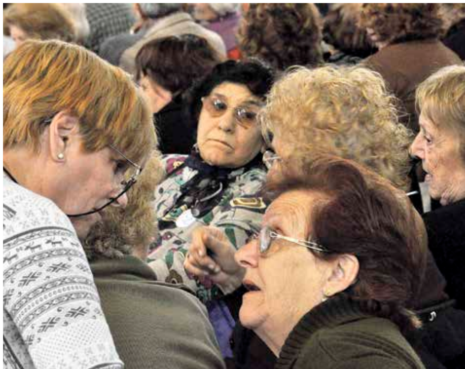
San Jose egoitzak 59 leku ditu.

Udalak 1,6 milioi eurogaz urtean esleituko du, San Jose egoitzako erabiltzaileentzako zerbitzua eta eguneko zentroa.