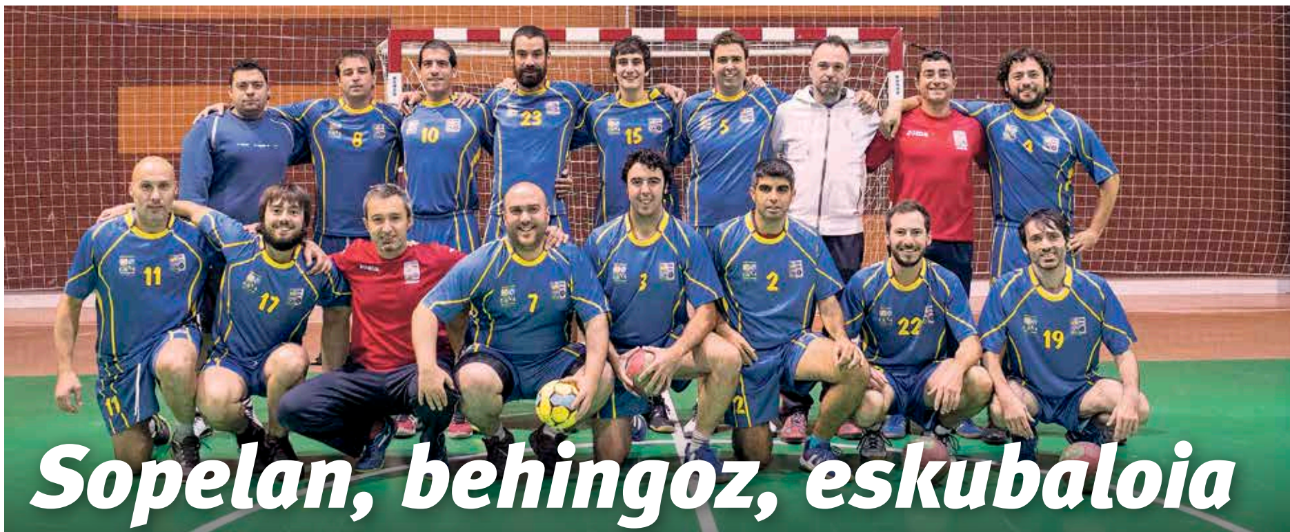
Denera, 18 lagunek osatzen dute Ugeraga Eskubaloia taldea.

Ugeraga Eskubaloia estreinatu zen pasa den irailaren 27an, Bizkaiko Bigarren Mailan. Lehenengo aldiz dauka Sopelak umeena ez den eskubaloia-taldea.