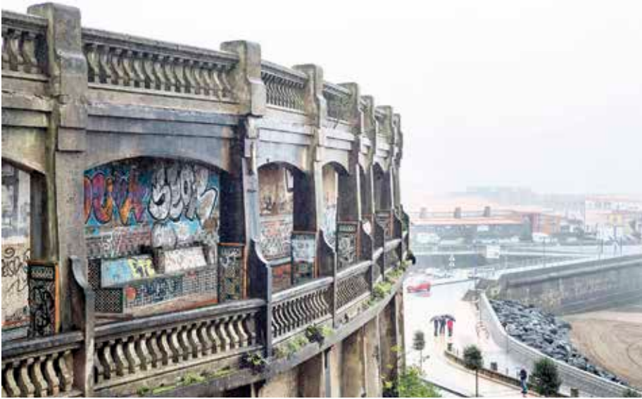
Galerietako ekitaldi-aretoan egingo dute ekimena.