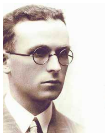
1937an hil zuten Lauaxeta.