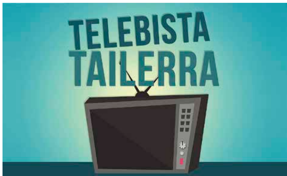
Plentzia Telebistak antolatu du tailerra.

tatu eta igarri ahal izateko. Azkenik, perretxikorik onena bildu duenari saria emango diote. Sariaren izendapen horregaz, amaiera emango diote Plentziako XVIII. Perretxiko Asteari. ◀