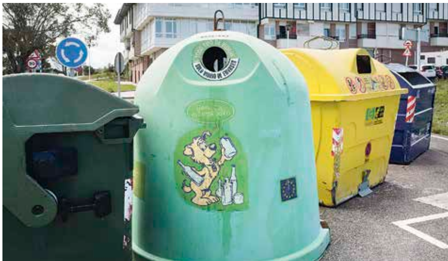
EH Bilduren arabera, sistema «jasangaitza eta onartezina» da.