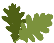
Hostoa (Apirilak 20-Maiatzak 19)

Oporrak dituzu gainean, eta oraindino ez duzu aukeratu nora joan. Kanpora joan, etxean gelditu? Aukeratu laster, oporrik gabe geldituko zara eta!