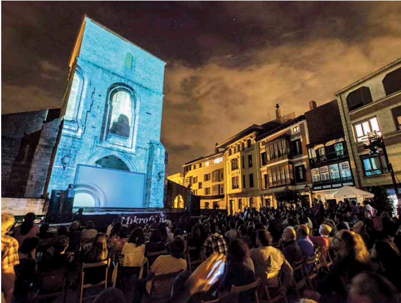
Elizaren fatxadan proiektatutako argi-ilunen ikuskizuna egongo da aurten ere Plentzian. © MIKROFILM SHORT FESTIVAL