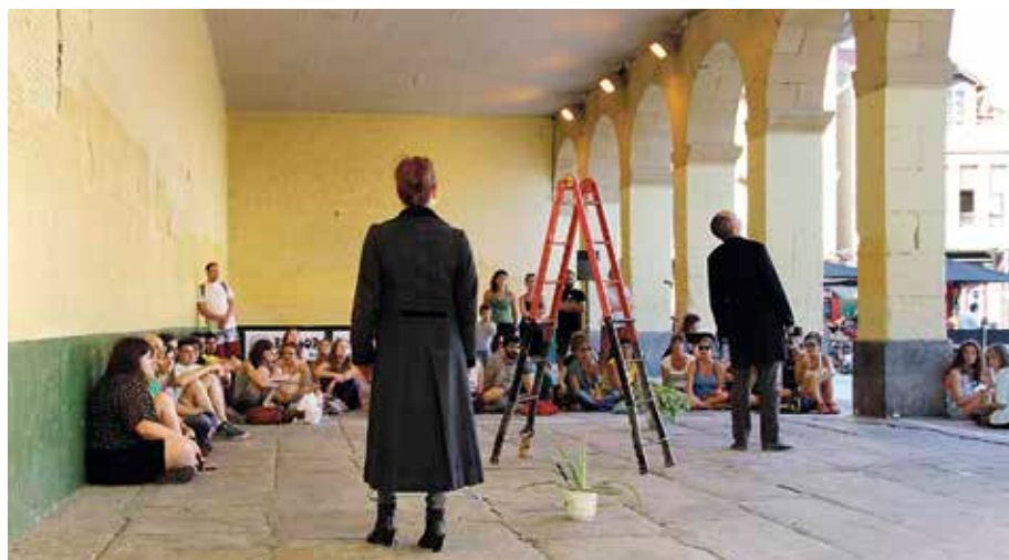
32 artistaren proiektuak ikusteko aukera egon zen egun osoan.

Garrobi arte eta kultur elkar-teak GART'15 jaialdia egin zuen, joan den ekainaren 27an, Algortako Bihotz Alai eta San Nikolas plazetan eta inguruetan. Bertan izan ziren hainbat diziplinako 32 artista, euren lanak aurkezteko. Hala, goizeko 11:00etatik gaueko 23:00etara, dantzak, antzerki-ikuski-zunek, era askotako tailerrek, kaleko muralek, erakusketek eta kontzertuek kaleak artez bete zituzten. Goizetik gauera arte, 1.832 lagunek bisitatu zuten Bihotz Alai plazan ipinitako karpa; San Nikolas plazatik ere beste horren-