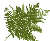
Iratzea (Abuztuak 18-Irailak 16)

Garagardea eta patxarana, beharrezkoa duzu alkohola edatea herriko jaietan ondo pasatzeko? Hala bada, kontuz ibili, eta ez zaitez pasa.