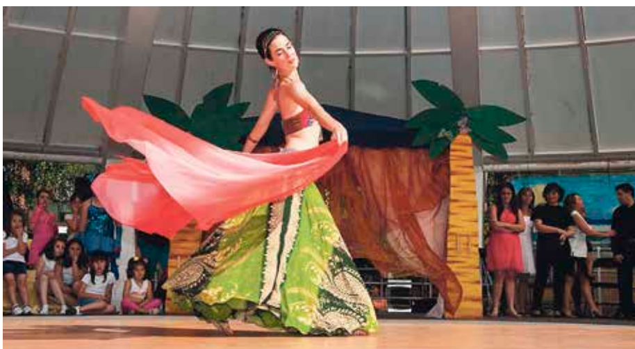
Dantza garaikidea, zumba, sevillanak eta tangoa ikasi ahal izango dituzte, besteak beste.