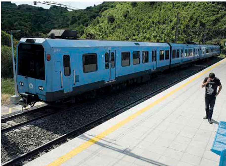
Lutxanako geltokia Txorierrira joateko erabil daiteke berriro ere, 19 urteren ostean.