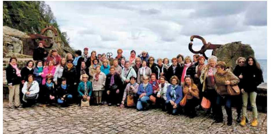
Emakumeen interesen araberako jarduerak egiten ditu Andrak elkarteak.

A ndrak Emakumeen Elkarte-agaz zeukan lankidetzahitzarmena berritu du Udalak. «Jarduera ugari egiten dituzenez, talde horrek dituen baliabideak aprobetxatu gura izan ditugu leioaztarren onerako», azaldu dute bertako agintariek. Hitzarmenaren helburua da eragile bien arteko kolaborazioa bermatzea. Emakume-taldeak kultura jarduerak eta emakumeen zeregina sustatzeko ekintzak antolatzen jarrai dezan, Udalak lehentasunezko erre-