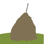
Meta (Irailak 17-Urriak 16)

Hondartza ala mendia? Betiko kontua. Oporraldia non igaro, aukeratu behar. Txanpon bat hartu, eta zorteak aukera dezala, busti ala lehorka?