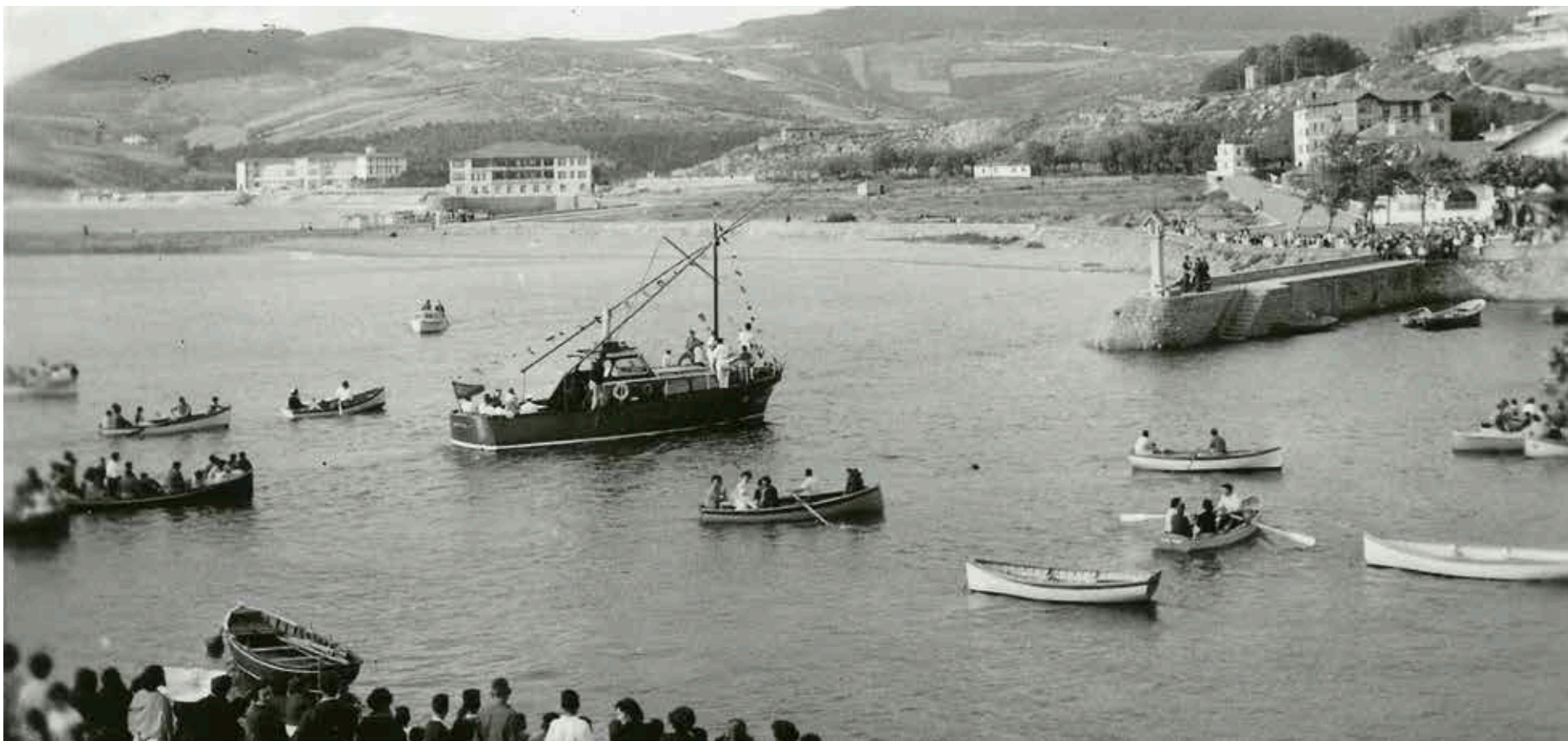
Plentziako eta inguruetakoko bizimodua zer-zelakoa zen erakutsiko dute uztailaren 7an eta 8an.

Plentzia eta Uribe Kosta -Butroeko Tokiko Historia jardunaldien zortzigarren edizioa egingo dute hilaren 7an eta 8an, Goñi Portalean. Besteak beste, Barrikako aterpea eta Zabalerrota ezagutu ahal izango dira.