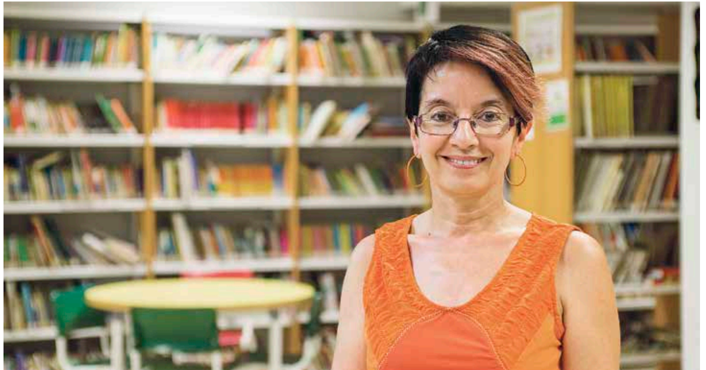
Zabalketa GKEarentzako 11.728 euro batu ziren Villamonte kultur etxean egindako Bigarren Eskuko Liburu Azokan.