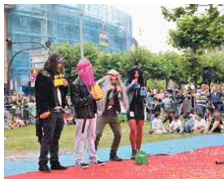
Akabukordun, kuadrillen erakustaldian.

Sanpedroetan, lau proba jokatzeko dituzte kuadrillek, egun bakoitzeko bat: jaitziera eta erakustaldia; ur-jolasak; bolak, eta tortilla eta sangria txapelketak, eta triviala. Horietako proba batzuek ere badaukate saririk: jaitzie-