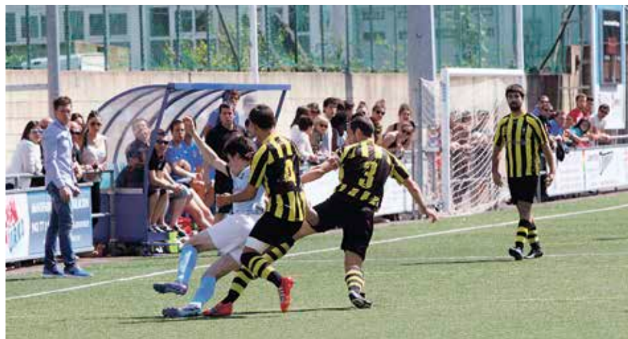
Getxok eta Arenasek erakustaldi ederra eman dute.