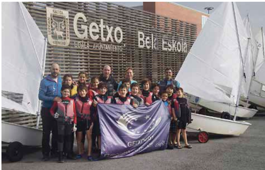
Irailaren 11n amaituko dira udako jarduerak.

P akea Bela Getxo Eskolak sortutako Optimist taldea lehiatzen hasi da inguruko estropadetan. Denboraldiaren hasieratik, 8 eta 15 urte bitarteko 18 neska-mutil trebatu dituzte: estropada egiteko teknikak garatu dituzte, oinarriko mailatik abiatuta. Entrenamenduen denboraldia hiru hiruhilekotan banatu dute urritik ekainera, eta ezarritako hainbat helburu erdietsiz aurrera egin dute ikasleek.