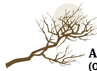
Adarra (Otsailak 19-Martxoak 20)

Herriko jaien gida aurkitu duzu, baina denborarik ez, denetara joateko. Ondo begiratu zer gura duzun, eta joan zaitez ondoen datorkizunera. Gozatu!