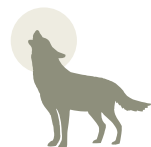
Otsoa (Urtarrilak 20-Otsailak 18)

Udako beroaren beroaz, sats eginda zaude; lasai, hondartzak dituzu inguruan, bizikleta hartu eta baina zaitez, ondoen duzun hareatzako uretan.