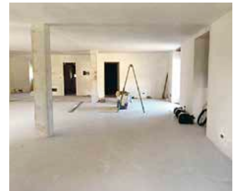
Sopelako baserri bat berriztatu behar dute.

M ara-Mara proiektua Berangotik Sopelara hedatuko da irailean. Sopelan Mara Mara Txiki egitasmoa aurrera eramateko, «leku ezin hobea» aurkitu dute: naturaz inguratuta. Zelai-eremu handiko baserria lortu dute, «non haizearen eta txorien kantua entzuten den soilik», arduradunek deskribatu dutenez. Proiektua zabaltzea «oso garrantzitsua» dela diote, bertan Mara Marako proiektu guztiak aurrera eroran ahal izateko. Baserri hori berriztatzeko, Mara Marakoek martxan ipini dute finantziario kolektiboaren kanpaina. Horregaz, «bakoitzaren nahien edo ahalbideen arabera ekarpenak» egin ahal izango dituzte, 10 eurotik hasita 500 euroraino. Lortu gura duten gutxienezko 4.900 euro dira; hala ere, 8.200 euro lortuz gero, egoera «hobezina» litzatekeela diote.