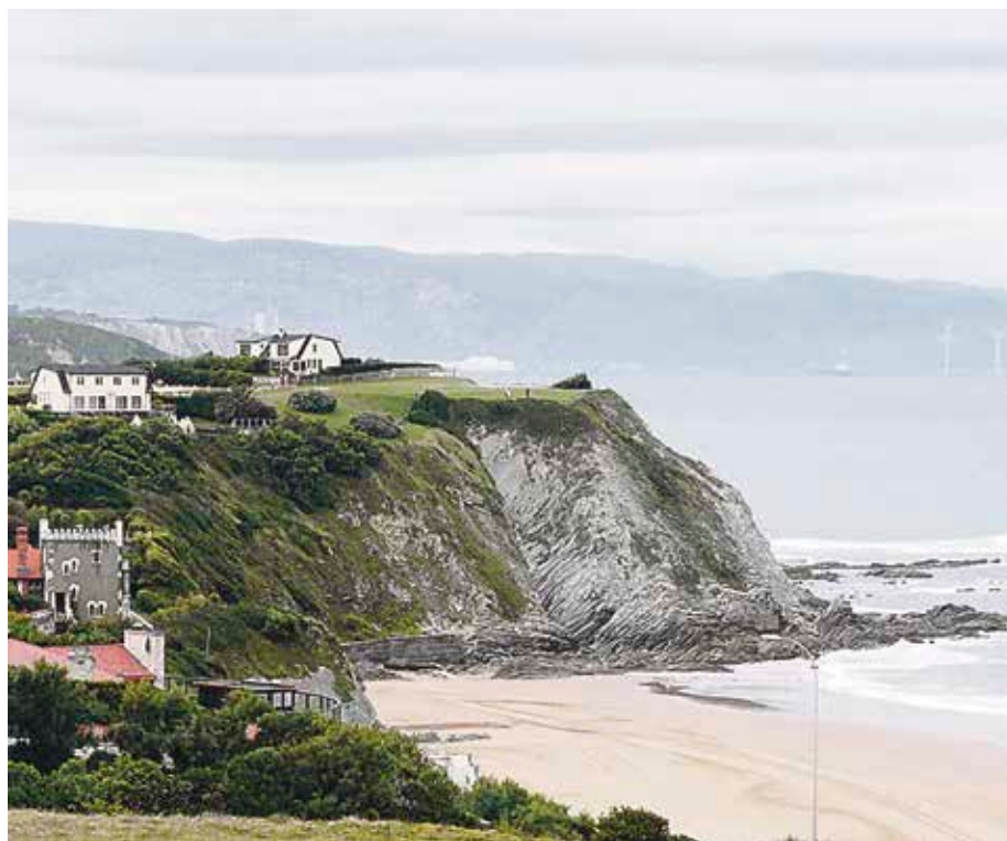
Bisitetan parte hartzeko 3 euro ordaindu beharra dago.