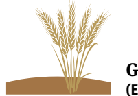
Garia (Ekainak 19-Uztailak 18)