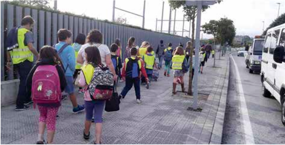
Guztira 105 umek parte hartu dute Eskolarako Bidean.