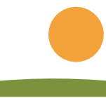
Eguzkia (Maiatzak 20-Ekainak 18)

Urtebete itxaroten egon ostean, heldu zaizkizu oporrak. Denbora horretan bidaiarik bilatu ez, eta, hegaldi barik gelditu zara daborduko.