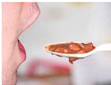
Indabak tradiziozko moduan egin beharra dago.

G orlizko Merkatari Elkarteak (GOSKOA) indaba-txapelketa antolatu du martxoaren 28rako, zapa-tuagaz. Aurtengoa bosgarren ekitaldia izango da, eta hitzordua goizeko 09:00etan jarri dute, Iberrebarri plazan. Horretan parte hartzeko, alde aurretik izena eman eta 10 euro ordaindu beharra dago. Hala ere, doako izen-ematea lor daiteke indabak egiteko osagaiak GOSKOako dendetan erosiz gero. Parte-hartzaileek tresna denak eroan beharko dituzte etxetik: su txikiak, lapikoak, mahaiak, lanabesak... Indabak tradiziozko moduan egin beharko dituzte eta lapikoak