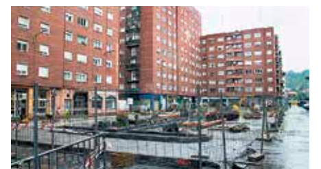
Autoz beteta egon ohi da plaza.

O inezkoari protagonismoa emateko asmoz, Altzagako Benjamin Anaia plazan abiatutako lanak ekainean amaitzea espero dute udal arduradunek. 279.000 euroko aurrekontuagaz, proiektuak ekimen nagusi bi ditu: oinezkoentzako leku gehiago izatea eta inguruan zuhaitz gehiago jartzea. Horretarako, orain arte aparkatzeko zauden 71 lekuetatik 39 kenduko dituzte, eta plaza inguratzen duen errepidea errail bakarrera mugatuko dute, espaloiak zabaldu eta altxatzean. Zuhaitzak izango dituen espaloiak zazpi metroko zabalera izango du, eta bes-