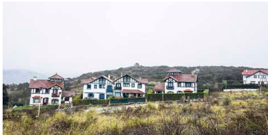
Udalak Muriola aldeko ingurumena hobetzeko plana osatuko du.

rajeak eta txokoak izan ahalko dituzte, arazo barik. Hala ere, etxeei bestelako erabileraren bat eman gura izanez gero, bulegotzat bakarrik onartu ahal izango da. Halaber, erreformak eta eraikinen hobekuntzak onartu arren, ezin izango dira partzelazioak egin, etxeak handitu edota etxeak aldatu; hala ere, etxea horizontalki banatu ahal izango da, baina ez zati bitan baino gehiagotan. Udalerriko urbani-