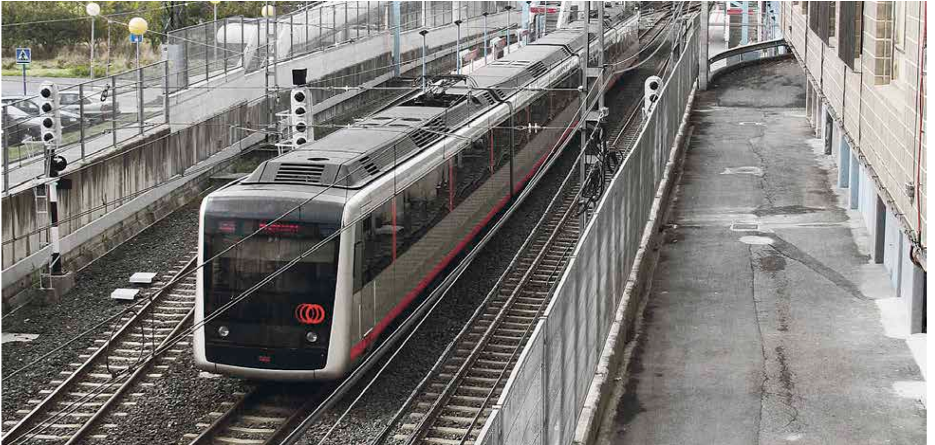
Urdulizko trenbide-pasagunea lurperatzeko lanen ondorioz, apirilaren 2an Plentziako metro-geltokia itxiko dute.

Metro Bilbaoko azken trenbide-pasagunea lurperatzeko lanak egingo dituzte Urdulizen. Horren ondorioz, Plentzia eta Sopela arteko metro-zerbitzua etengo dute. Horren ordez, autobus-zerbitzua eskainiko dute, 18 hilabetez.