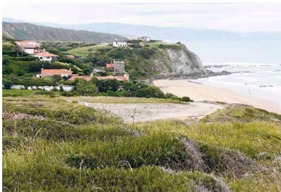
Proiektua Atxabiribil hondartzako goiko aldean gauzatuko da. SOPELAKO UDALA

Ingesta modu ekologikoan berreskuratzeaz gainera, Udalak inguru horren erabilera publikoa ere antolatu gura du. Gaur egun, bertatik GR-123 ibilbidea pasatzen da, baina ibiltari,