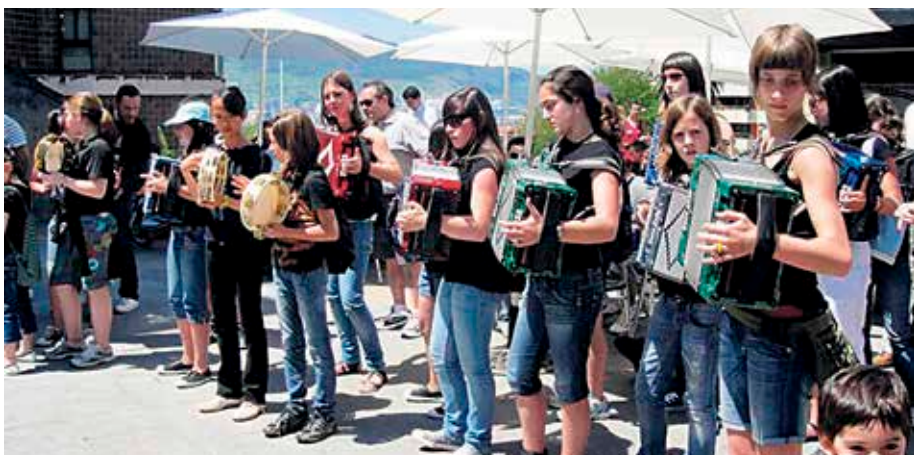
Bizkaiko Trikitixa Eguna Algortan, 2010ean. BIZKAIKO TRIKITIXA ELKARTEA

gutxienez, bi pertsonaz osatutako taldeetan. Bideoak bidaltzeko epea maiatzaren 26an itxiko dute eta formatu denak onartuko dituzte: argazki-muntaketa, bideo-komikia, dokumentala, ikus-entzunezko poesia eta abar. Edozein gailugaz grabatuta egon daiteke, gainera. Aurkezten diren lanek lau minutuko iraupena izan dezakete gehie-