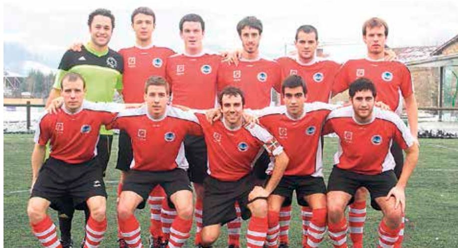
Pozik egoteko moduko egoeran daude Galeakoak.