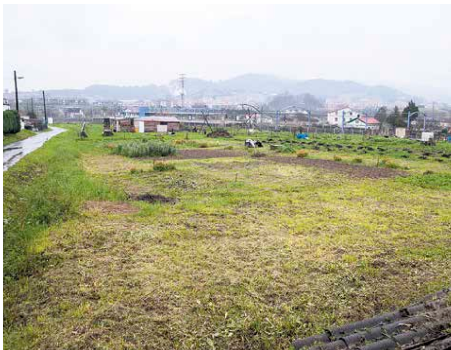
Tosu landan egin nahi dute Ibarbengoa aparkalekua.

Aurten abiatuko dituzte Andra Mari auzoan dagoen Ibarbengoa metro-geltoki ondoko aparkalekua egiteko obrak. Hori dela eta, eztabaidak hasi dira berriro ere.