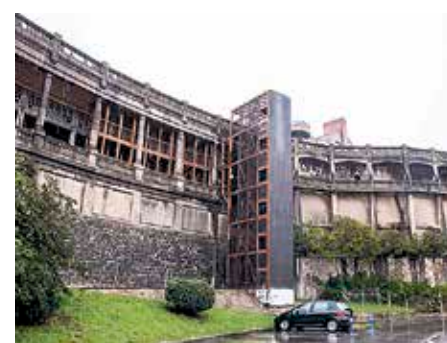
Bisitak goizez zein arrastiz egingo dituzte.

A pirilaren 2an Begoña galeriak ezagutzeko bisita gidatuak abiatuko dituzte. Eraikin historiko hori Punta Begoña izenagaz ezaguna da. Bertan lehengoratzeko egiten dabilzan lanak ezagutzeko aukera izango dute bisitariak. Guztira, 66 bisita programatu dituzte apiril osoan, goiz eta arrastiz, 12:00etan eta 18:30ean astegunetan, eta 11:00etan, 12:00etan, 17:30ean eta 18:30ean aste akabuetan. Bisitak herritar guztiei zuzenduta daude, baina alde zuzenetik eman beharko da izena. Kanpoaldean galeriak bisitatzeko egokitutako dorretik sartu eta bisitaria eraikineko barrualdean ibili ahal izango da. Gidari espezializatuek bisitak zuzenduko dituzte. Argibide-pane-