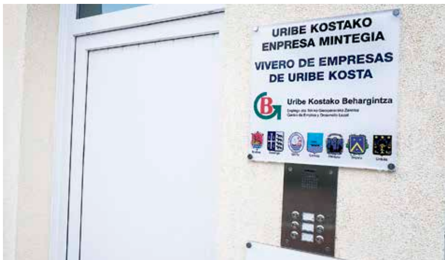
Enpresen haztegia Errementariena kalean dago.

Behargintzako enpresen haztegiak hiru ekintzaile hartzen ditu daborduko. Iazko ekainean zabaldu zuten, eta hurrengo hilabeteetan guztiz betetzea espero dute.