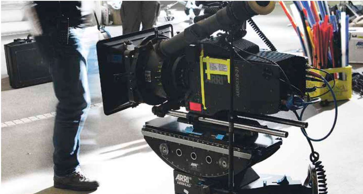
Lanak bidaltzeko epea maiatzaren 26an amaituko da. SCHLAIER