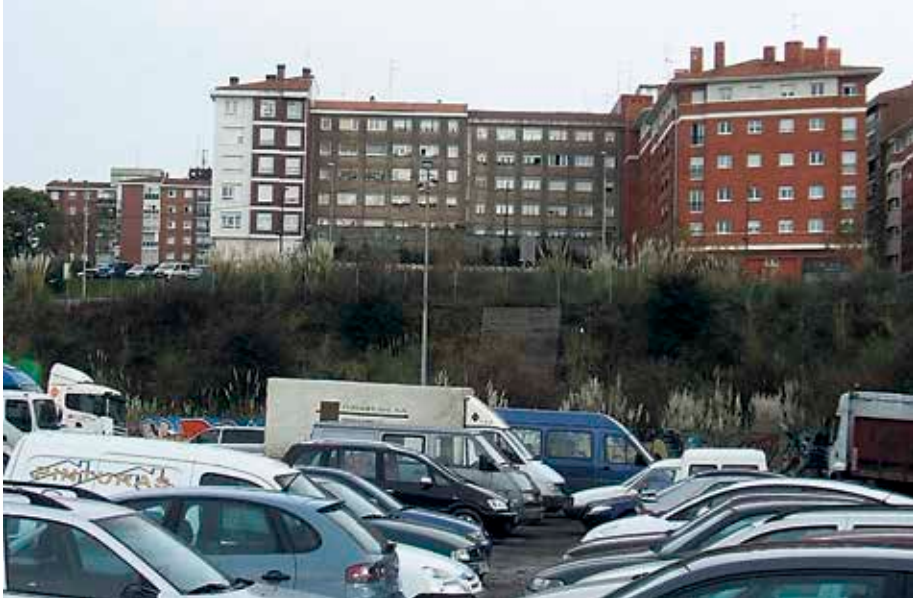
Astrabuduan 5.100 ibilgailu baino gehiago daude errolatuta.

Astrabuduko metro-geltokiaren ondoan 300 auto gehiago utzi ahal izateko lanak abiatuko dituzte apirilean. Amaitu bitartean, ibilgailuak non laga pentsatu du Udalak.