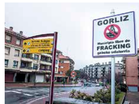
2013an fracking-aren kontra agertu zen Udala.

Sopelako Udalak bide berdina hartu zuen 2014ko abenduan, eta horren berri emateko bi panel ezarri zituen herriko sarreretan. Hala ere, Bizkaiko