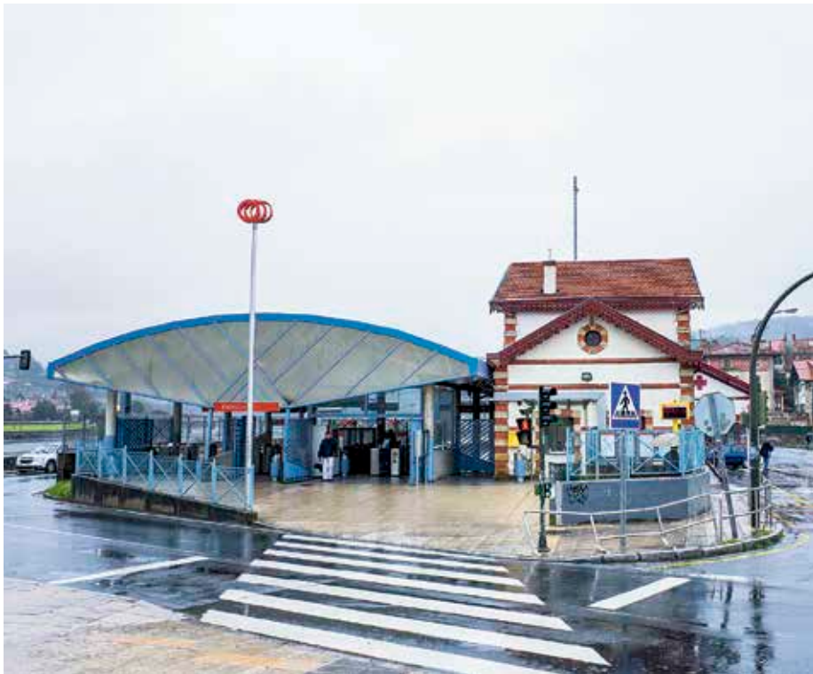
Auto batek institutuko ikasle bat harrapatu zuen urtarrilean, inguru horretan.

Geltokiaren inguruan segurtasuna areagotzea eta eskola-garraioak ohiko zerbitzua berreskuratzea exijitu du IGEk.