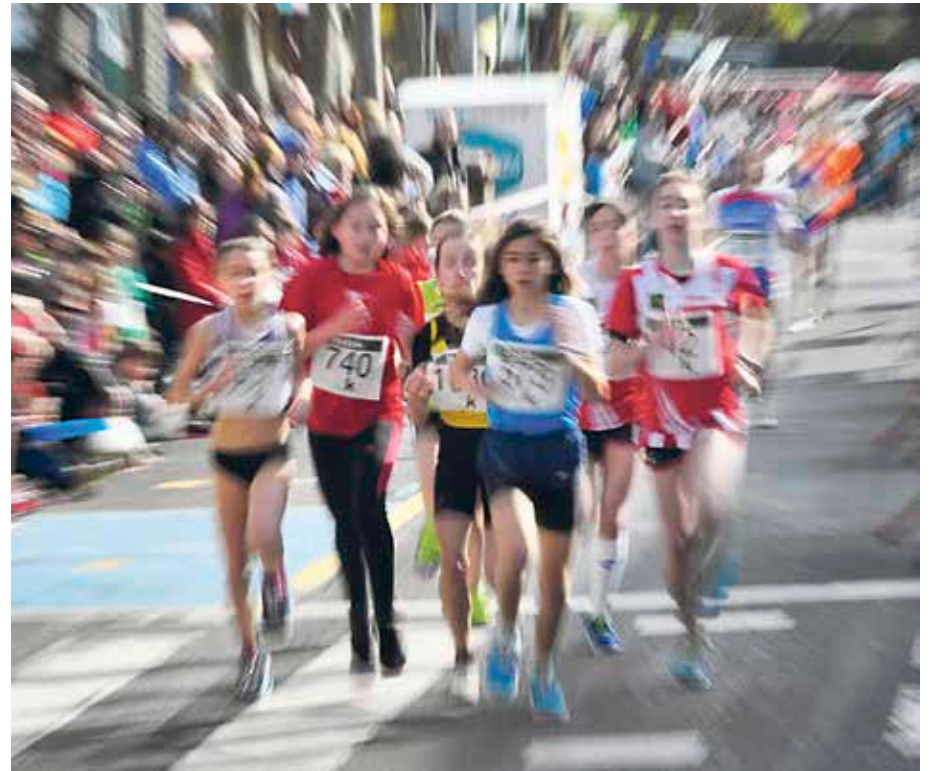
Parte-hartzaile asko izan ohi du herri-lasterketak.

Nationwide umeentzako ospitaleagaz dabil lanean, farmako bat gizakiak probatzeko ahaleginetan. Sanfilippo sindromea nerbio-sistema zentralaren endekapenezko gaixotasuna da, heparan-N-sulfatasa entzimaren faltak eragindakoa. Horren eraginez, Sanfilippo