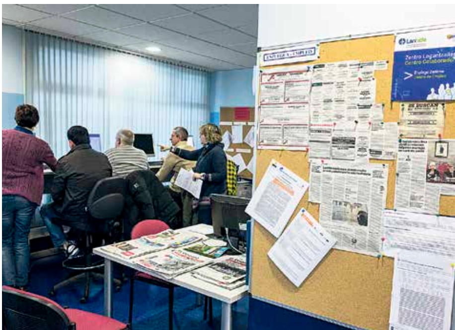
Mendibile kaleko 3. zenbakian dago Leioako Behargintza.

Leioako Behargintzak 42 enpresa-proiektu bultzatu zituen 2014an, udal iturriek adierazi dutenez. Ekonomia eta enplegua sustatzeko herri-erakundeak aholkularitza-zerbitzuak eskaintzen ditu enpresak abiarazteko orduan, negozio berritzaile eta lehiakorrek sortzeko helburuagaz. Leioako Behargintzak daukan «egin-behar nagusia» da «autoenplegu-proiektua martxan jarri gura duten bizilagunei, edo, kanpokoak izanda, Leioan, herriak duen ahalmen ekonomikoagatik, enpresa abiarazi gura dutenei lagundu eta aholkatzea», gaineratu dute agintari leioaztarrek.