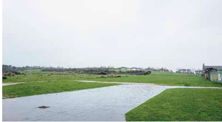
Udalak 263.000 euro ordaindu ditu Galeako lursail horientatik.

Udalak Galeako lursailak desjabetzeko ordainduta-ko 263.000 euroak berretsen duen epaia plazaratu du Euskal Autonomia Erkidegoko Justizia Auzitegi Nagusiak (EAEAN). Hala, epaiak lursail horien lehengo ugazaben gura nagusia errefusatu du, hau da, Galeako gotorleku, itsaslabarreko goialde eta udal hilerriaren arteko lursaila urbanizagarri izendatzea. Hori landa-lurzoru legez sailkatuta dago, eta urbanizagarri bezala baloratuz gero, 12 milioi euroko kalte-ordain oso baterako bidea emango luke. Udalak 2011n desjabetu zituen lurzoru ho-