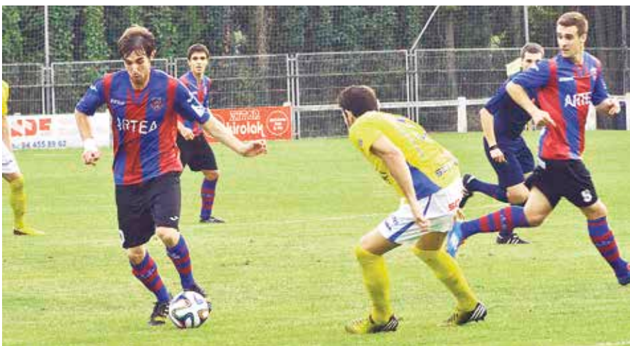
Leioaztarrek galeren bolada eten zuten Real Madrid Castillaren aurka.