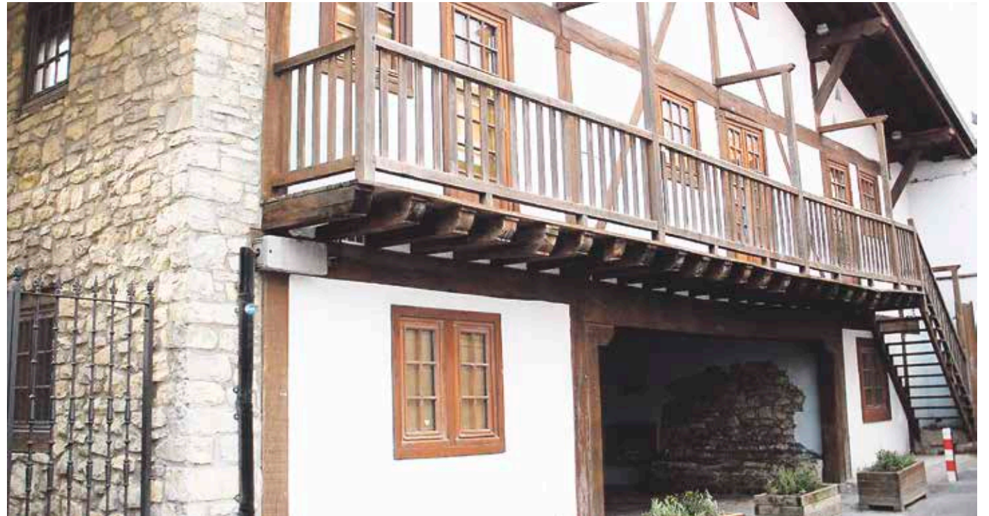
Tailer eta hitzaldi gehienak Goñi Portalean egingo dituzte.

Bizimodua eta jarrera osasuntsuagoak bultzatzeko, eskualdeko Osasun Astea egingo dute Plentzian. Hainbat tailer, ikastaro eta berbaldi egingo dituzte. Horietan parte hartzeko, alde zuzenetik izena eman beharko da.