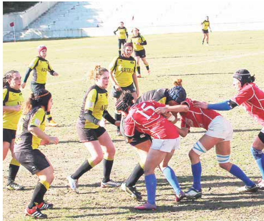
Partida bat ere ez dute galdu getxoztarrek denboraldi honetan.