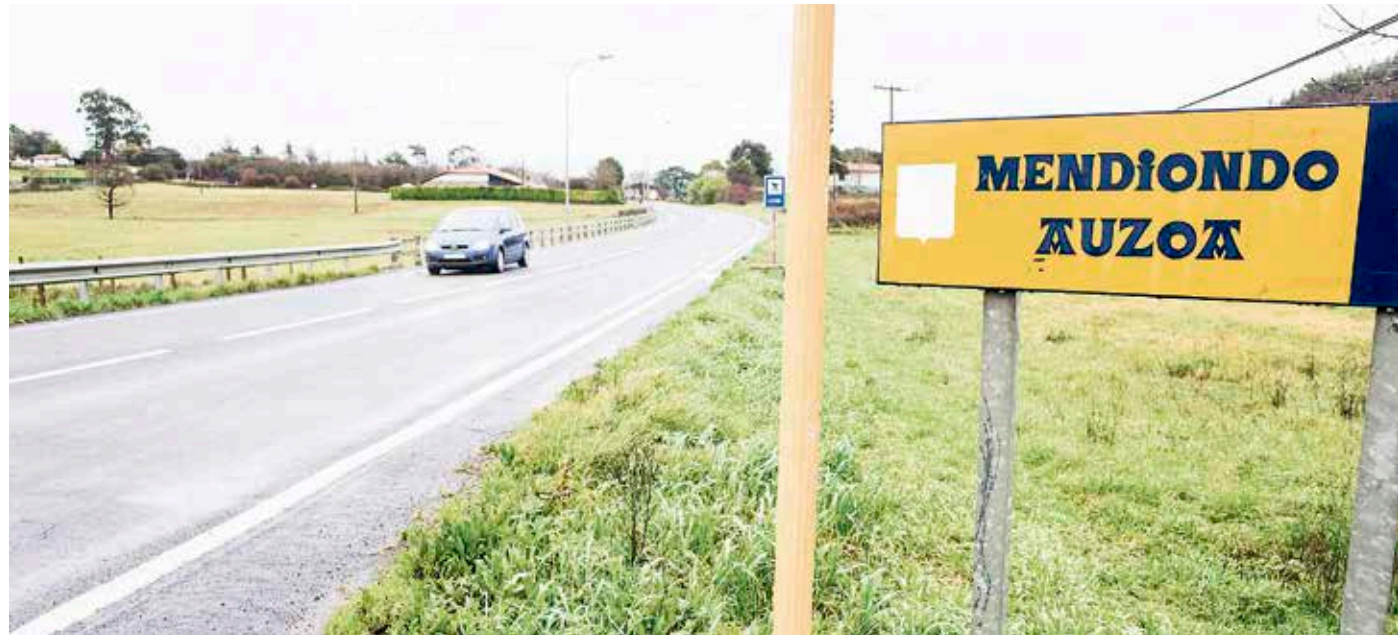
Obra Unbe gain, Pozozabala eta Mendiondo artean egingo dituzte.

BI-2704 errepidearen segurtasuna hobetzeko behin-behineko plana onartu du Bizkaiko Foru Aldundiak.