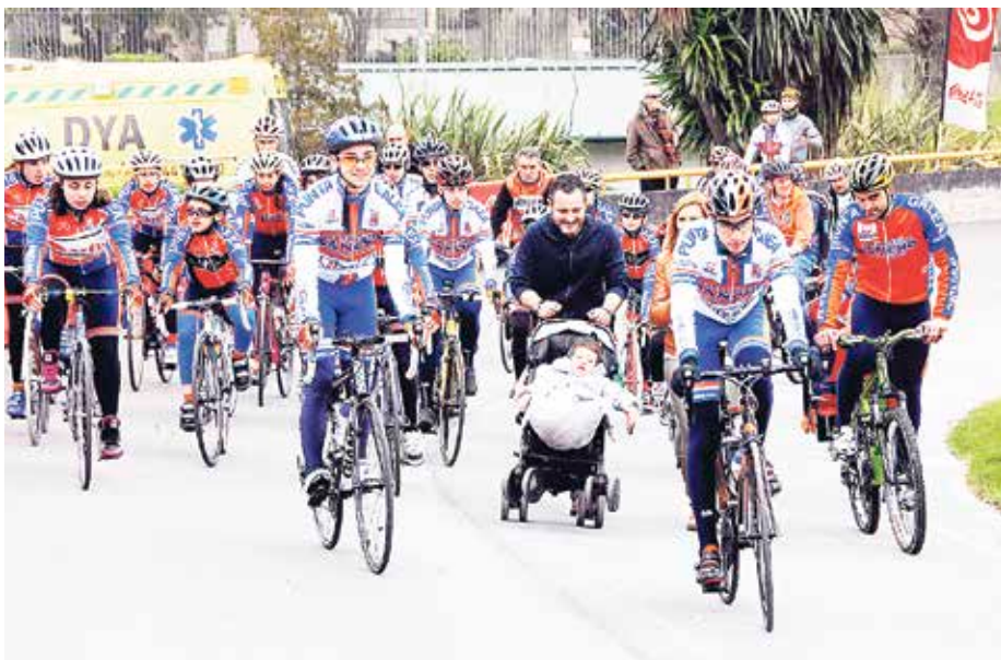
Aurreko edizioak arrakastatsuak izan dira.