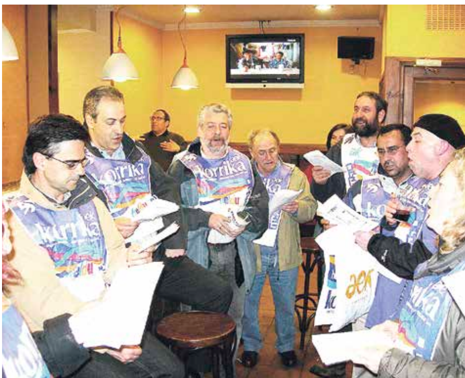
Korrika ospatzeko, afaria eta kantagunea egin ohi dute Erandion.

Horregatik, egileak eta ikusleak elkarrengana hurbiltzeko asmoz, emanaldi batzuetan berbaldia egingo da zuzendariagaz. Izan ere, sortzaileei euskarazko produkzioa eta beren lanak ezagutzera emateko aukera eskaini gura die Laburbirak. Zirkuitua helduko den herrietako askok, txikiak izanda, gutxitan edukitzen dute zinema bertan eskaintzeko aukera. ◀