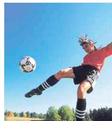
Partida domekan izango da.

Guztira, 20 herritan jokatu da lehiaketa. Denetan, ateak eta zelaiak lurtzorian marraztuta egongo dira, aspaldi egiten zen bezala. Partida denak 10:30etik 13:30era izango dira, eta lau