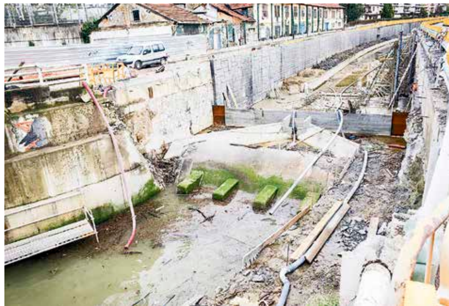
Errekaganekeo tartean 2. faseari ekingo diote laster.

Pasa den otsailaren 18an Getxoko Udalak antolatutako Uraldietako Informazio Batzorde Berezian parte hartu zuen URAk. Horretan, Fadurako tartean hobetze hidraulikoa lortzeko ekintzen proiektua behin-behinean onartu zuten; egiteko horiek Gobela ibaiaren egokitzapen hidraulikoa zein ingurumen-lehengoratzea gauzatzeko egitasmoaren baitan aurreikusita zeu-