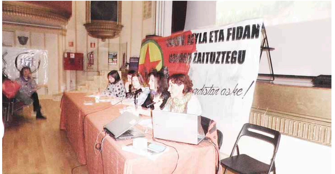
Elkarteak bloga erabiltzen du albisteak hedatzeko: www.newrozeuskalkurduelkartea.wordpress.com

Emakumearen zeregina funtsezkoa da. Hori guztia PKK (Kurdistaneko Langi-