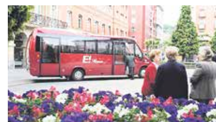
Auzo txikiak herriguneagaz lotzen ditu E-busak.

Zehazki, honako neurriak hartzea eskatu dute sozialistek: Erandiogoi-koan zenbait geraleku aldatzea; markesinak jartzea, batez ere auzo berean egurats gorrian dauden geralekue-tan; maiztasunak aldatzea, «askotan Bizkaibusek ematen duen hiriarteko zerbitzuagaz bat egiten duelako»; eta