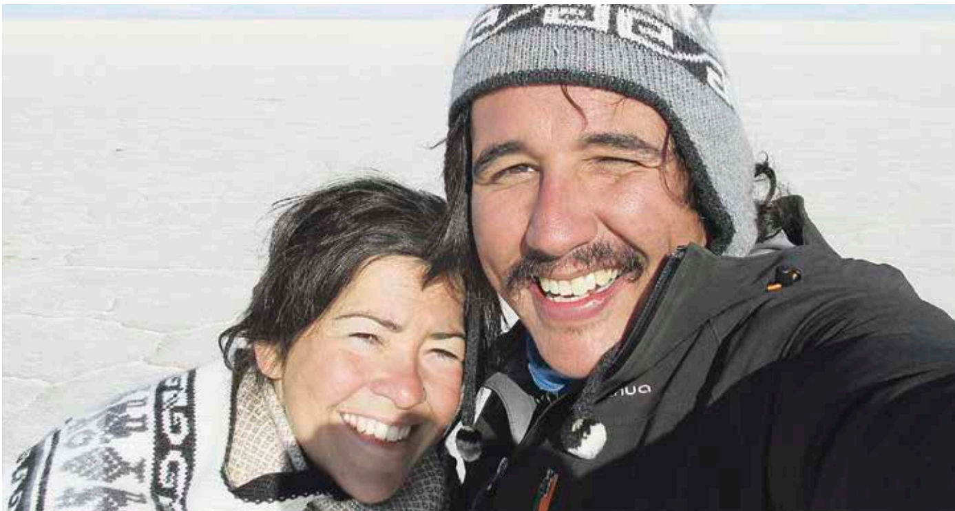
Uyuniko gatz-lautada bisitatu dute, besteak beste. CANELA ETA CANELON