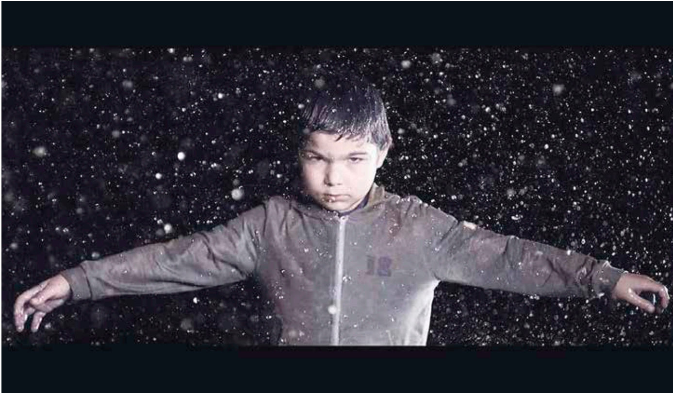
Herriz herri ikusgai egongo den Arconada film laburreko irudia.