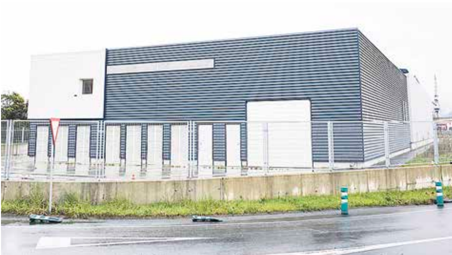
Lamiakoko kotxetegiak hutsik daude oraindino.