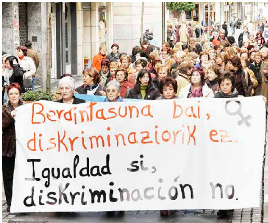
Aldarrikapena eta ospakizunak tartekatuko dira Erandioko feministen egitarauan.

H erenegun, martitzena, abiatu zuten Erandion Emakumeen Nazioarteko Egurenaren harira antolatutako astea. Aurtengo uztailen 25 urte beteko dituen Erandioko emakumeen elkarte soziokulturalak batzar orokorra egin zuen, hurrengo egunean bazkideen bazkaria egin aurretik. Halere, astelehenera arte izango da aldarrikapen zein ospakizunerako tartea.