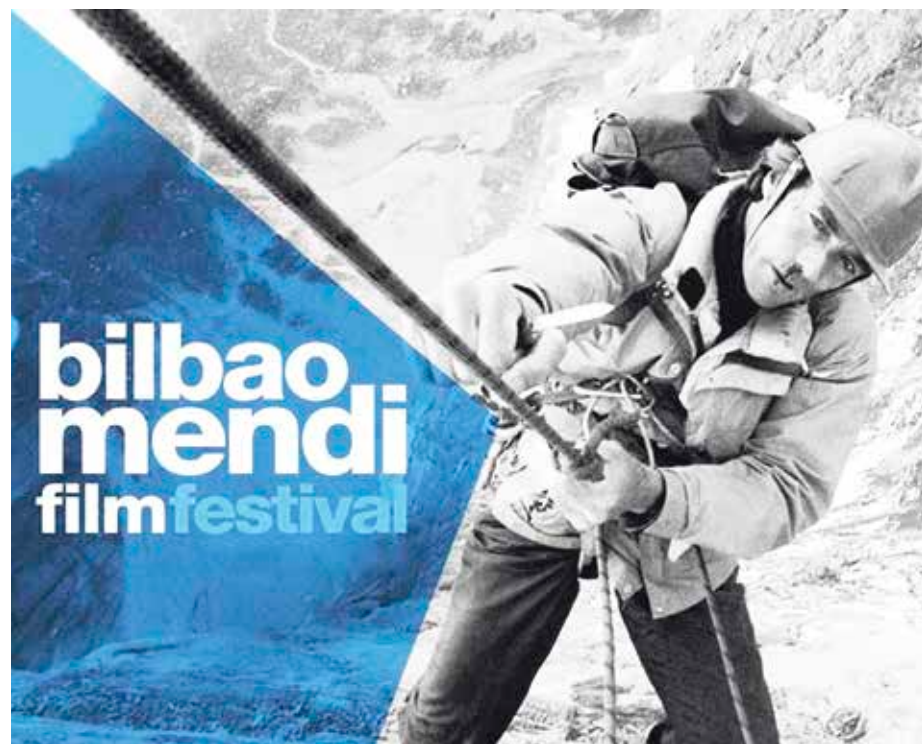
Bilboko Mendifilm jaialdiko filmak herriz herri dabilta asteotan.