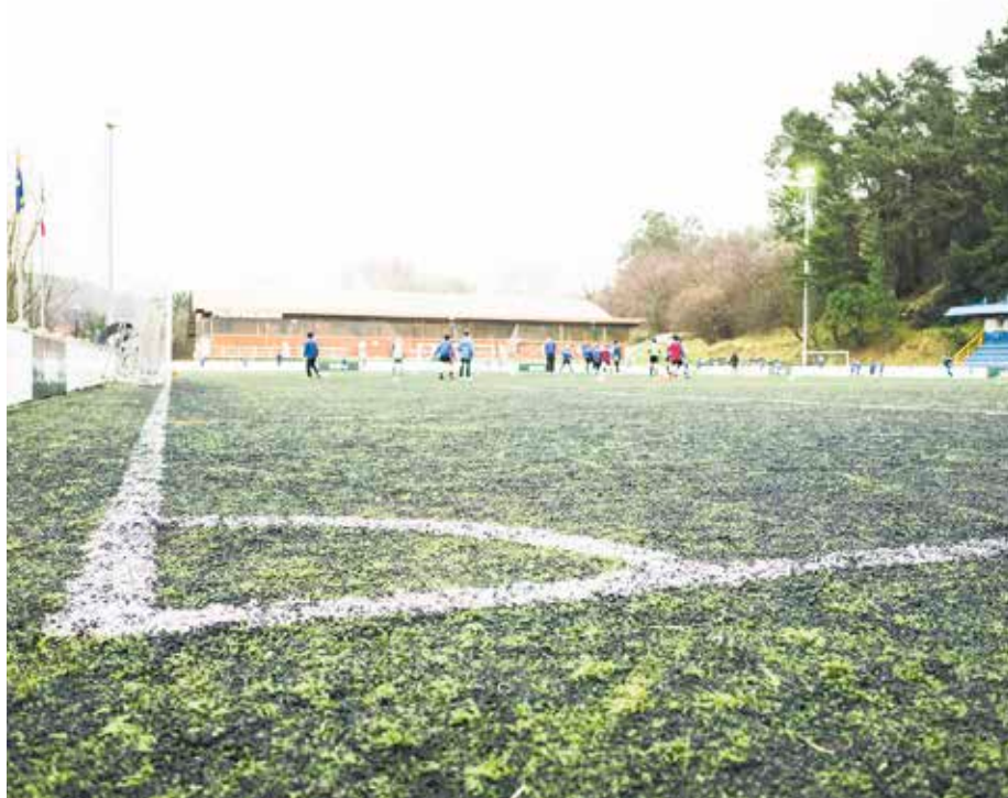
Urko futbol-zelaiaren belarra hobetzeko 4.000 euro aurreikusten ziren

Udal Gobernuak 639.607 euroko aurrekontu-moldaketa aurkeztu zuen otsaileko udalbatzara, «beharrezkoak» diren proiektuak onartzeko asmoz, baina oposizioak ez du onartu.