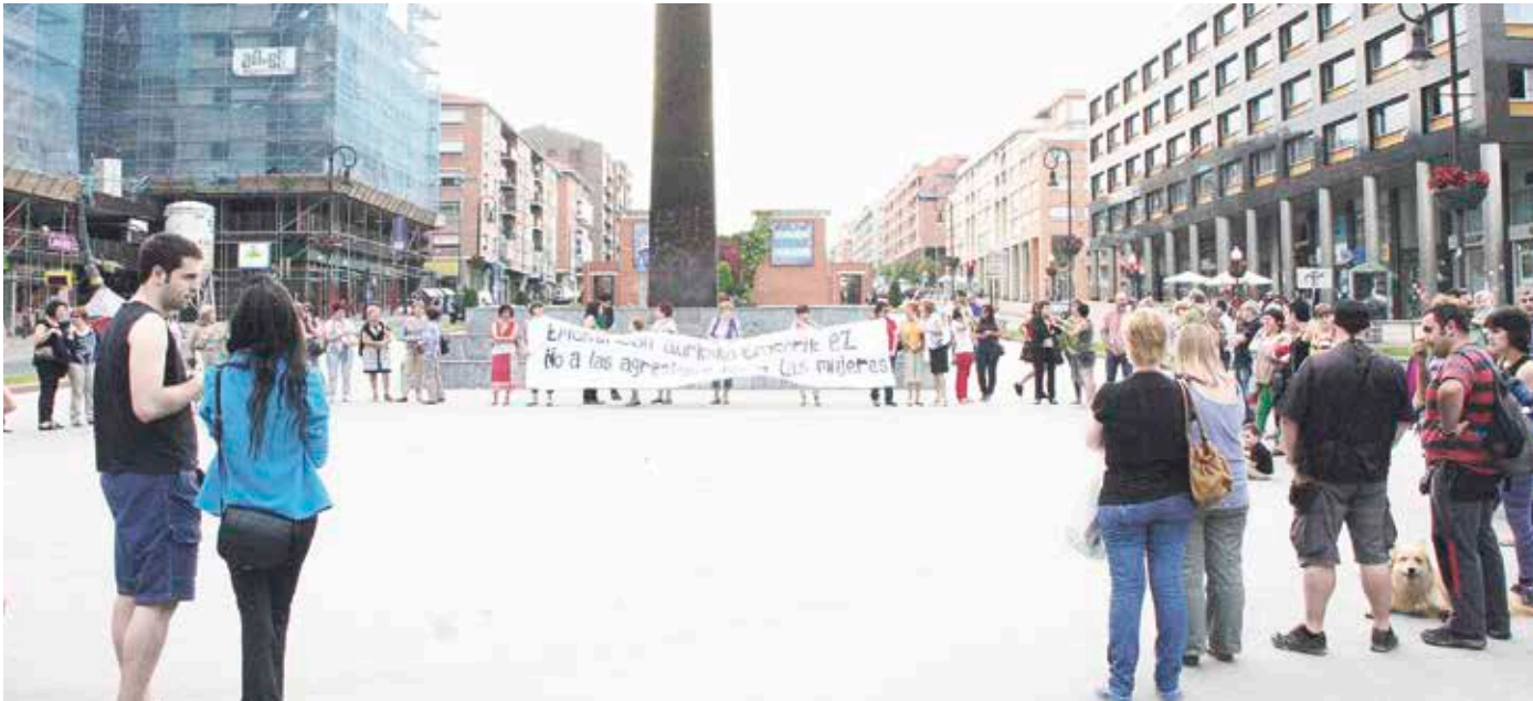
Leioaztarrek Boulevarden aldarrikatu ohi dituzte emakumeen eskubideak.