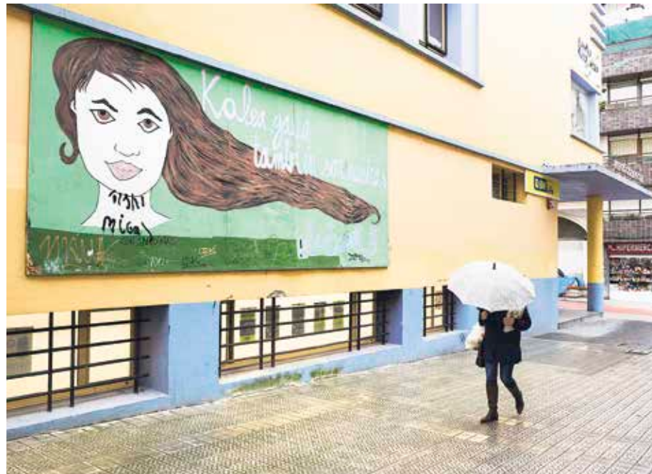
Martxoaren 8an manifestazioa eta kontzentrazioa egingo dute Algortan eta Romon, hurrenez hurren.

Lehenengo hitzordua martxoaren 6an izango da, barikuan. Egun horretan Bilboko Guggenheim museora joateko bisita gidatua antolatu dute: Niki de Saint Phalle artista feministaren erakusketa ikusteko alde aurretik izena eman beharko da. Hurrengo egunean, hilak 7, Las Lisytratas antzezlanaren egongo da ikusgai Areetako Andres Isasi musika eskolan, 19:00etan, hiru euroren truke. Martxoaren 8an, bi hitzordu egingo dituzte, bata Algortan eta bestea Itzurbaltzeta/Romon. Lehenengoan, Bilgune Feminista, Ernai, Haziak eta Mujeres con Voz talde feministek 11:00etan hasiko dute eguna San Nikolas enparantzan. Bertan zaintzaren inguruan eztabaidatuko dute; ondoren, 12:30ean txokolateagaz ez-erriak berotuko dituzte eta 13:00ak