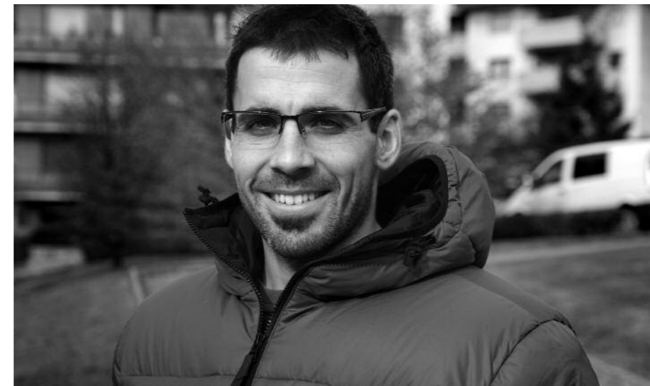
Triatloi zaletuek aukera izango dute Aste Santuko 5 egunetan kirolaz gozatzeko

"Gero eta zaletu gehiago ditu triatloiak; baina, orain, hori guztia bideratu behar dugu"