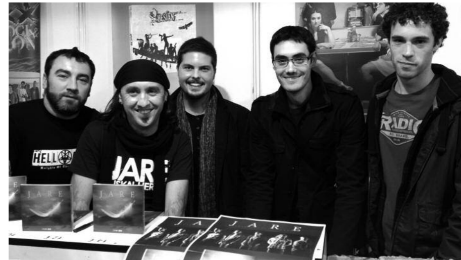
Taldeakide sopolaztarrak dituen taldeak Kurtzio kultur etxean emongo du kontzertua

Jare taldeak kontzertua eskainiko du Sopelan urtarrilaren 25ean