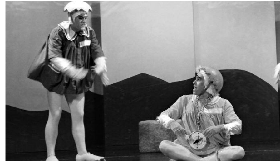
Ahate itsusia antzetzuko dute abenduaren 26an Kultur Leioan

Gabonetan izango dira antzerki-zikloa , futbol-kanpusa eta gazteentzako ekimenak