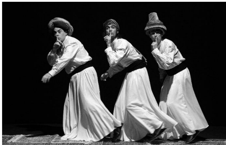
Ali Baba eta 40 lapurrak antzezlanaren abenduaren 23an izango da

Hamaika ekimen prestatu ditu Kultur Etxeak Gabonetarako, batez ere haurrei begira. Abenduaren 23an izango da lehenengo ikuskizuna, Ali Baba eta 40 lapurrak antzezlanagaz. 19:00etan hasiko da, Santa Ana antzokian.