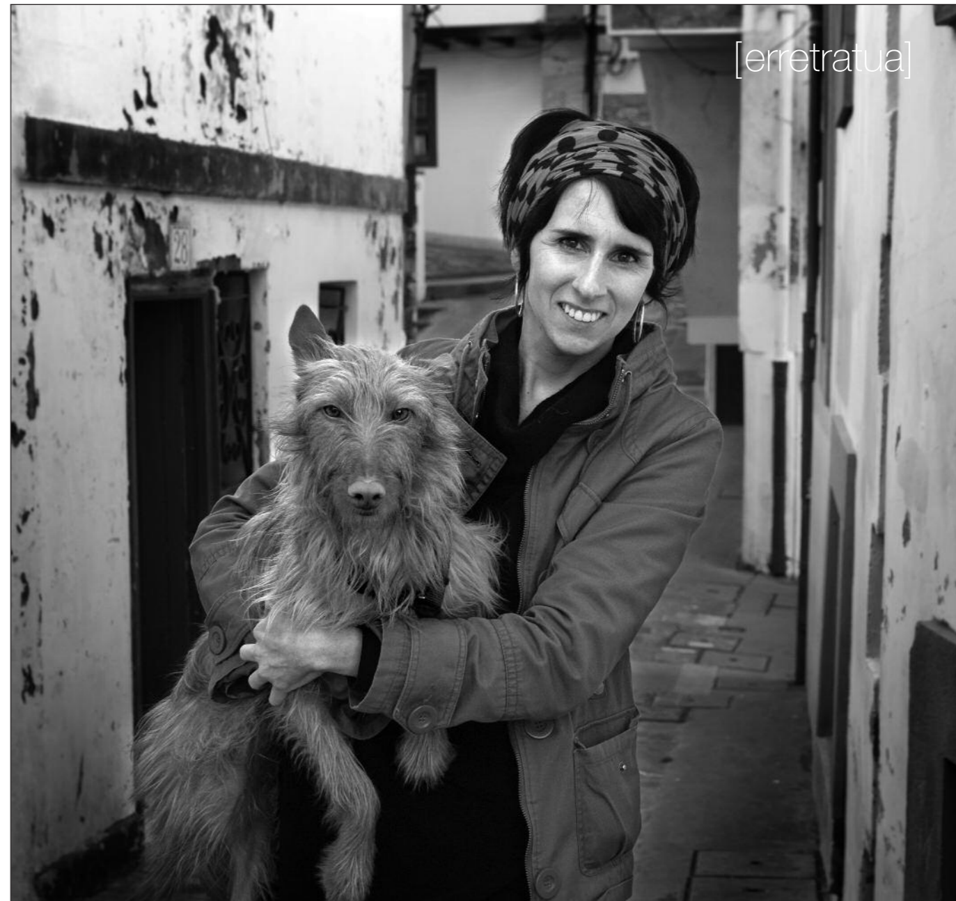
“Zein lekutan geratu jakin beharrak beldurra eman dezake, zelan jakin zein den zure lekua?”