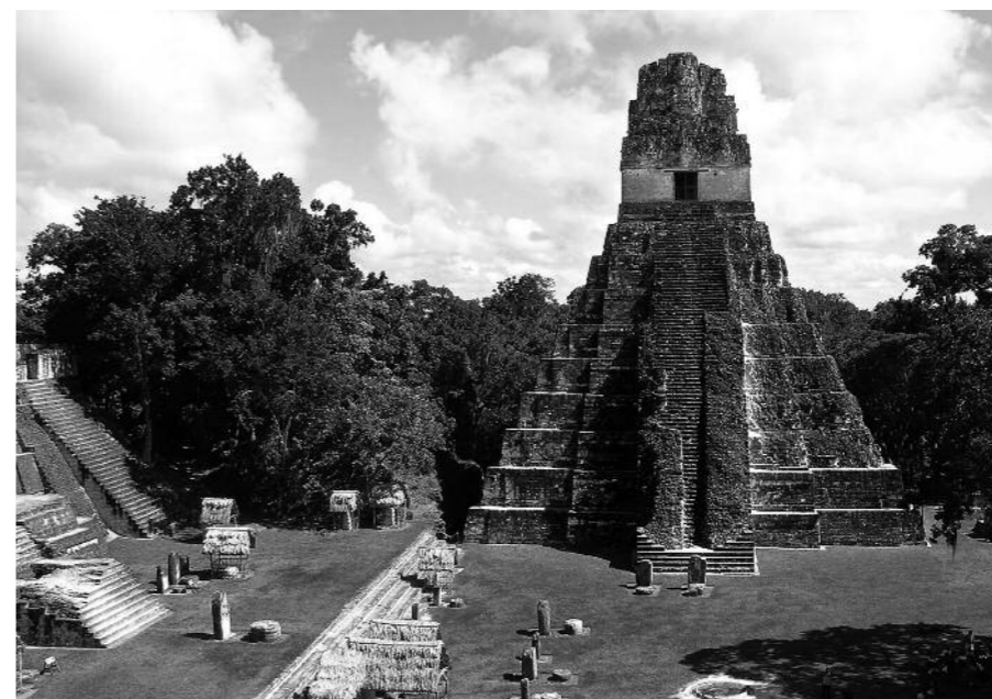
Maien Tikal hiri ohia (Guatemala)

Zoritzarreko teoria horiek hankazgora ipini ditu, ordea, Guatemalako Xultun hiri zaharrean 2010ean topatutako egutegiak. Science aldizkariak 2012ko maiatzean argitaratu zuenez, AEB-ko Bostongo unibertsitateko ikerlariak piktograma batzuk aurkitu zituzten eraikin bateko gelan, paretetan margotua. Uste