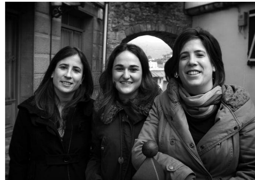
Interneten ere ikusgai daude bideoak, web-orri honetan: www.plentziatelebista.com

“Egun, herri-telebista batek 25 urte betetzeak meritu handia dauka”