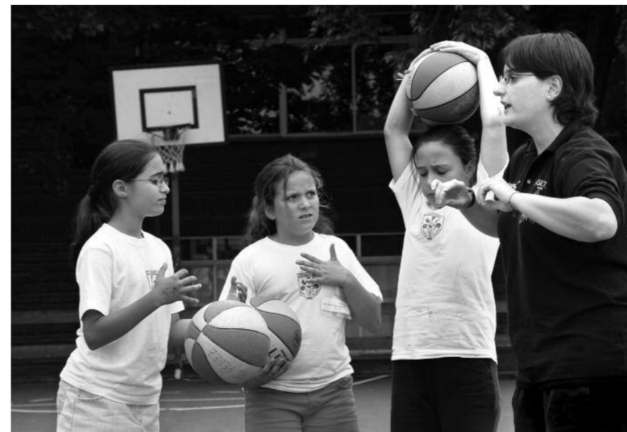
Urtero antolatzen dituzte kirol-campusak umeentzat oportetan

Gabonetarako antolatu dituzte kirol-campusak kiroldegietan eta bela-eskolan