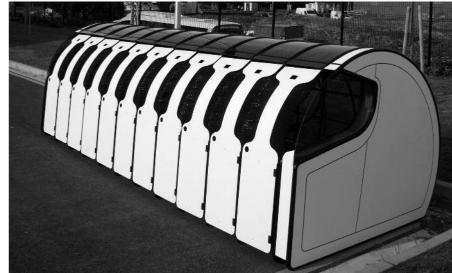
Apirilera arte probatuko dute @park@ sistema

Bizikletentzako sistema barria probatzen ari da