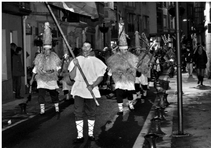
Gabonetan kaleko giroa bizi-bizia izango da

Gabonetan murgildurik ekimen andana egongo da Uribe Kostan