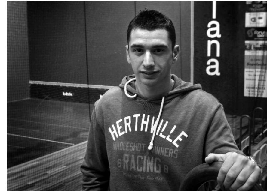
Sopeloztarrek bost txapel lortu ditu daborduko trinketean

"Euskal Selektzioan harreman oso estua izan dugu... eta gainera irabazi!"