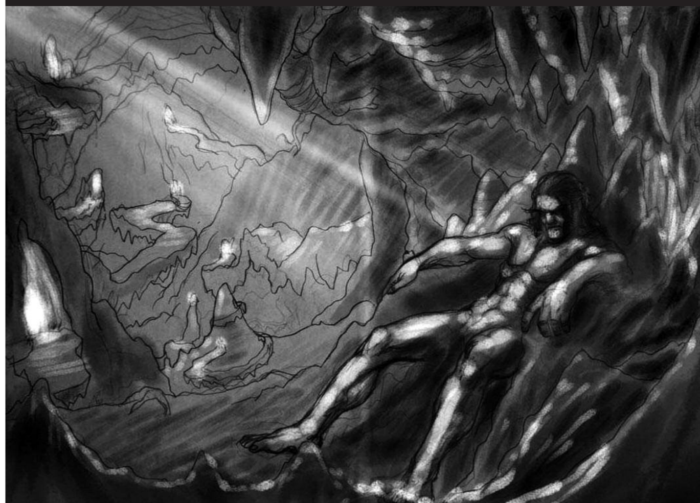
Mari. Ilustrazioa: Daniel Castello

Atal honetan agertzen diren testuak eta ilustrazioak “Euskal Herriko Mitologia. Jentilen aztarnen atzetik” proiektutik ateratakoak dira. Adarmendi eta Orritz euskal kultur elkarteek bultzatutakoak. Materialak ikusteko edo informazio gehiago lortzeko www.euskalherrikomitologia.com webgunera jo.