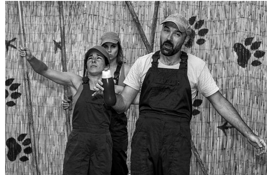
Info+: www.erandio.net guneko agendan

Auzoz auzo, hamaika jarduera prestatu dute umeentzat Gabonetarako: abenduaren 22 eta 23an Erandiogoikoako kultur etxean, 26tik 29ra Alzagan eta urtarrilaren 2tik 5era Astrabuduan.