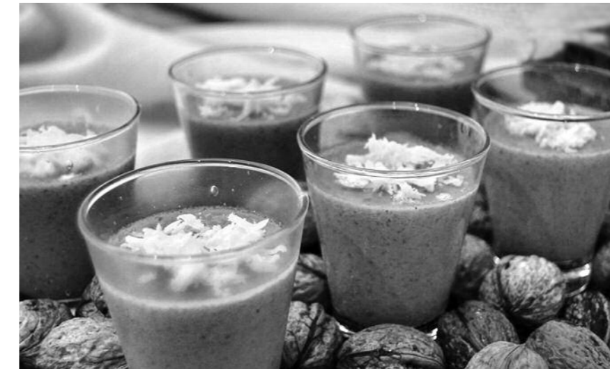
Intxaur-saltsa betiko gabon-errezeta erraz asko egiten da

Negua heldu da, eta haregaz batera hezurretaraino sartzen zaigun hotza ere bai; horregatik, hainbat modutan hari aurre egiten ahalegintzen gara, besteak beste, jaki beroak hartuz. Oraingoan, dakarkizugun jakiak, saltsak, alegia, bero mantentzen lagun diezaguke. Gurean tradizio handiko jakia aurkeztzen ari gatzazkizu: Intxaur-saltsa. Has gaitezen, bada, saltsa gozo honen errezeta deskribatzen; lehengo eta behin, intxaurrak zuritu behar ditugu, ondoren xehe-xehe txikitzeko, ore fina lortu arte. Jarraian, intxaur-orea azukregaz nahastuko dugu. Horrez gainera, lapiko batean esnea berotzen ipiniko dugu, limoi-azala eta kanela gehituko dizkiogu esneak zapore gozo-gozoa lor