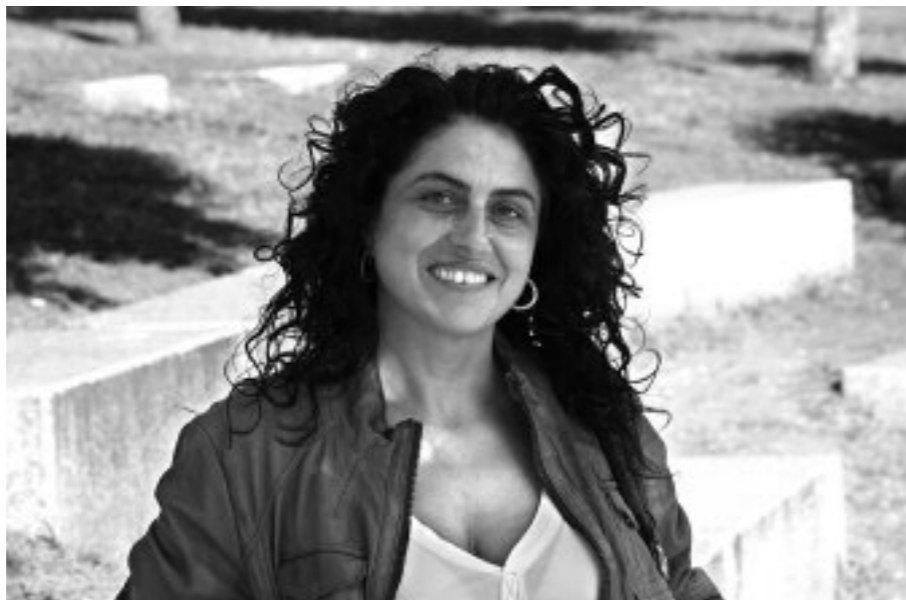
Bide Ananda hamar urte daroa coaching ikastaroak eskaintzen

—Helburua da beharrezko aldaketak egitea gure bizitzan, hobetzeko eta