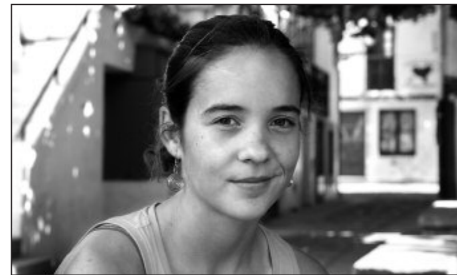
Getxoko Udalak banatzen dituen Sasoi-Sasoian sariketan aurrean Kirolari onena izendatu zuten

“Amestu? Ez dakit nik... Badakizu: entrenatzen jarraitu eta ahalik eta urrunen heltzea”