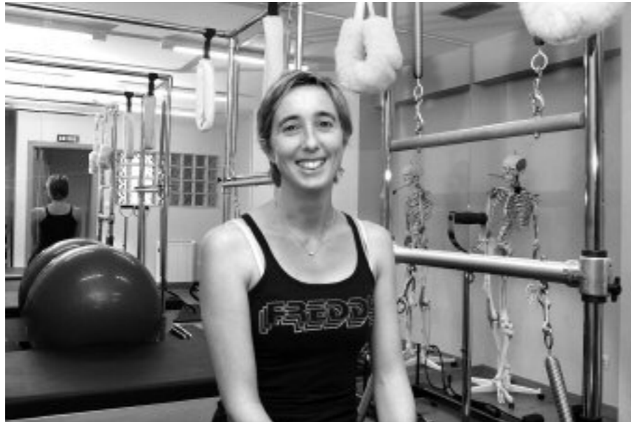
Estartetxe kalean dauka pilates metodoa irakasteko estudioa Ortuetak

—Balleta profesionalki dantzatzea erabaki nuenean, jo ta ke ekin nion konpainia bat bilatzeari, hainbat audizio egin nituen Londresera joan aurretik. Baina The Royal Balletek kontratatu ninduenean, lasaitua hartu nuen. Balleta oso zorrotza da eta lagundu zidan helburua lortzeko saiakera egitera. Bakarlarri izan nintzen eta izugarria izan zen. Asko gozatu nuen,