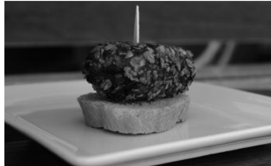
Pintxo txapelketa egingo dute Jaialdiaren barruan

Zinema eta gastronomia urriko lehen egunetan