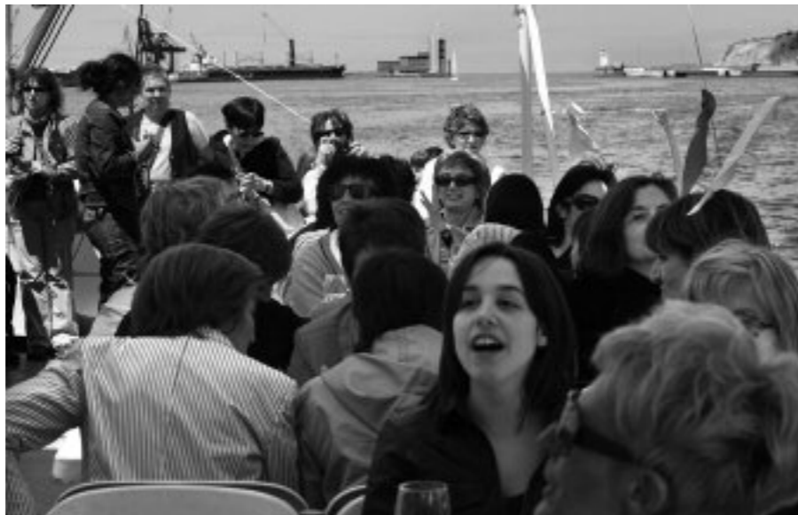
Aurreko edizio batean Jabekuntza Eskolak egindako txangoaren irudia

Emakumeek politikan eta gizartearen parte-hartzea sustatzeko helburuagaz jaio zen Jabekuntza Eskola eta horretan jarraitzen du. Getxoko Udalak, Ermuko, Basauriko eta Ondarruko Udalakaz batera antolatzen du Eskola. 2010-2011 ikasturterako joan den urteko eskaintza zabaldu dute Getxon; zazpi ildo landuko dituzte eskainiko diren 19 ikastaroetan. Guztien helburua, hausnarketarako, prestakuntzarako eta topaketarako espazioa sortzea da, emakumeek emakumeentzako egindako espazioa.