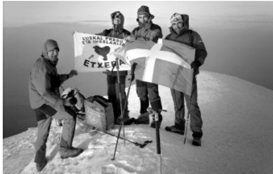
Turkiak hartutako Kurdistanen dago Ararat mendia

naiz. Gida geneukan, han derrigorrezkoa da. Hainbat urtetan itxita egon da zonaldea, borroka armatua aktiboa izan da urtetan, orain ez da zona oso beroa eta turismoari zabalduz doaz, baina ezin da norbere kabuz joan.