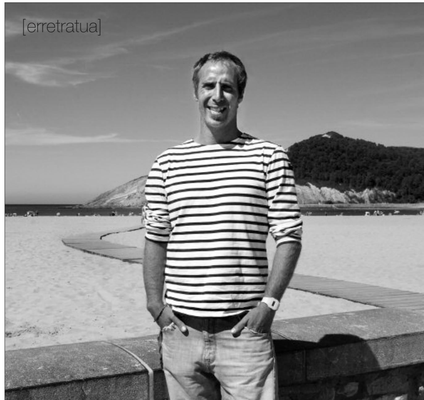
“Uretan sartu eta neska-mutilakaz batera surfean egon gura nuen”