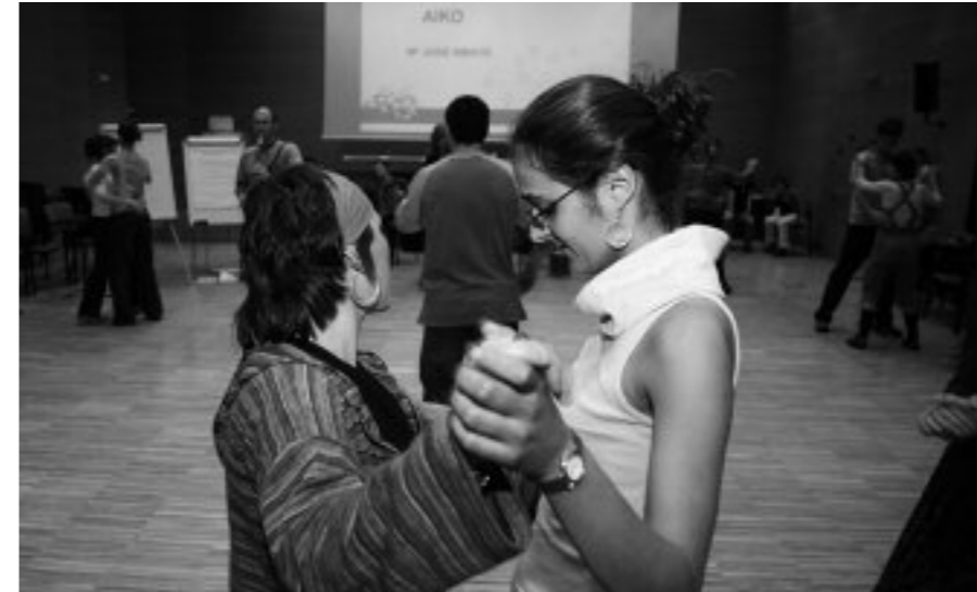
Informazio gehiago eta matrikula egiteko: www.aikotaldea.com edo 646 336 147

irailetik urrira astelehenero, AIKO taldearen tailerretan, Dantzaldi Ibiltarian