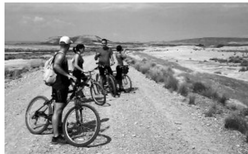
Bardeetara egindako txangoa

Ohiturak aldatuz doaz eta bizimodu zein zaletasun barriei egokitu behar zaizkie, baita euskara arloan ere. Bizarra Lepoan euskara elkarteak ondo baino hobeto ikasi du ikasgaia eta hizkuntza praktikatzeko modu barriak asmatu ditu aurten: Biker berbalagun taldea sortu du. Beraz, bizikletan ibiltzea maite duzuenok, orain badaukazue aukera zaletasuna eta euskara, biak batzeko. Urritik ekainera, hilabeteko lehen zapatuan elkartuko da taldea beti, 09:00etan, Algortako Geltokia plazan. Era berean, inguruak ezagutzeko aukera izango dute berbalagunek, ibilbideak ez dira ez oso luzeak ez oso zailak izango, bide lasaiak lehiarik barik egiteko. Izena emateko deitu 685 732 963 telefonora edo bidali mezua egizugetxo@gmail.com helbidera. Egizu “ barne-turismoa, euskaraz, konpainia ezin hobean ”. ○