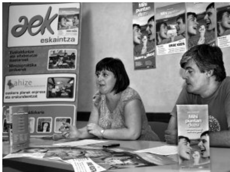
Aurten Urdulizen eta Lemoizen ere eskainiko dituzte ikastaroak. UKBERRI.NET

“ Euskara? Bai, nahi dut! ” leloa aukeratu du AEK-k, Alfabetatze Euskalduntze Koordinakundeak, aurtengo matrikulazio kanpainarako. Irailaren 29ra arte izena eman daiteke Uribe Kostako AEK-ko edozein euskaltegitan, 11:00etatik 13:00etara eta 17:00etatik 19:00etara (euskaltegiaren arabera aldaketak egon litezke). Aurten barrikuntza asko dakar AEK-k. Garrantzitsuena da beste bi herritan eskainiko dituztela klaseak, Urdulizen eta Lemoizen. Bestalde, “ Hura ikusi, ha ikasi ” materiala lantzeko ikastaro berezia prestatu dute irakasleentzat, beraien mailari egokitutako ikastaro trinkoak eskainiko dizkiete ikastetxeetako ikasleei, eta autoikaskuntza metodo mixtoa abiatuko dute etxean ikasi gura dutenentzat, Ikasgel@ . Horretaz gain, guraso taldeak jarraituko dute, bizkaiera ikasteko aukera ere izango dute. Eta ezin ahaztu udabarrian 17. Korrikak zeharkatuko duela Euskal Herria. Has zaitezke entrenatzen! ○