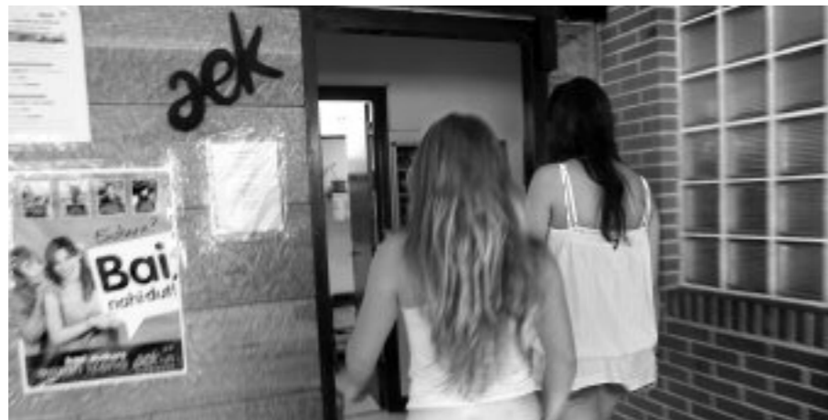
Gorliz eta Sopelako euskaltegietan izango dira eskolak

Ikasturtea martxan da dagoeneko eta han edo hemen izena emateko ordua heldu da. Uribe Kostako Mankomunitatean parte hartzen duten Udalek, Euskara Zerbitzuaren bitartez, ikastaro sorta presatu dute euskara ikasi gura dutentzat.