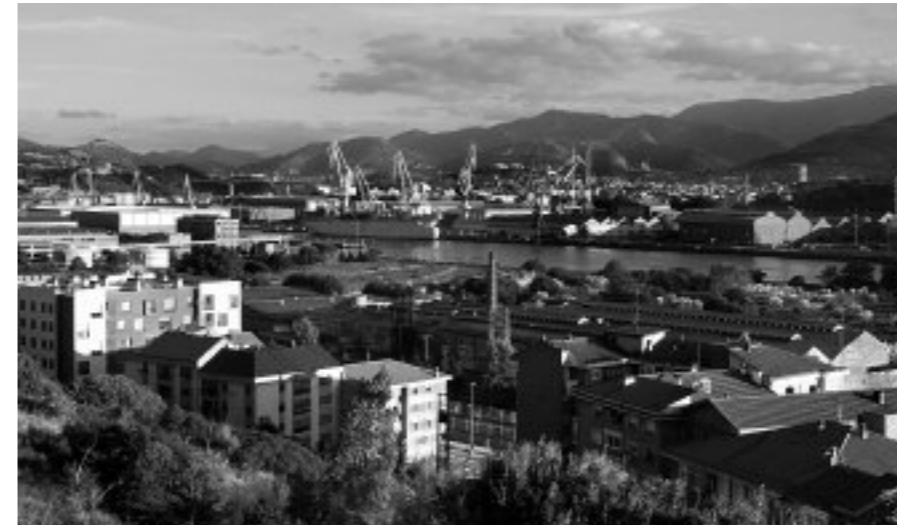
Zubi altxagarriak 150 metro luze eta 55 metro altu izango omen ditu

Tranbia Sestaora eroateko itsasadarra zeharkatuko duen zubia eraiki gura dute