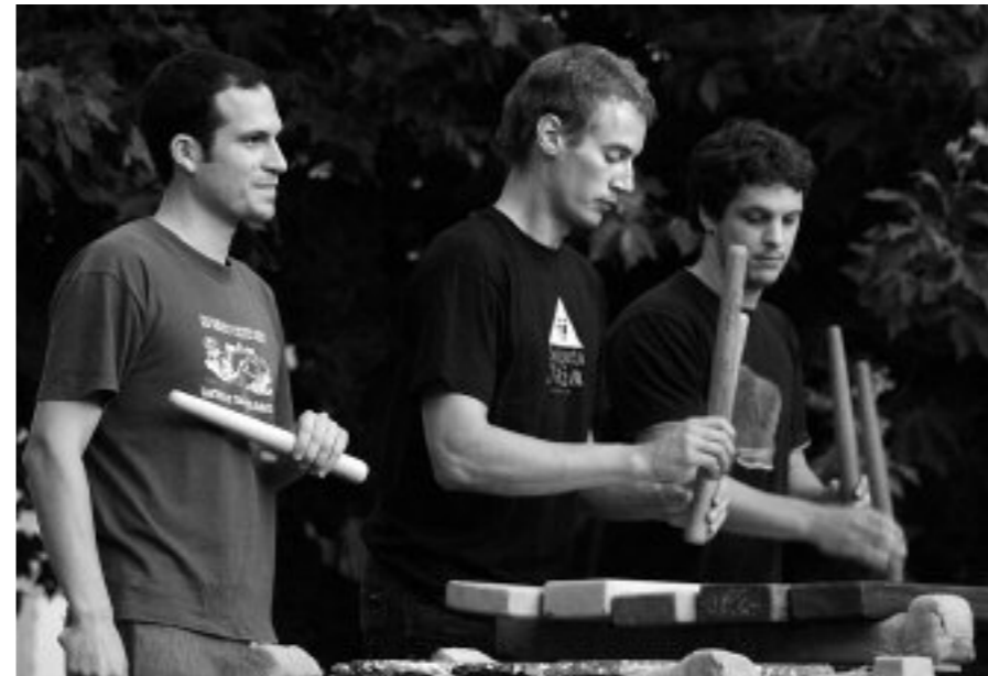
Publiko guztientzako ekimen herrikoia izango da VII. Txalaparta Jaia

VII. Txalaparta Jaia ospatuko dute UKTEST taldeko lagunek irailaren 25ean