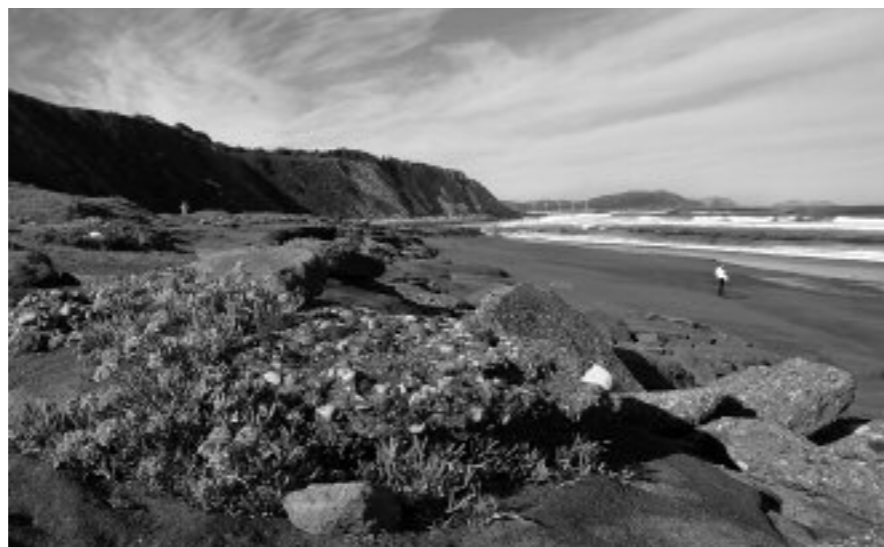
Uribe Kostako eta Bizkaiko beste hainbat herri ere parte hartuko du Jardunaldietan

Sopelako iragana ezagutzera emango dute ondareari buruzko jardunaldietan , urrian