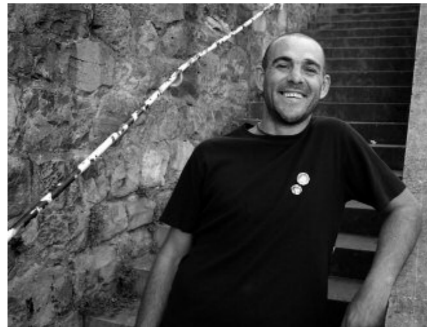
Orri batzuk irakurtzeko: oficinadehechos.blogspot.com

"Liburuagaz gustuko nuke ohartaraztea gizakien arteko harremanen garrantziaz"