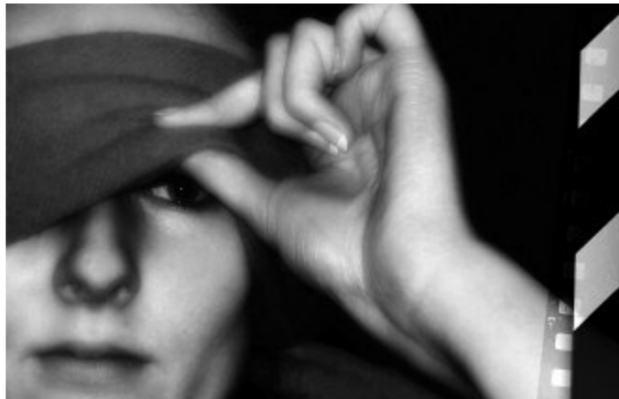
Ekitaldiaren irudia. Informazio gehiago: www.kcd-ongd.org/euskera-1/zinema-ikusezina

Zine Ikusezinaren Nazioarteko Jaialdia irailaren 28tik urriaren 5era egingo da