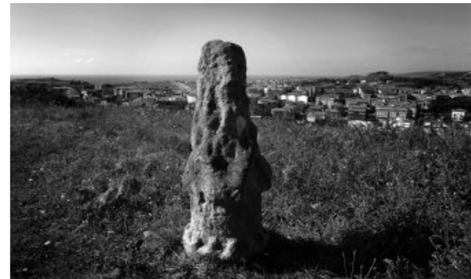
Sopelako Fraidemendin, Munarri

Sasoi honetan gizakiak eskerrak emoten izan deusoz ugalkortasun hori posible egiten daben indarrei, eta horregaz batera, ugalkortasun horren fruituak arriskuan ipinten dabezan indarren kon-