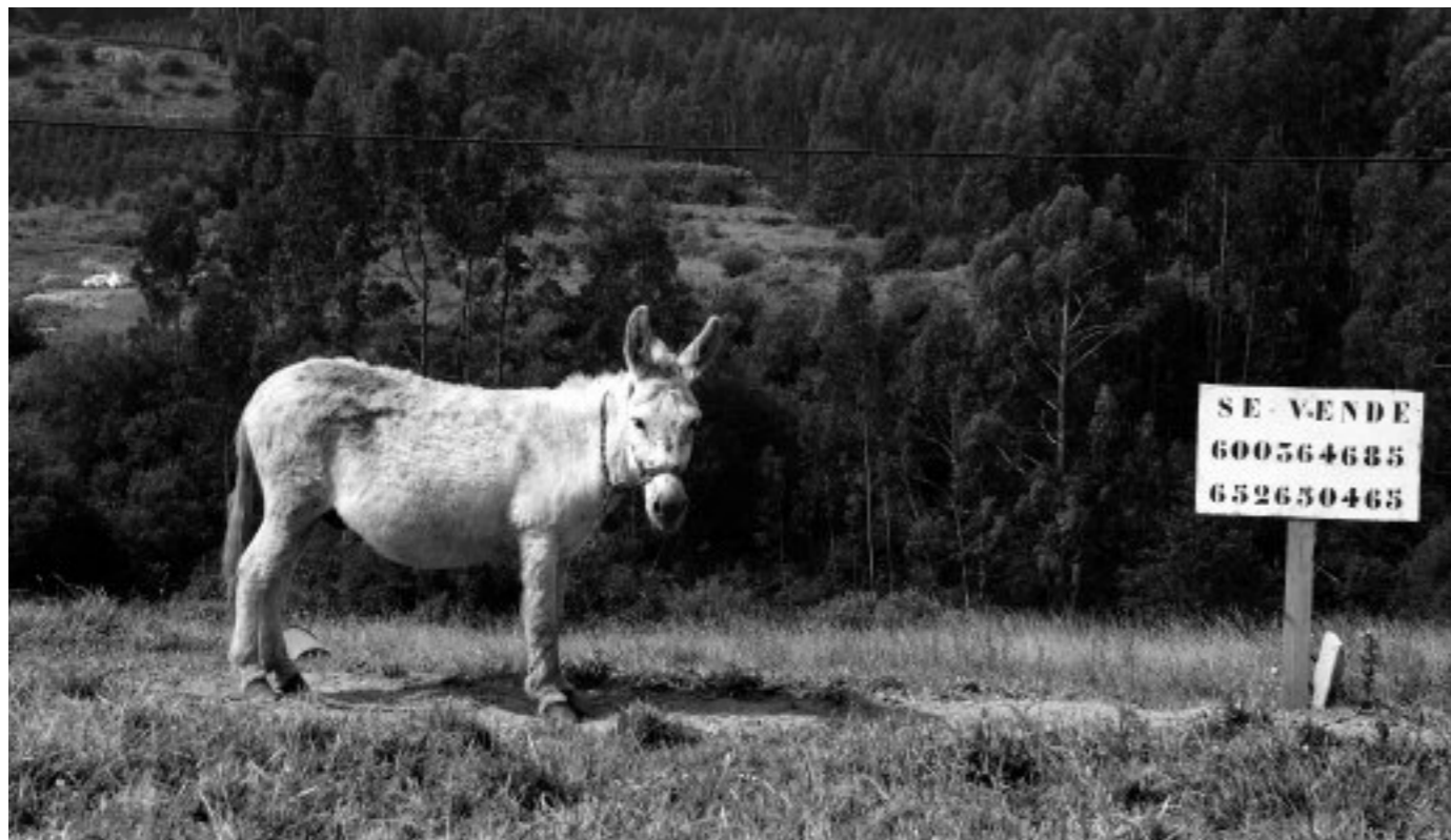
2010eko uztaila, Urduliz

Testua: Beñat Vidal