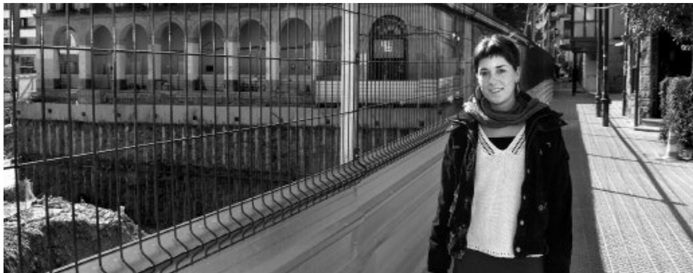
“Orain arte izan dena ez da berriro izango”

“Ez zeukan askorik, baina ez zitzaigun ezer falta”