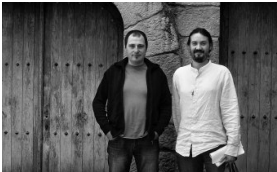
Liburuaren egileak: Xabier Alberdi Lonbide eta Jesus M. Perez Centeno

—Liburu dibulгатiboa da, helburua da jendeak ezagut dezala gure kostaldeko herrietan azpiegitura horiek izan direla, talaiak. Beren ezaugarriak deskribatu ditugu, jatorriak arakatu, funtzioak deskribatu, historian zehar bizi duten garaipena azaldu eta gidatxo osatu dugu jendea talaiak bisitatzea hurbil dadin. Toki oso ederretan daude, paisaje oso aberatsak