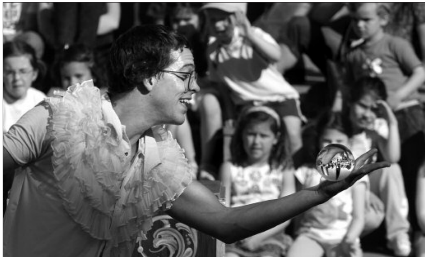
Manic Freak (Argentina)