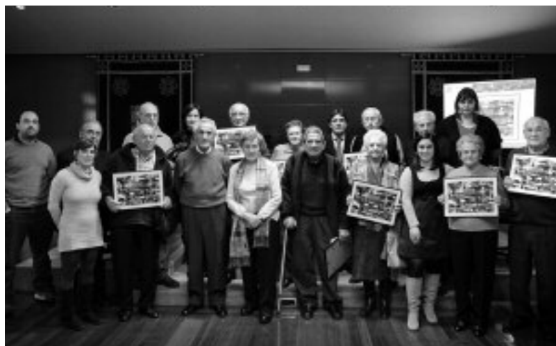
Mapa barria ikusteko: www1.geograma.com/erandio/eusk.callejero/irinetv.aspx

erandio > toponimia lanaren laguntzaileei oroigarriak etxez etxe