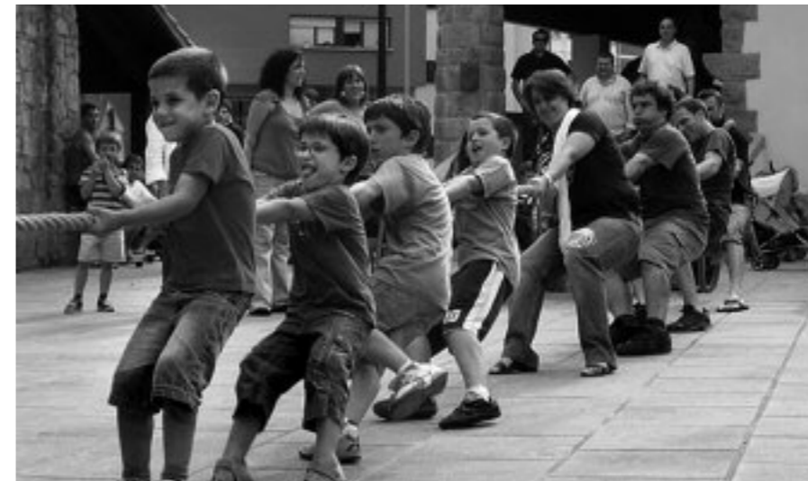
Edozein zalantza edo proposamenetarako: http://berbalamineuskeraz.blogspot.com

Txarrikia dastatu eta dantza egiteko, erdu San Bartolome auzora, ekainaren 12an