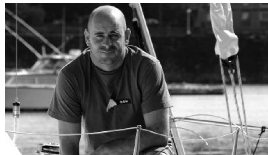
Informazio gehiago: www.getxo.net edo www.pakeabizkaia.com