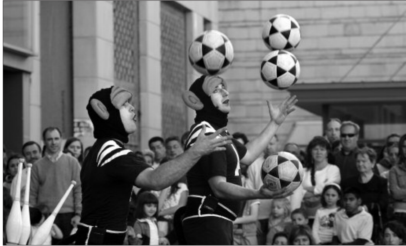
Capitan Maravilla (Andaluzia)