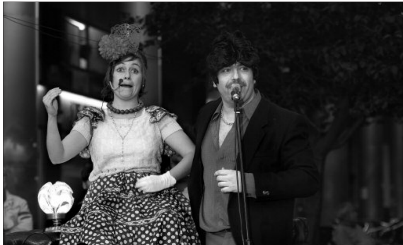
Teatro-teatro (Euskal Herria)