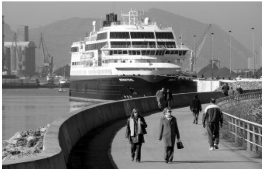
Gurutzontzia Getxoko Kirol Portuan

Getxora hurreratzen diren turista asko itsasotik edo itsasoak eskaintzen dituen aukerak erakarrita hurbiltzen dira; hori ikusita, Euskal Kostaldea Belaz programa indartu eta gurutzontzietan datozen lagunentzako pakete turistiko bereziak prestatu ditu Turismo eta Sustapen Ekonomikorako Sailak. MSC konpainiak, Getxon hasi eta amaituko den itsas bidaia antolatu du 2011rako.