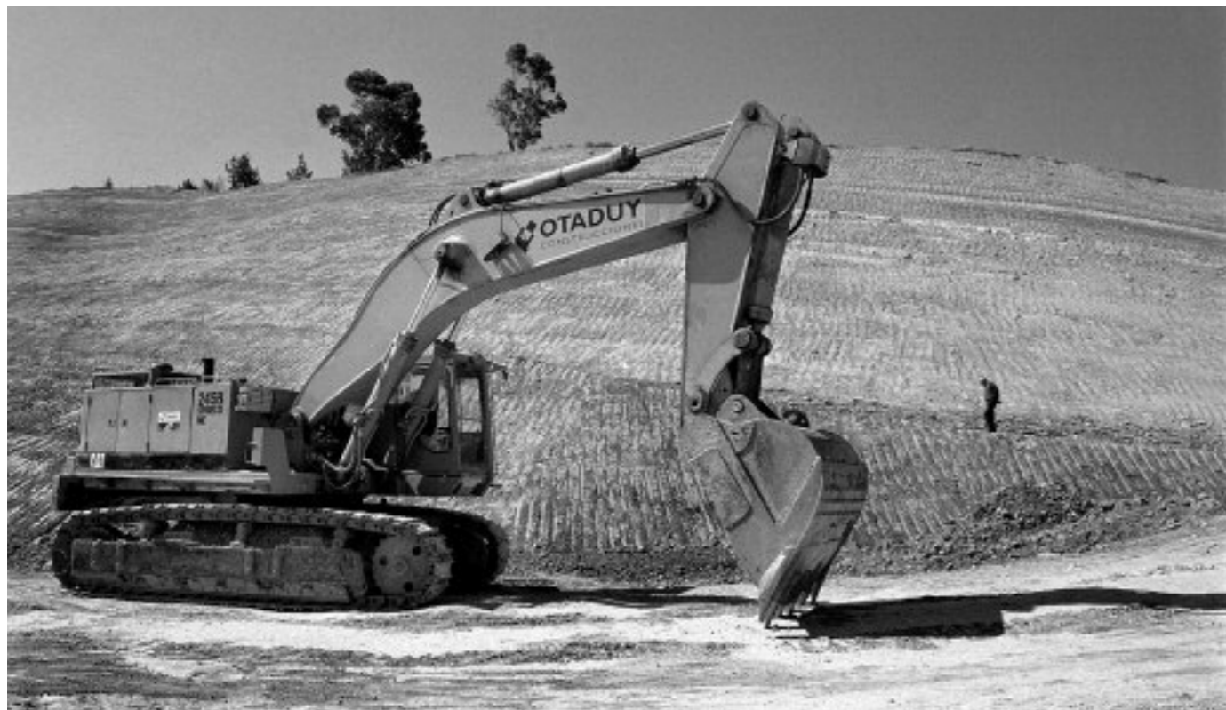
2006ko ekaina, Larrabasterra

Testua: Josu Arroyo