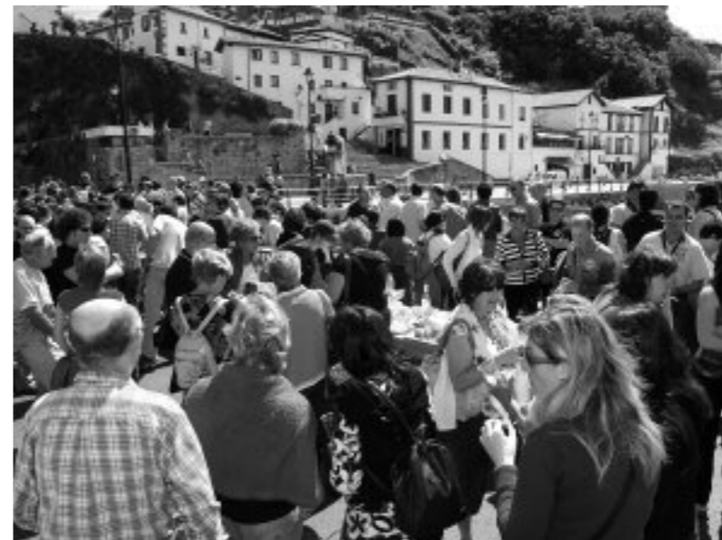
Algortako Portu Zaharrean ospatu zuten Mintza eguna orain urte batzuk

Uribe Kostako berbalagunok eta euskaldunok badugu hitzordu garrantzitsua datorren ekainaren 6an, Arrasaten. Mintza eguna ospatuko dute eta Euskal Herri osoko mintzalagunak elkartuko dira bertan. Egun osoko jaialdia izango da. Goizeko 11:00etan ekingo diote festari Biteri plazan, ongi-etorriagaz eta hamaiketakoagaz. Eguerdian ibilaldi gidatua egingo dute eta 13:30ean hasiko da kalejira, giroan murgiltzen laguntzeko. Bazkaltzeko herriko plaza nagusian elkartuko dira 14:30ean; txartelak han bertan erosi ahalko dira. Bazkalondoa egingo dute sari banaketa, eta loak inor harrapatu aurretik ekingo diote dantzari, 16:00etan; Kataia taldeak eskainiko du erromeria. Plan hoberik bai domekarako? Joan gura duena Getxoko Egizugaz jar daiteke harremanetan, autobusa antolatu du, eta agian, lekuren bat libre daukate oraindino; 619 935 541 telefono zenbakira hots egin dezakezu. Anima zaitez, mintza euskaraz! ○