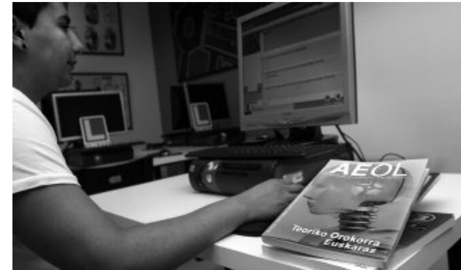
Getxoko bederatzid autoeskolak egin du bat ekimenagaz

ateratzeko aukera herriko bederatzid autoeskolatan