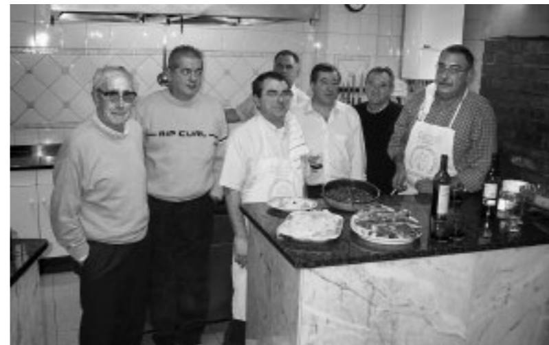
Bidebitarteko lagunak, aspaldiko argazkian

Berrogeitamar urte bete du Algortako Bidebitarte txokoak, auzoko zaharrena, eta herritar guztiakaz ospatuko dute. Izan ere, oso ezaguna da txokoa. Hamaika ekitaldi egin dute, Udalak edo herriko talderen batek behar duenean beti daude laguntzeko prest: ikastola, ALBE, UK, Getxophoto, pilota eskola... Kideak ere 50 dira, 80tik gora igaro da handik, eta hortaz, urteurrena, behar bezala ospatu beharra dago. Ekainaren 8an txokoaren sortzaileak omendu eta argazki erakusketa jarriko dute Geltokia plazan; han egingo dituzte ekimenak. Ekainaren 12an, bertsolariak arituko dira 13:00etan eta poteoan eta Los Txikis taldeak abestuko du. Domekan txahal errea banatuko dute, dantza erakustaldia izango da eta Biotz Alai abesbatzak kantatuko du. Zorionak eta urte askotarako! ○