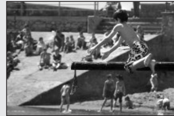
Algortako Portu Zaharreko jaiak

► Uribe Kostako Bertsolari Txapelketa: Finala. Algortako Villamonte Kultur Etxean. Ekainaren 12an, 18:00etan.