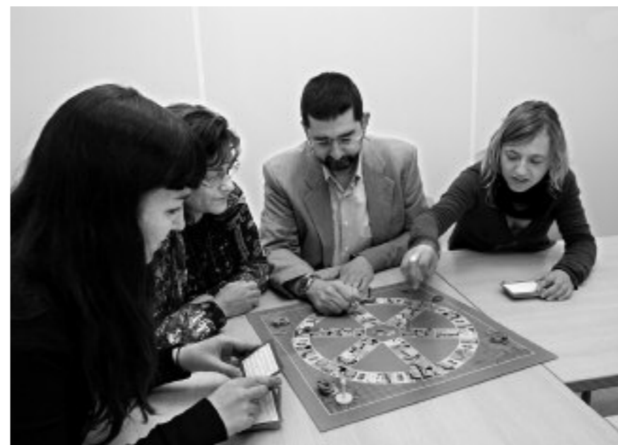
Mankomunitateko kideak Tribial Feministagaz

"Jokoaren bidez emakumeak kalera atera gura genituen"