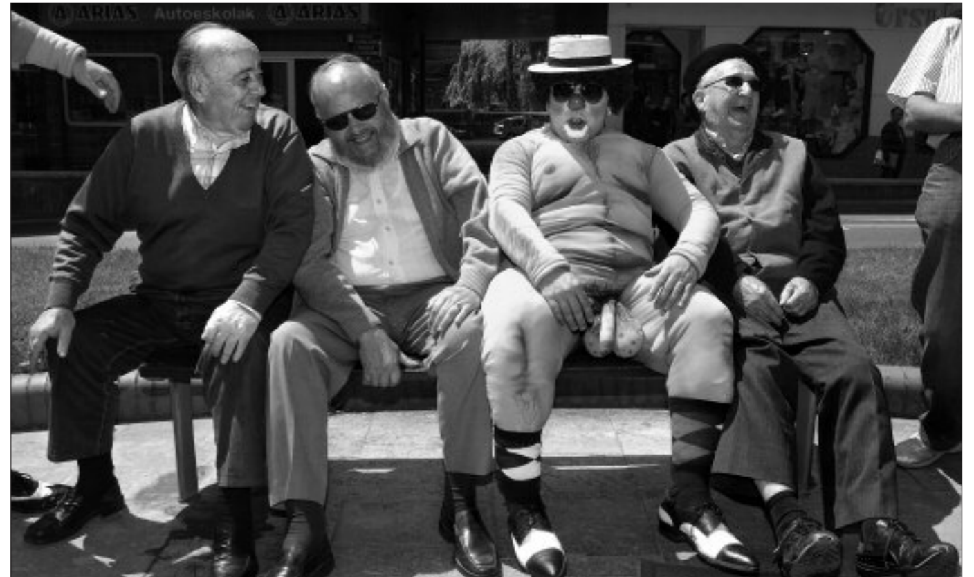
H20h! Clowns (Katalunia)