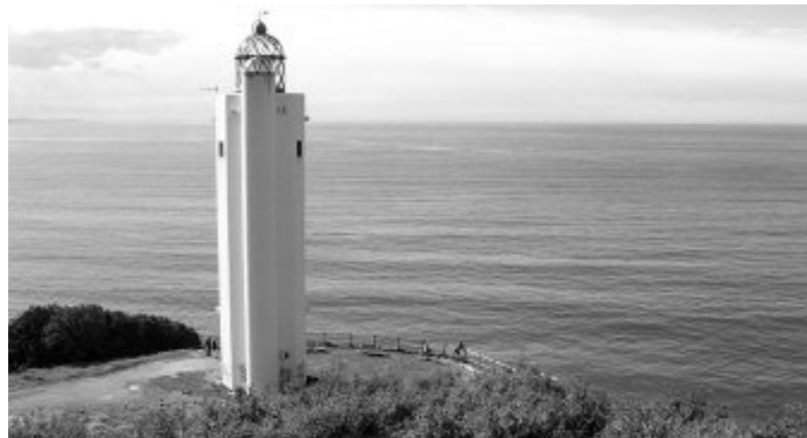
Itsasargira joateko bisita gidatuak Hondartzape jatetxetik urtengo dira

Turismo Bulegoak Gorlizko itsasargira joateko bisita gidatuak eskainiko ditu urriaren 30a arte. Maiatzean hasi ziren eta hamabostean behin egingo dira, zapatuetan. Turismo bulegotik itsasargirako ibilbideak duen aberastasuna azpimarratu gura izan dute: “Aurki itzazu Gorlizko Itsasargiko ibilbideak eskaintzen dituen natur eta ondare altxor harrigarriak, 6.000 urteko aremu-neak, XVIII. mendeko Azkorriaga gotorlekuko aztarnak, 40. hamarkadako kosta bate-