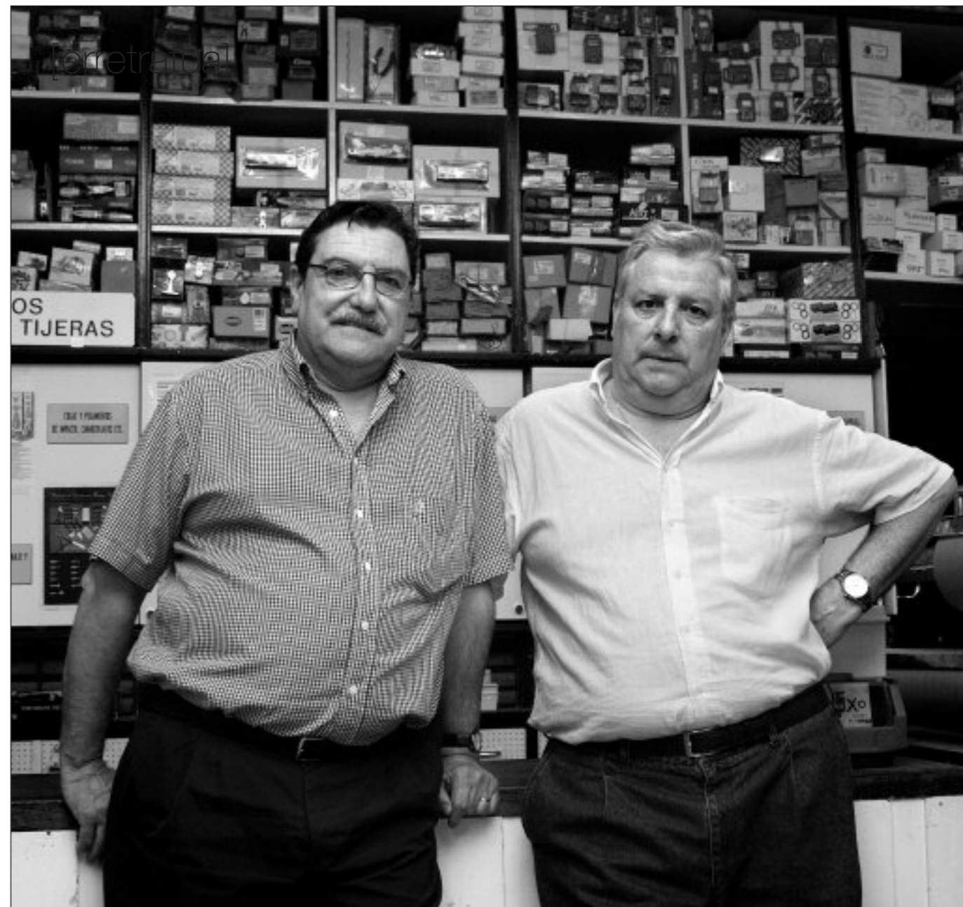
“Burdindegia baino Sorospen Etxea garelako dirudi”

Herriko toponimia bildu, sailkatu eta aztertu dituzte Erandion azken urteotan, ondoren toki-izen barriak finkatzeko. Barriak baino zaharrak esan beharko, ordea, desagertu edo ia desagertutako toki-izenak berreskuratu dituzte eta. Ezagutzera emateko, gainera, mapa eta kale-izendegi barria argitaratu eta aurkeztu zuten urtarril akabuan. Ekitaldi hartan oroigarriak banatu zituzten adineko hainbat herritarren artean; izan ere, beren oroimenari esker berreskuratu dituzte toki-izenak. Baina laguntzaile guztiek ez zuten ekitaldira joaterik izan, beraz, orain aste batzuk eroan diete oroigarria Udalekoek eta ikerketa lana egin duten lagunek. Baserriz baserri ibili ziren eta egun hartako irudiak partekatu gura izan dituzte UK-ko irakurleakaz. ○