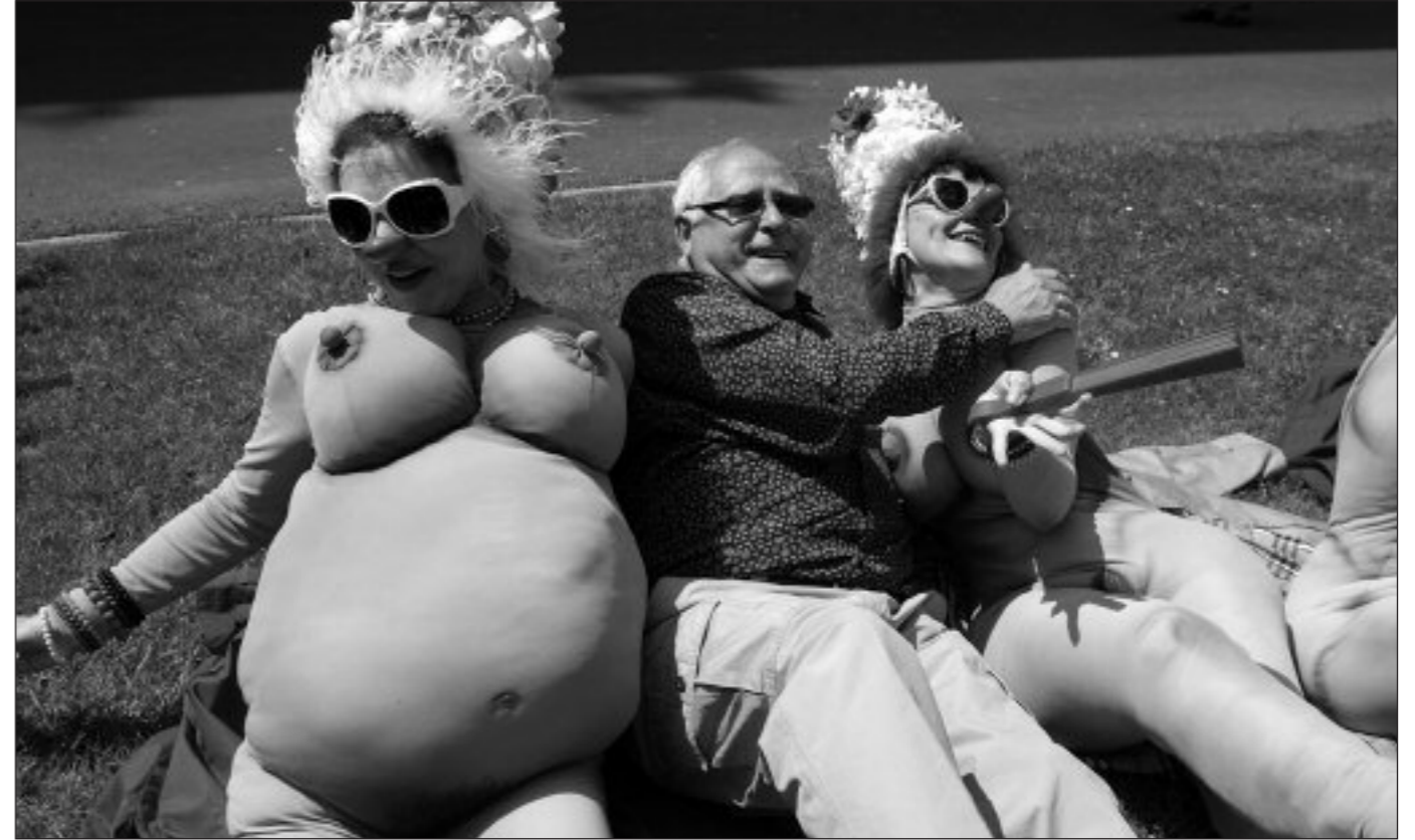
H20h! Clowns (Katalunia)