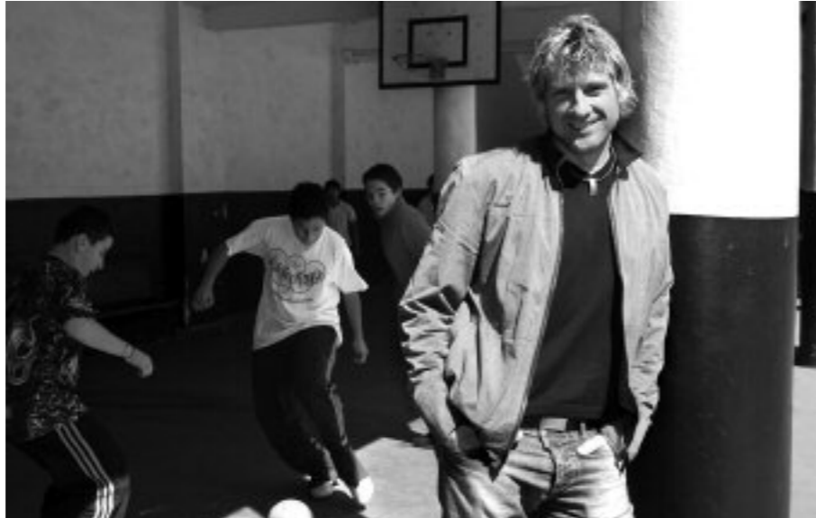
“Euskaltegira joan izan ez banintz, uko egin behar izango niokeen telebistari”

—Gauza asko. Egoera ezagutzen dut: euskara ezagutu bai, baina ez dute erabiltzen; elkarren artean gaztelera aritzen dira, ohitura horri heldu diotelako. Euskararekin izan dudana bizipena kontatu diet. Puntu batzuetan bitxia da, AEBtan jaio, euskaldundu eta 7 urterekin etorri nintzen; baina ezin euskaraz egin, Frankoren garaia zen. Ez nekien gaztelera, baina ikasi behar izan nuen. Gaztelera egiten nuen toki guztietan, eta euskara galtzen hasi nintzen: ikasleen parean jartzen naiz, gaztelera egiten nuelako errazago euskaraz baino. Baina ohartu eta ohitura aldatu nuen. Nik lortu badut, eurek ere lor dezakete. Euskara ikasteko hainbat arrazoi dago, gure hizkuntzaren atzean herriari nortasuna ematen dioten kultura, ohitura eta ezaugarri batzuk daude. Euskaldunak gara eta gurea mantendu behar dugu,