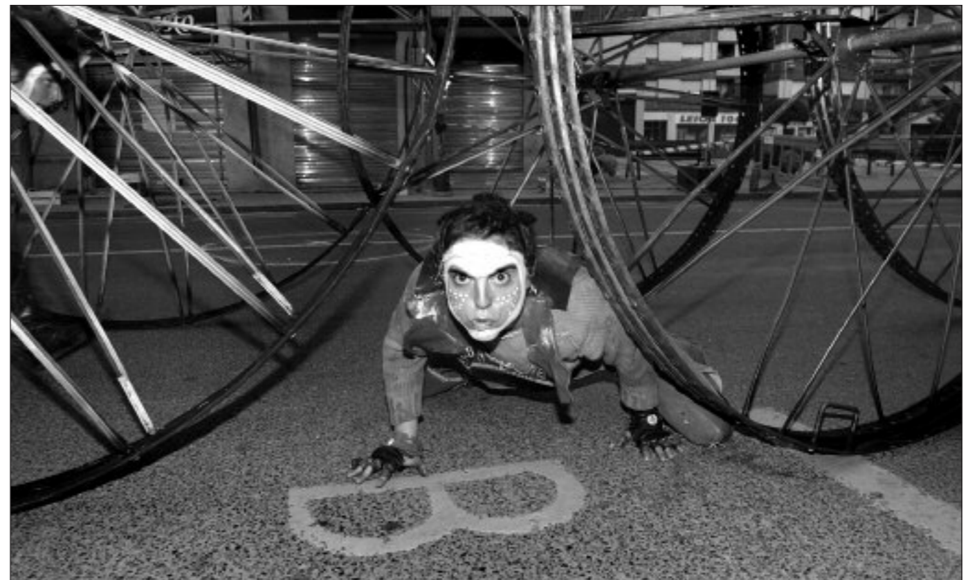
En la Lona (Euskal Herria)