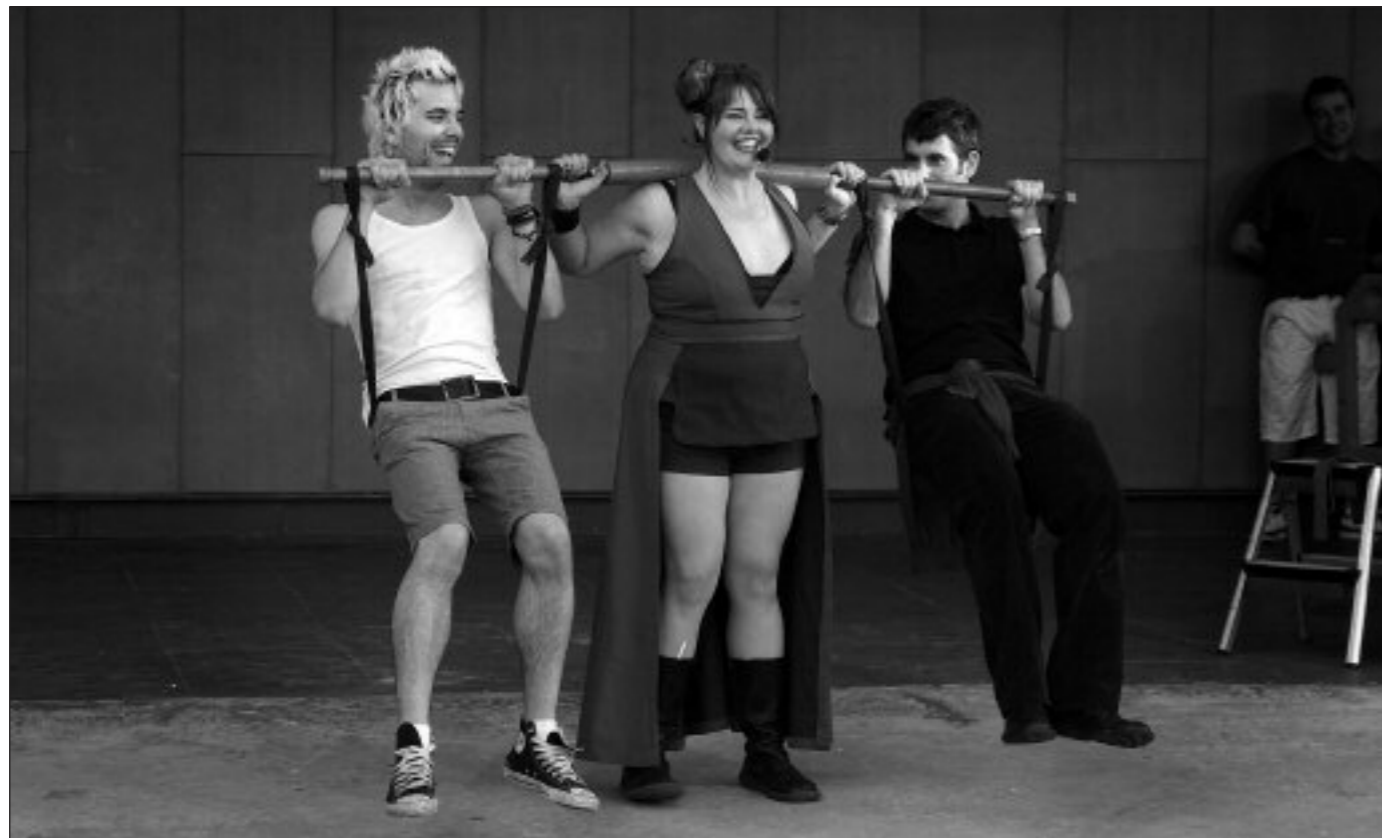
Strong lady (Australia)