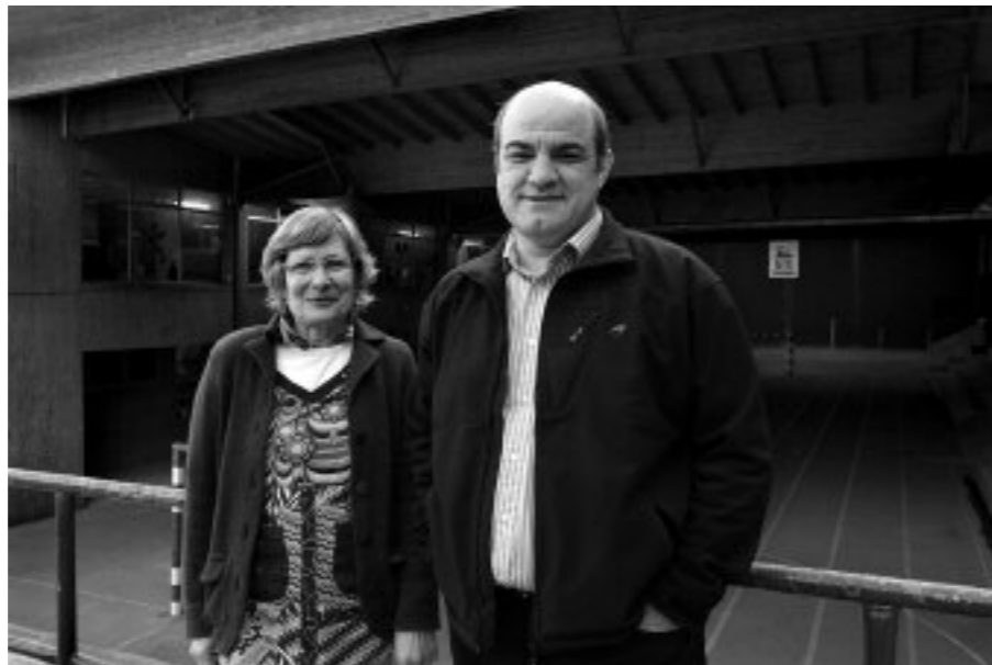
Estalitako jolastokia da aldaketan abididerik agerikoena

—Heziketaren etorkizuneko erronkei erantzun gura diegu eta gure egitasmoa sendotu. Kurrikulumak eskatzen du teknologia barriak sartzea, informatika ez da