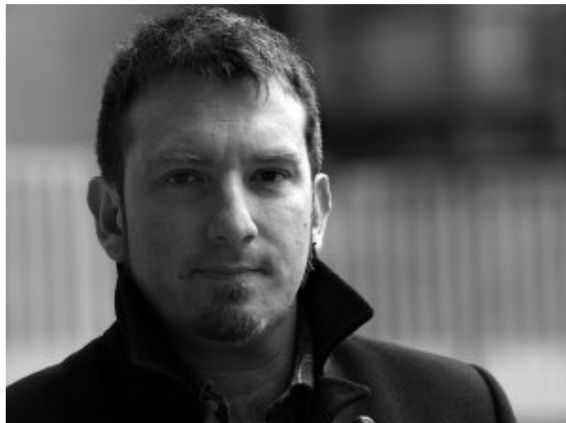
Matrikula egiteko eta informazio gehiago: www.ueu.org

bertsoak > izena eman daiteke Bertsolandegian parte hartzeko