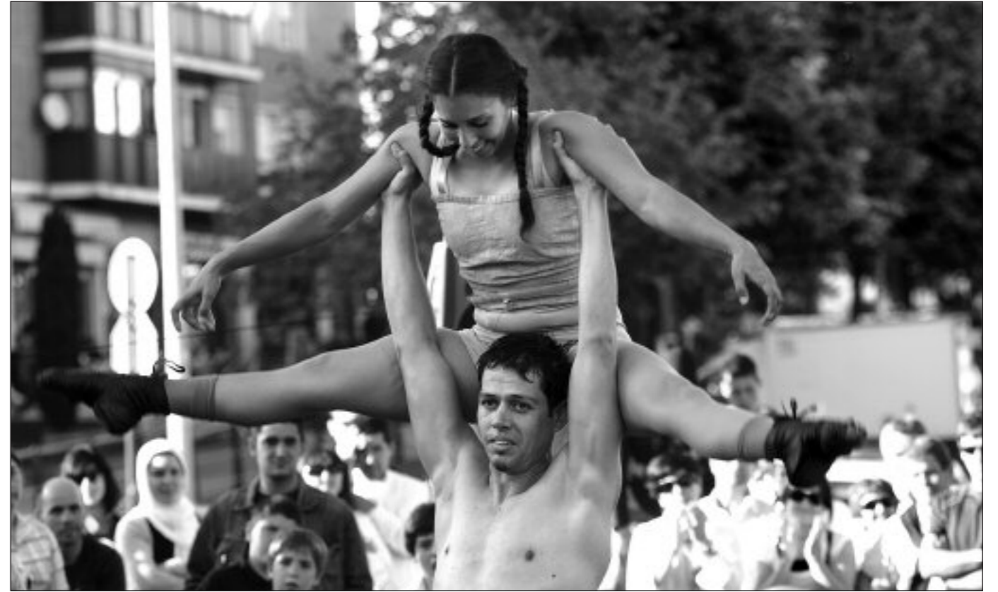
Circ Petit (Katalunia)