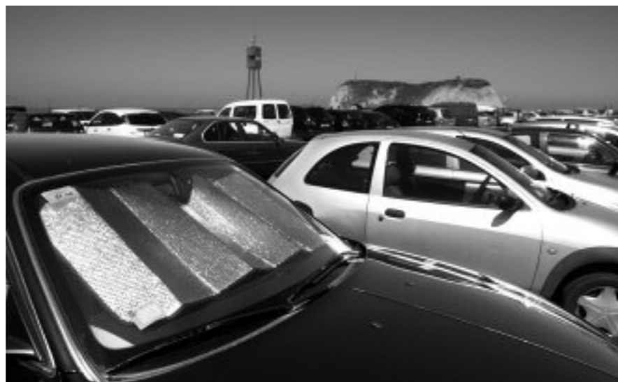
TAORik ordaindu gura ez duenak Sopelbus zerbitzua erabiltzea dauka udan

Sopelbus zerbitzuak eskaintza handitu du aurten: abenduaren 31 arte lotuko ditu herri erdigunea eta hondartzak. Bidaia 0,50 euro kostako da, eta 12 bidaiako txartelek, 5 euro.