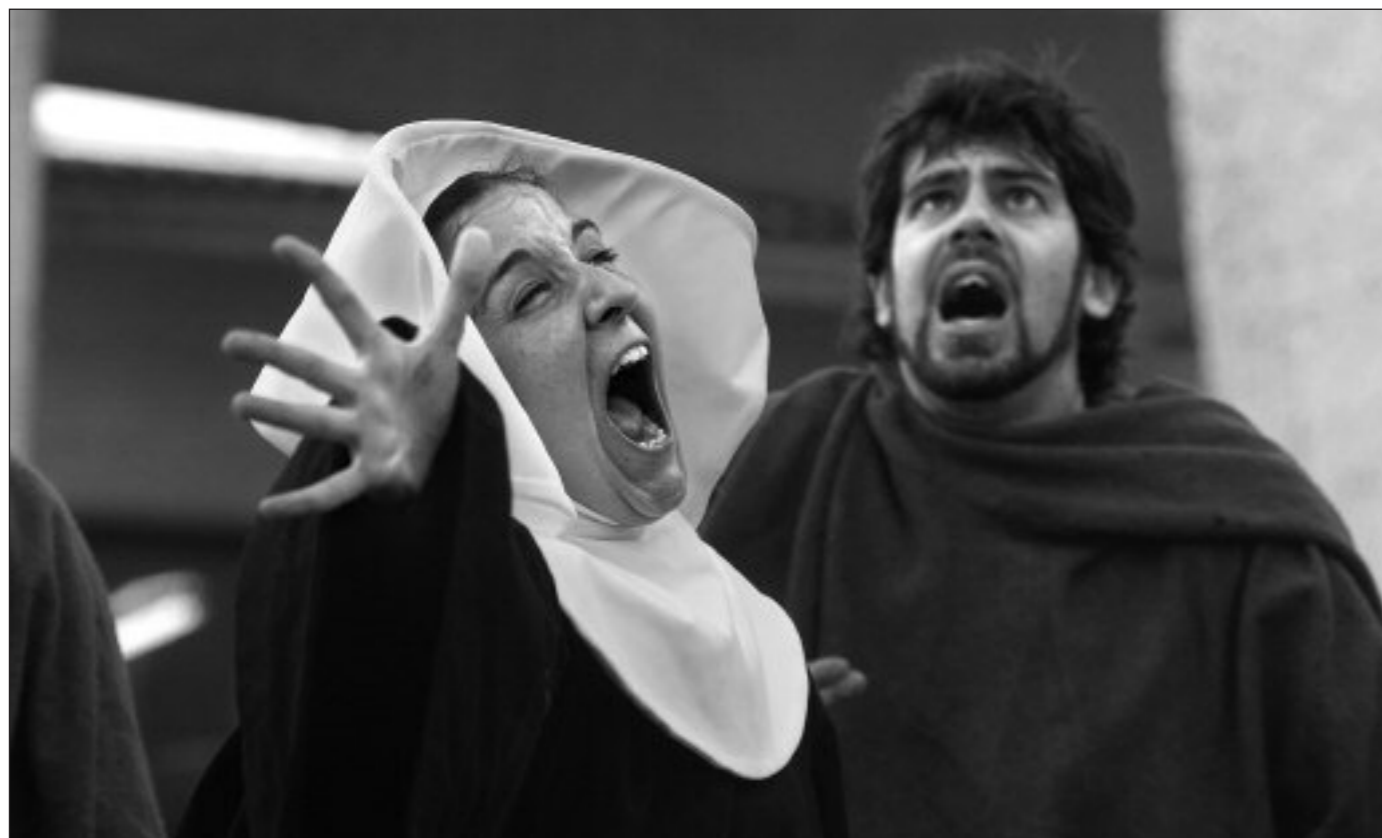
Nacho Villar-Gaupasa Producciones (Murcia)