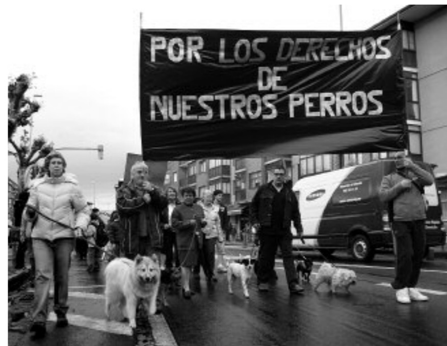
Interneten topa ditzakezu perrosdesopelana.blogspot.com helbidean

"Ordenantza aldatu dute, eta ez da gutxi, baina gai asko dago landu barik"