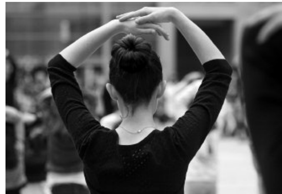
Dantza klasikoa ikusi ahal izango da, beste askoren artean

Hiru egunez, 11, 12 eta 13a Biotz Alai plaza hartuko dute herriko dantza eskolek