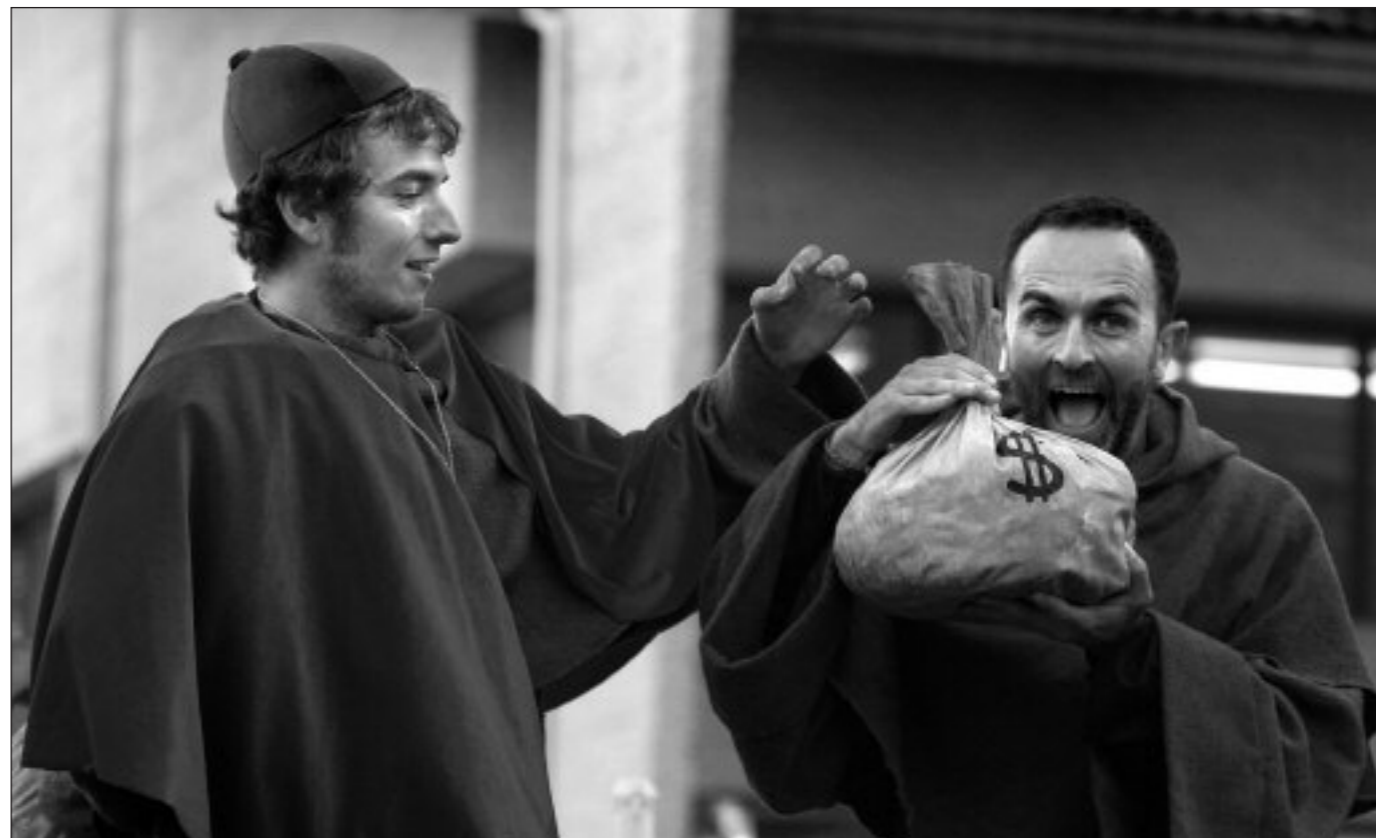
Nacho Villar-Gaupasa Producciones (Murtzia)