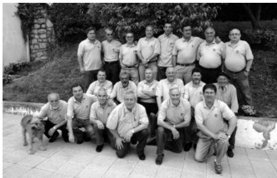
Berangoko txakolin egileak

Berangoko txakolin egileen zukuia dastatzeko aukera Txakolin Egunean, ekainaren 6an