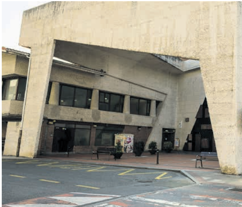
Azken urte bietan milioi bat euro gastatu dute Sakoneta konpontzen.