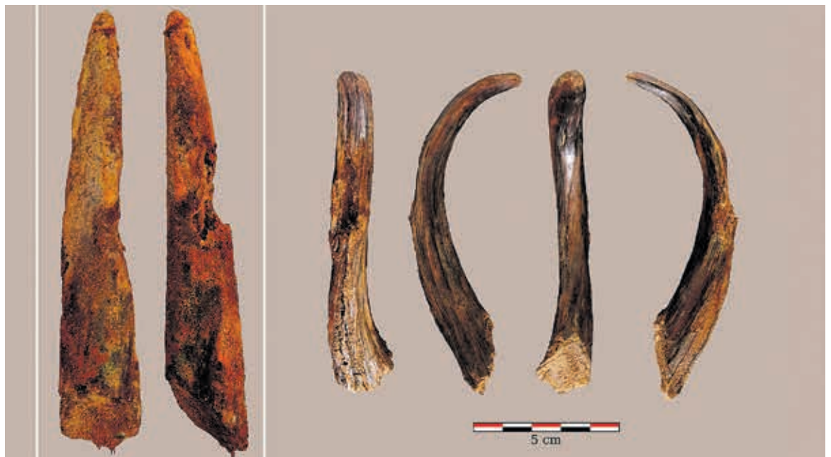
Aranbaltzan aurkitutako lanabesa eta bestelako material organikoa.

Gaur egunera arte, Iberiar penintsulan Bartzelonako Abric Romani sedimentu trabertinoetan soilik aurkitu dira mota horretako materialak. Europar, aldiz, lau aztarnategitan barrik topatu dituzte egurrezko lanabesak: Clacton on Sea-n, Schöningen-en, Lehringen-en eta Poggetti Vecchi-n. Hortaz, Aranbaltzako aurkikuntzak Erdi Paleolitoko teknologia hori aztertze bidea erraztuko die adituei. Joseba Riosek azaldu duenez, lehenagotik ere bazekiten neandertalek egur asko erabiltzen zutela erremintak egiteko, baina ezinezkoa zuten jaki-