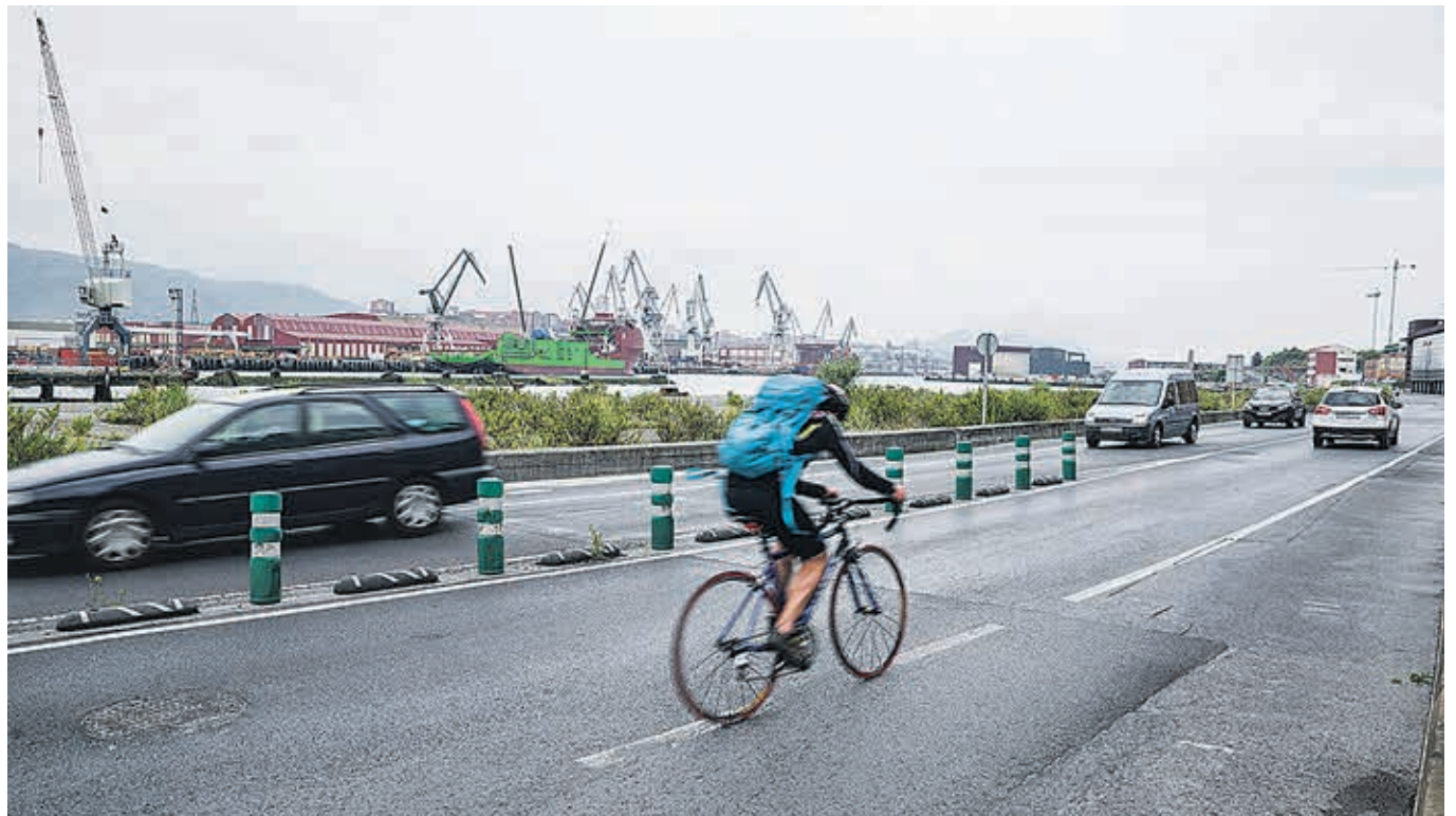
Itsasadarreko errepedea hainbat eragileren lehenetsunetako bat da. HODEI TORRES

Joan den urtarrilean aurkeztu zuten Erandioko HAPOn aurrerapena. Daborduko herritarren eta eragileen iradokizunak jaso dituzte, auzo nagusietan jendaurreko berbaldiak, bilerak eta erakusketak antolatu ostean.