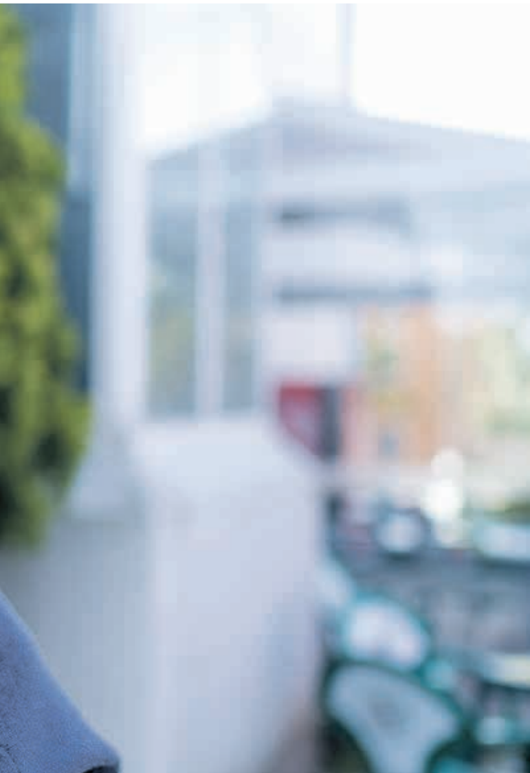
«Merezi du ona bazara, dirua dago eta. Baina hori orain da horrela, lehen ez». HODEI TORRES

«lasterketa irabazita daukat». Baina gurpilari itsatsi zitzaidan. Eta Arenazak irabazten uzteko... «Berak ahal badu» erantzun eta Ariñori bota nion: «Tira ezazu, bestela harrapatuko gaituzte. Zu indartsu zaude». Eta berak baietz, bere gurpilari jarraitzeko. Bermeon berriro ekin genion Sollubera igotzeari. Gaietik 200 bat metrora eraso egin eta bertan botata utzi nuen. Bermeora ihes eginda heldu nintzen. Sardina-saltzaileek balde handi batean atera zidaten ur epela. Arropa denak kendu nituen eta bertan dutxatu nintzen, zer inozoa nintzen! Eta denak barrezka nire inguruan. Ostean, saria kobratzera joan nintzen eta 100 pezeta eman zizkidan gizon batek, aholku bategaz batera: «Mutiko, potroak ondo ipinita dituzu baina oraindino asko daukazu ikasteko errepidean».