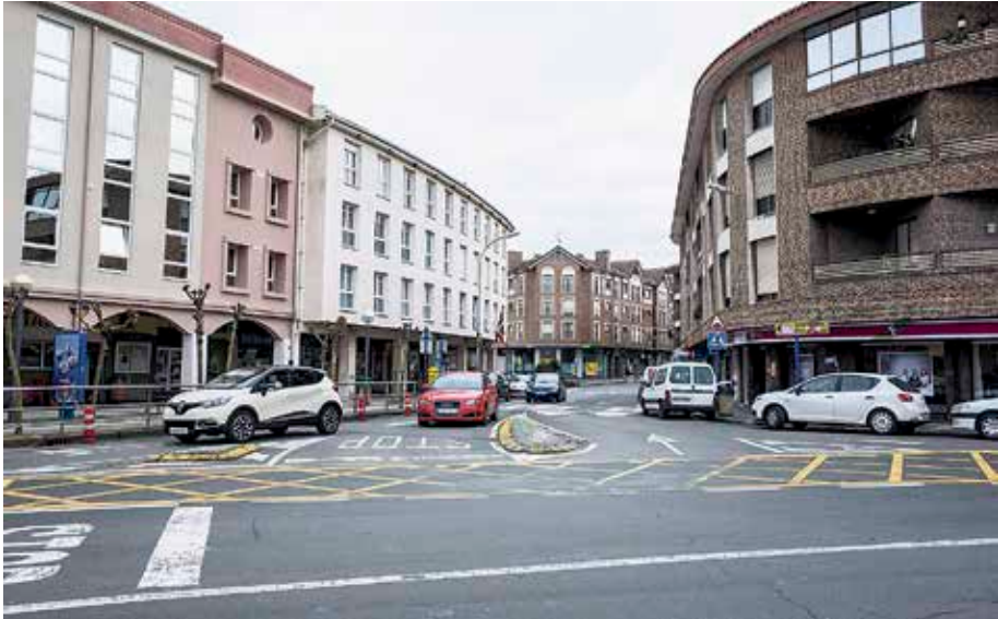
Udaletxetik elizarrainoko espaloiak zabalduko lirateke, Zipiriñeko zebraidea moldatzeaz gainera.