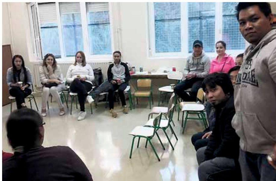
Ikasturteko lehen hiruhilekoan lortutako emaitzakaz «pozik» daude.

Eskolan sendien partaidetza areagotzeko egitasmoa martxan ipini du Leioako Udalak, udalerrian dauden Lehen Hezkuntzako bost ikastetxeetan.