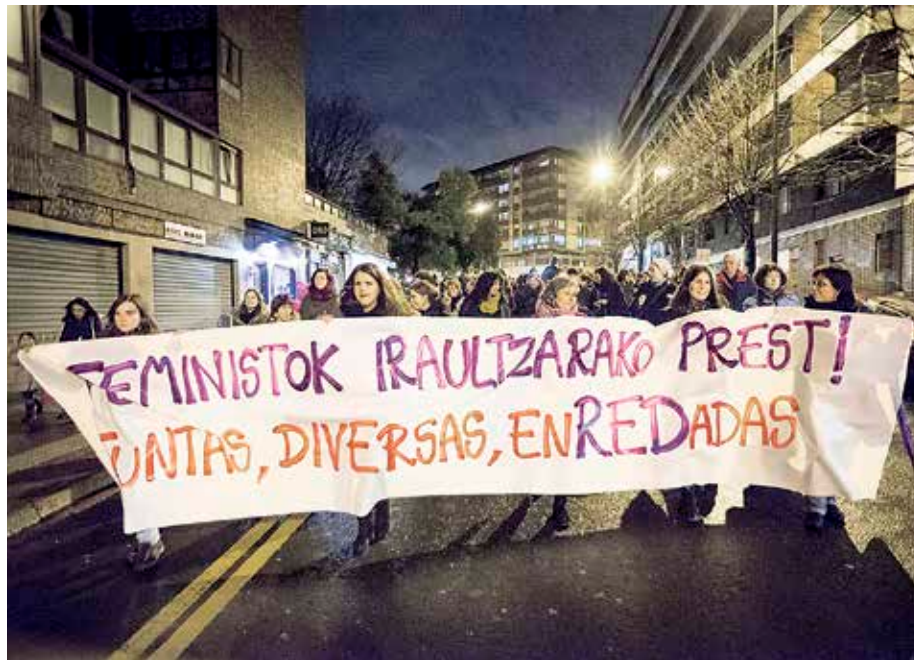
Domeka honetan, hilaren 12an, mugimendu feministako kideakaz kafe-tertulia egongo da.