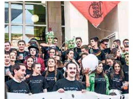
Sopolako kuadrillen aldarria, iazko jaietan.

tzun duenez, «urtero legez, askatasunean eta elkartasunean oinarritutako jaiak izateko ari gara lanean, sopoloztar guztiok goza ditzagun jaiak izateko. Orain egun batzuk adierazi nuen moduan, Sopolako Kuadrillen Koordinakundearen beharrak entzuteko konpromisoa hartu du Udalak, eta buru belarri jarraituko dugu lanean jaiak errespetu osoz gara daitezen». ◀