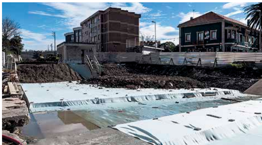
Herritarrek hainbat proiekturen artean bozkatu ahal izan dute oraintsu.

Urdulizko Udalak 17,9 milioi euroko aurrekontuak onartu ditu urte honetarako. Proposamenak EAJren babesaren izan du; EH Bilduk kontra bozkatu zuen, eta DB-TU ez zen osoko bilkurara aurkeztu. Koalizio abertzaleak kritikatu du aurrekontuak Gobernu-taldeak «bakarrik» osatu dituela. Modu berean, deitoratu du inbertsioetarako aurreikusitako 13 milioi euroetatik 900.000 euro «bakarrik» gastatuko direla parte-hartzeko prozesuaren bidez. Joan den hilabetean, auzokideek Udalak proposatutako hainbat proiekturen artean botoa eman ahal izan zuten, zeintzuk egitasmo egitea gurago zuten adierazteko.