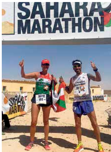
Beristain eta Salvador.

Sahara Maratoiaren helburuak dira, kirol-mailakoak alde batera utzita: herri sahararraren egoera nazioartean gogoraztea eta jendarte-laguntza zabaltzea Tindouf-eko errefuxiatu-kampamentuetan. Ohi legez, Euskal Treenebideetako Langileak Mugarik Gabe elkarteak botikak eroan zituen. ◀