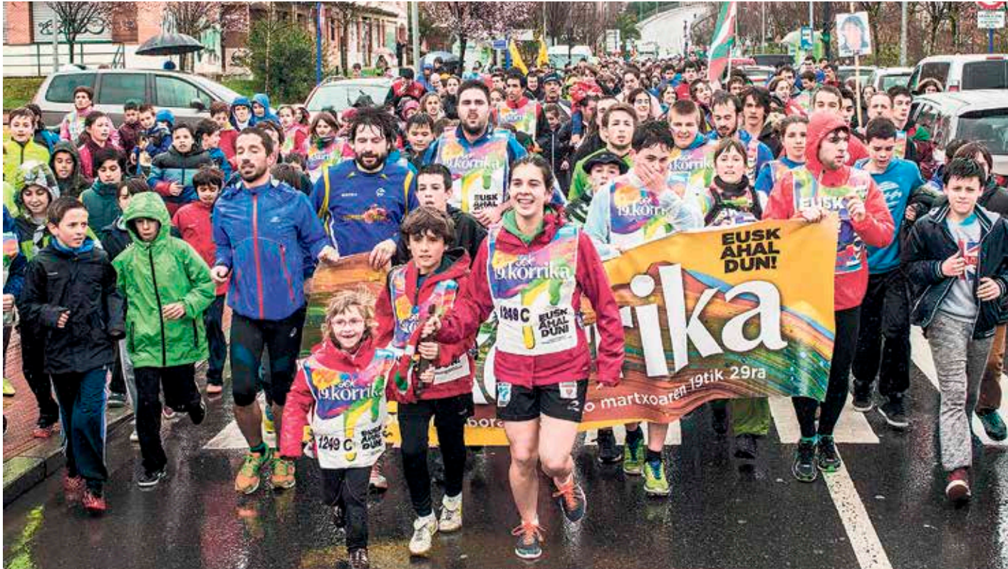
Eskualdeko aurkezpena barikuan egingo dute, Itzubaltzeta/Romoko parroikia-etxeko ekitaldi-aretoan, arrastiko 07:00etan.