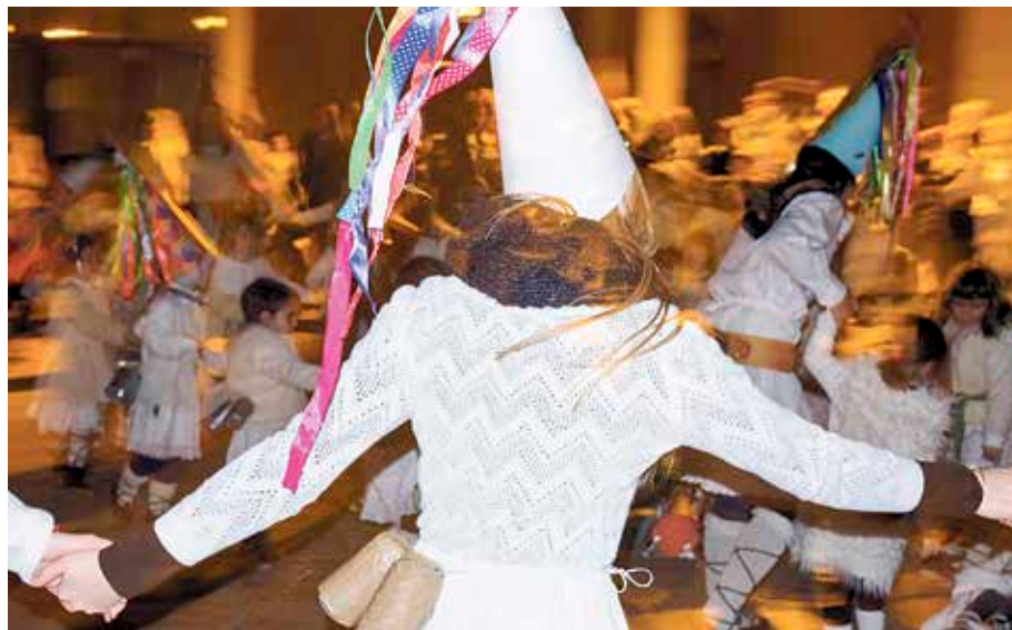
Mozorrotxeagaz baterra, tostadarik onena ere aukeratuko dute zapatuan.