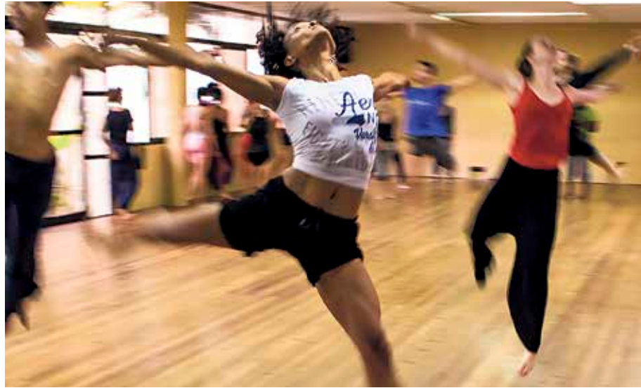
Funky-dantzaren tailerra Altzagan izango da, martxoaren 29tik ekainaren 7ra.