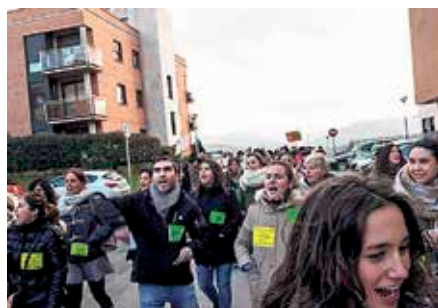
Berrehundik gora langile dira.

B ariku honetan, hilaren 10ean, mahaiaren bueltan batuko dira Erandioko Quirón ospitale pribatu sindikatuak eta enpresako ordezkariak. Batzar horren emaitzaren arabera, gerta liteke sindikatuak datoren eguaztenerako, martxoaren 15erako, deitutako greba-eguna berrestea ala bertan behera uztea. Halere, ez da lar baikorra Langileen Batzordea; ELA, CCOO eta Satse sindikatuak osatzen dute. Pasa den astelehenean egin zuten lehenengo greba-deialdia, «ia erabateko segimenduagaz», jakinarazi dutenez. Orain dela bost hilabete ekin zioten negoziatzeari, hitzarmen propioa aldarri nagusizat jota. Diotenez,