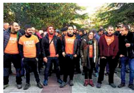
Epaitutako gazteetako batzuk.

B arikuan, martxoaren 10ean, ekimen berezi bat egingo dute Erandioko Kalezulo gaztetxean. 21:30etik aurrera, bertan izango dira Mafalda Valentziako ska, reggae, funk eta hardcore musika-taldea eta Huntza erromeria-taldea, Aldapan gora! kanta ezagunaren egilea; ondoren, Kurloi Ezkertiarren Esnea disko-jarzaileak goizeko 06:00ak arte girotuko du festa. Afaltzeko aukera ere egongo da. Ekimenaren helburua da Itzubaltzeta/Romoko gazte biren eta beste sei euskal herritarren isunak eta defentsa-gastuak kitatzea. Gazteak 2015eko maiatzaren 18an atxilotu zituzten,